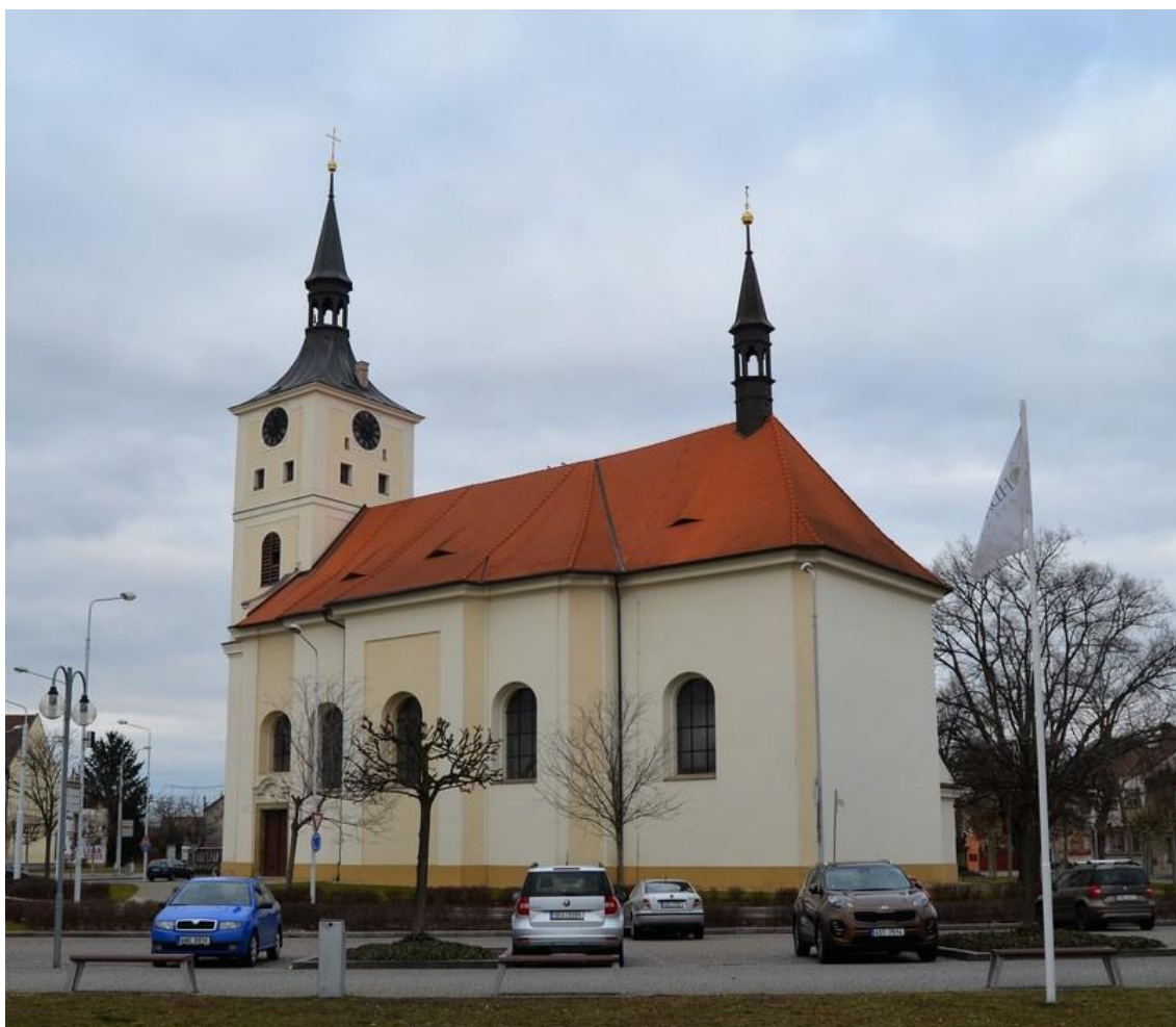
Příloha č.3. Kostel v Lázních Bohdaneč z jižní strany. Na věži kostela je dobře vidět komín. Foceno roku 2022.