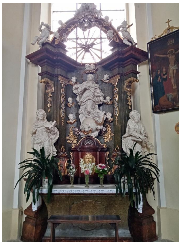
Příloha č. 7. Oltář Neposkvrněného početí Panny Marie. Plastiky Rohrbach. Foto 2022.