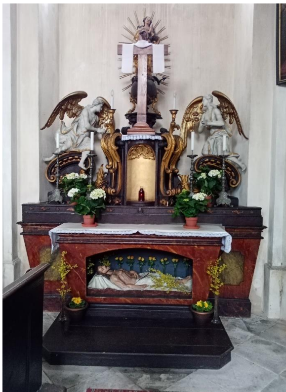
Příloha č.12. Boží hrob na Velikonoce 2022