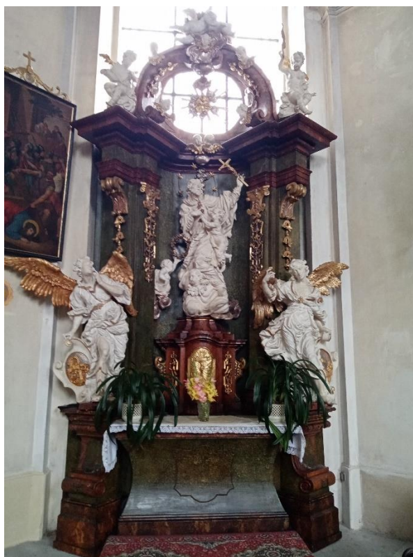
Příloha č.8. Oltář sv. Jana Nepomuckého a Paladium České země. Plastiky Rohrbach.