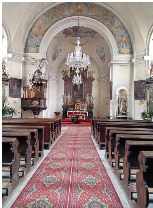
Příloha č.4. Průhled do lodi kostela. Foto z roku 2022.