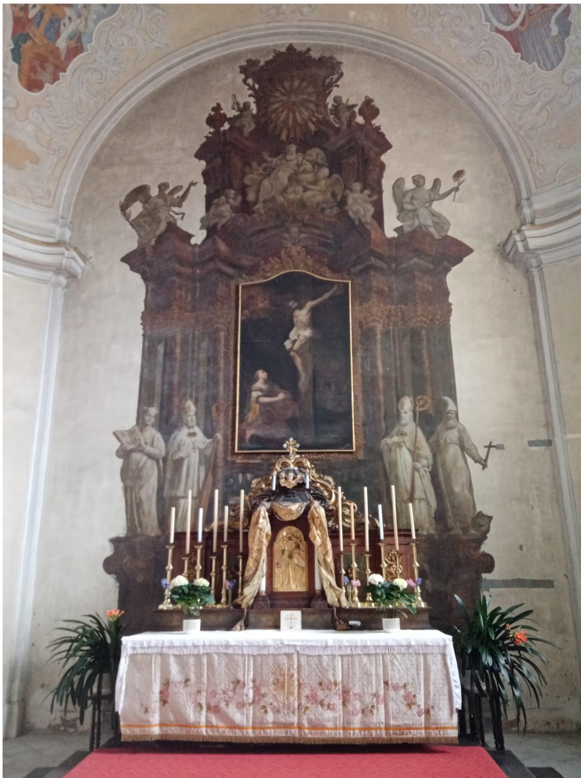
Příloha č. 5. Iluzivní hlavní oltář od Kramolína a obětní stůl. Foto z roku 2020.