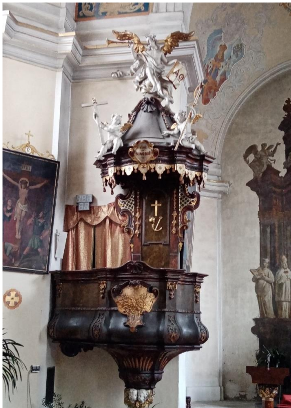
Příloha č.11. Kazatelna – soubor soch Rohrbacha. Foceno roku 2022