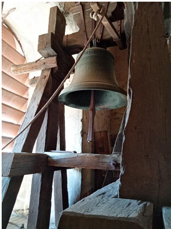
Příloha č.16. Pohled do zvonice, zvon Poledník Foto 2022