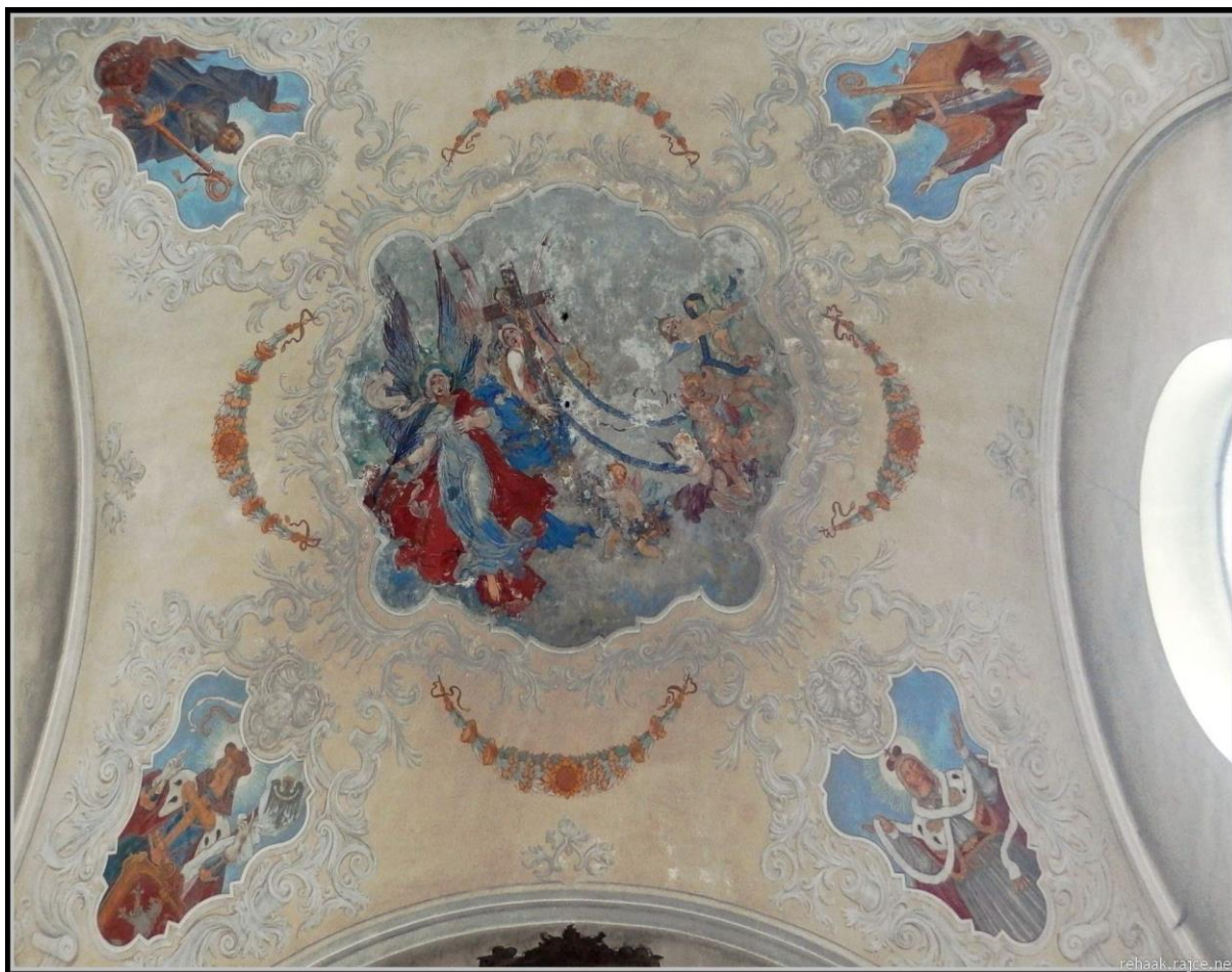
Příloha č.15. Výmalba presbytáře. Povýšení sv. Kříže od Antonína Huslera