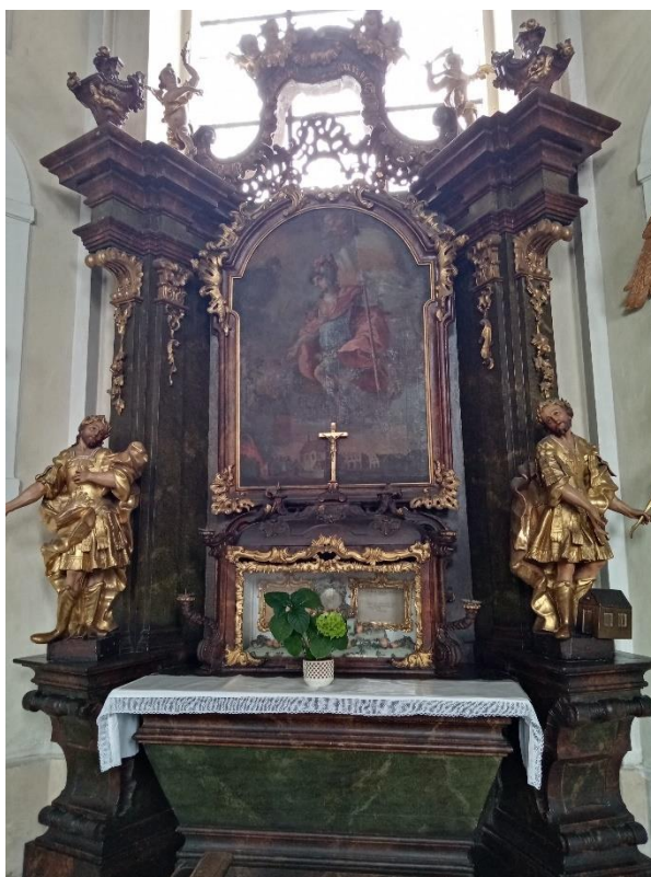
Příloha č.13. Oltář sv. Floriána s obrazem požáru Bohdanče Foceno 2015