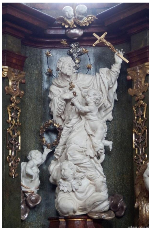
Příloha č. 9. Rohrbach, sv. Jan Nepomucký, detail. Foceno roku 2022.