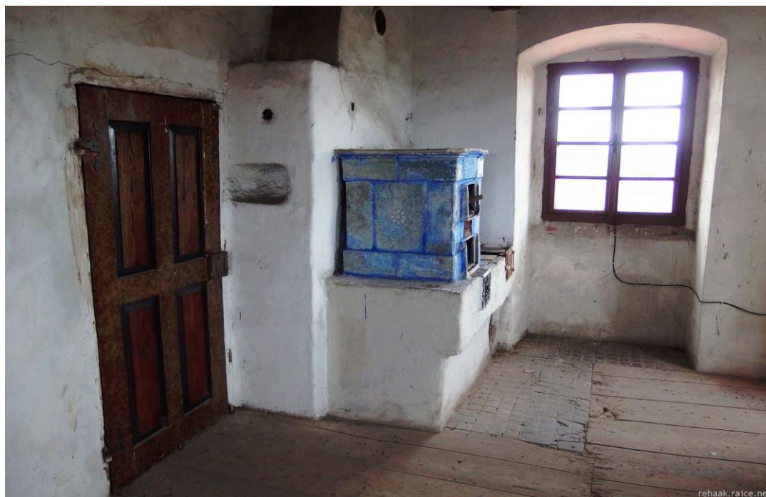
Příloha č.17. Pohled do bytu pověžného.