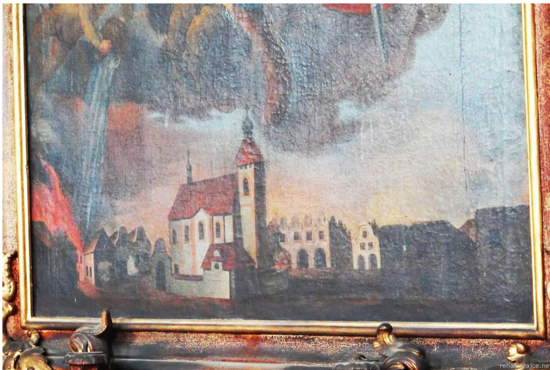
Příloha č. 14. Detail obrazu z oltáře sv Floriána s požárem Bohdanče, a ještě s nezvýšenou věží. Foceno 2015