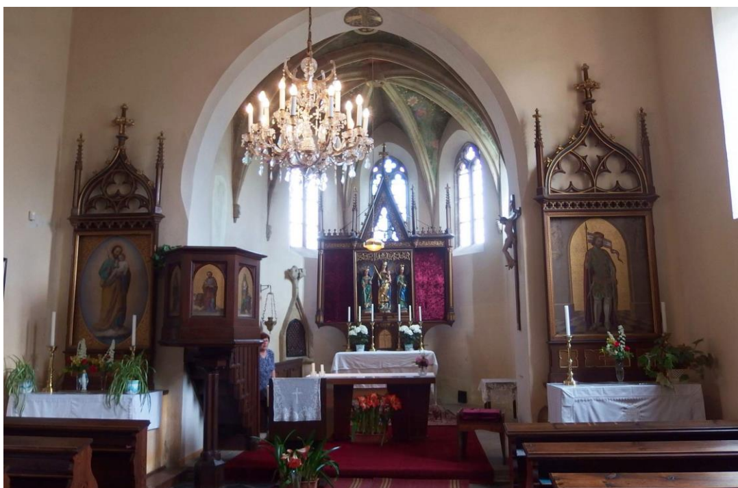
Příloha č.2. Interiér kostela v Živanicích