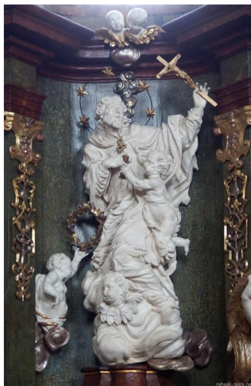
Příloha č. 9. Rohrbach, sv. Jan Nepomucký, detail. Foceno roku 2022.