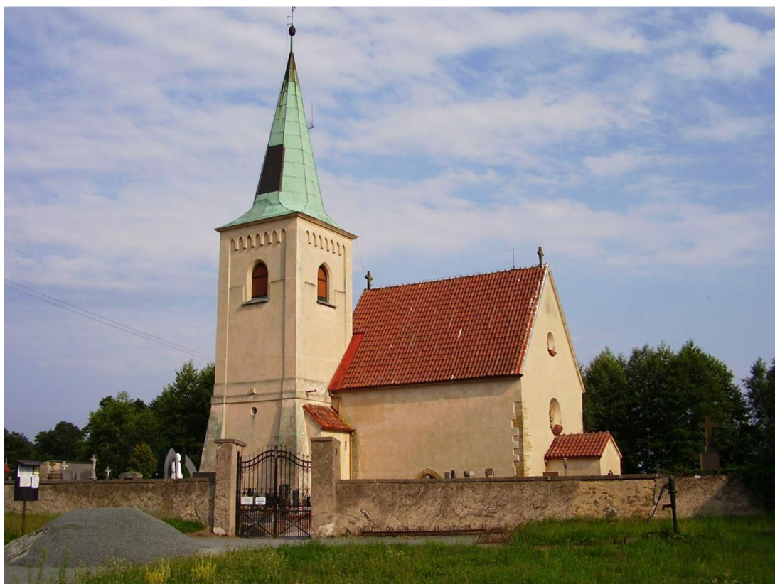
Příloha č. 1. Filiální kostel Navštívení Panny Marie v Živanicích. Foto 2015