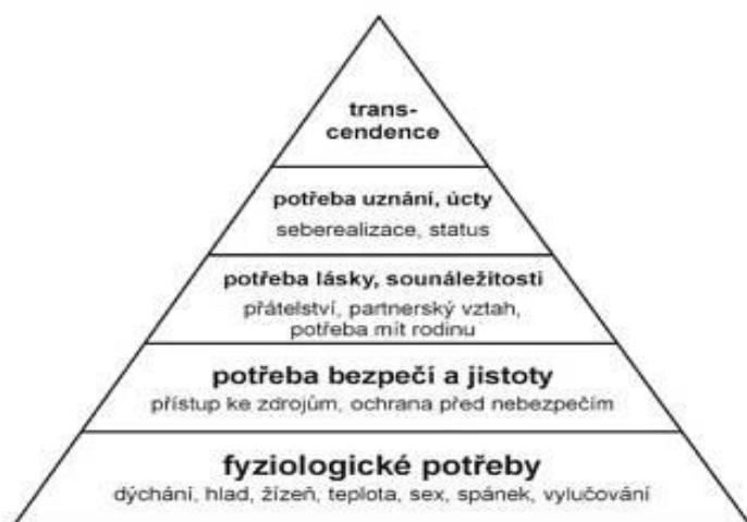
Obr. 2 Maslowova pyramida lidských potřeb

Potřeby, které se realizují v rámci určitého životního stylu, vystihuje Maslowova pyramida. Dle Maslowa lze uspokojit vyšší potřeby až po uspokojení potřeb nižších. Pokud prezentujeme Maslowovu pyramidu v souvislosti s životním stylem dlouhodobých uživatelů dávek hmotné nouze, pak lze vyslovit domněnku, zda tito uživatelé budou schopni plně a kvalitně realizovat, vzhledem ke svým možnostem, nadstavbové potřeby pyramidu.