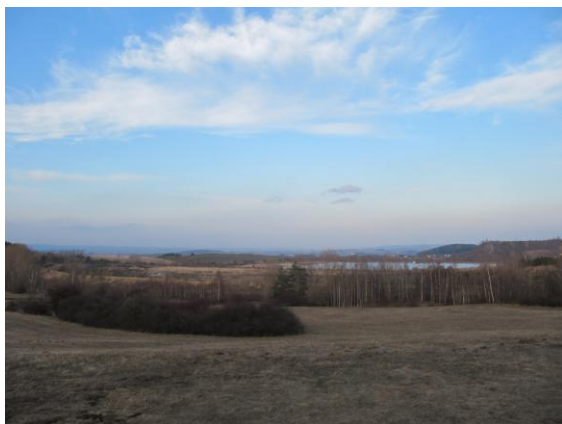
Obrázek č. 2: Odkaliště na katastru obce

rekultivace ploch z těžby uranu podniku Diamo s. p. Zastupitelstvo obce nemělo proti tomuto plánu připomínky.