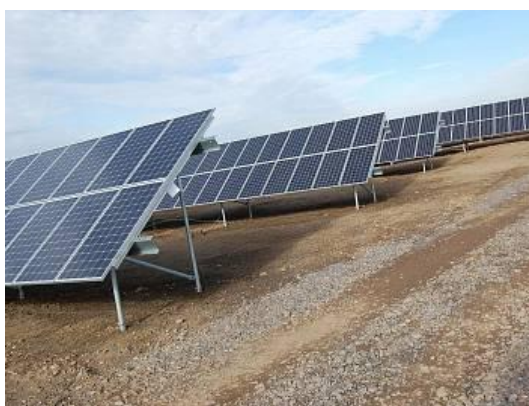
Obrázek č. 3: Fotovoltaická elektrárna 42

Zastupitelstvo přistoupilo na výstavbu sluneční - fotovoltaické elektrárny v severní části území na ploše bývalé skládky komunálního odpadu. Tato plocha byla po zrušení skládky biologicky zrekultivována. Zvolená plocha pro elektrárnu byla vhodně vybrána, nenarušuje vzhled krajiny a okolí, z dálkových pohledů se neuplatňuje a využívá neúrodnou půdu po skládce. Obec z pronájmu pozemku pro tuto elektrárny získává finanční prostředky. Elektrárna ekologicky dodává elektřinu do sítě.