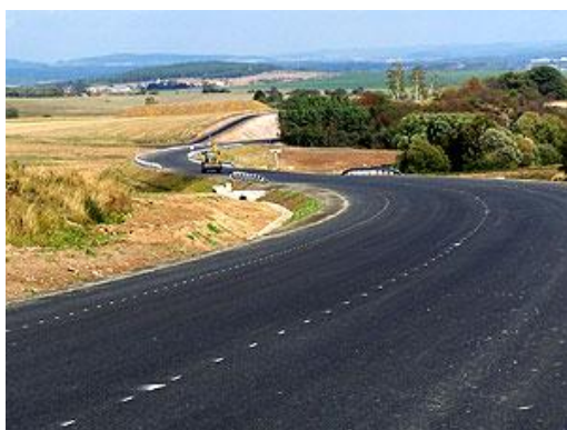
Obrázek č. 1: Silnice I/18 41

Silnice I/18, která prochází severní částí katastru obce je jednou z částí obchvatu města Příbram, na východě se napojuje na silnici vedoucí na Prahu. V západní části katastru obce Dubno je plánováno pokračování obchvatu Příbrami. Silnice I/18 dříve procházela obcí. Z hlediska životního prostředí je obchvat přínosem pro obec. Snížila se hluchnost, prašnost a bezpečnost v obci. Před výstavbou této silnice byla zpracována studie EIA, která řešila vliv nové silnice na životní prostředí. U plánovaného obchvatu Příbrami na západě katastrálního území, který územní plán převzal z vyššího stupně dokumentace, zastupitelstvo prosadilo do návrhu umístit v blízkosti obce ochranou protihlukovou zeď.