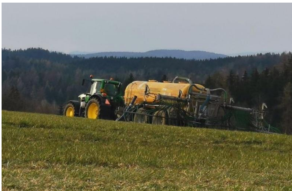
Obr. 6 Traktorem vlečená cisterna s hadicovým aplikátorem