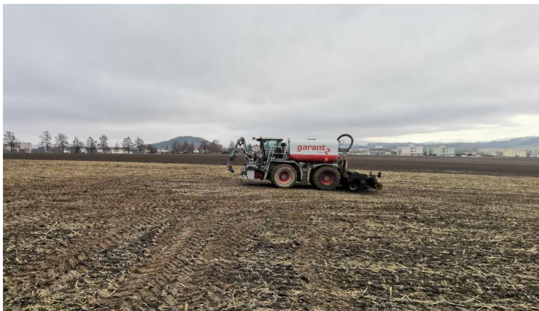
Obr. 5 Aplikace na orné půdě