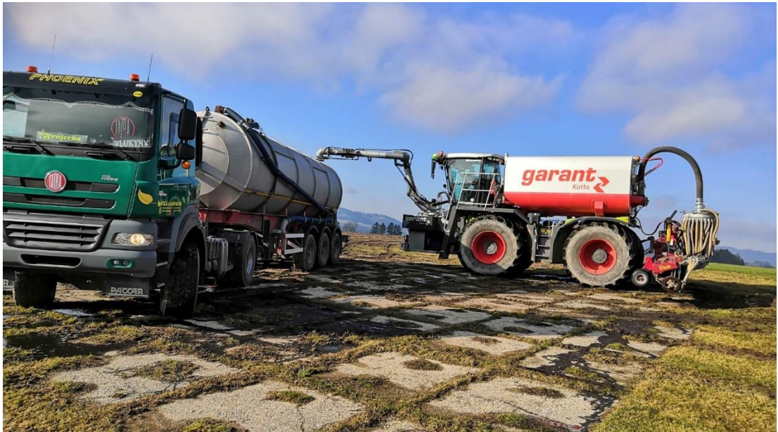
Obr. 3 Čerpání hnojiva z cisterny do samohodného aplikátoru