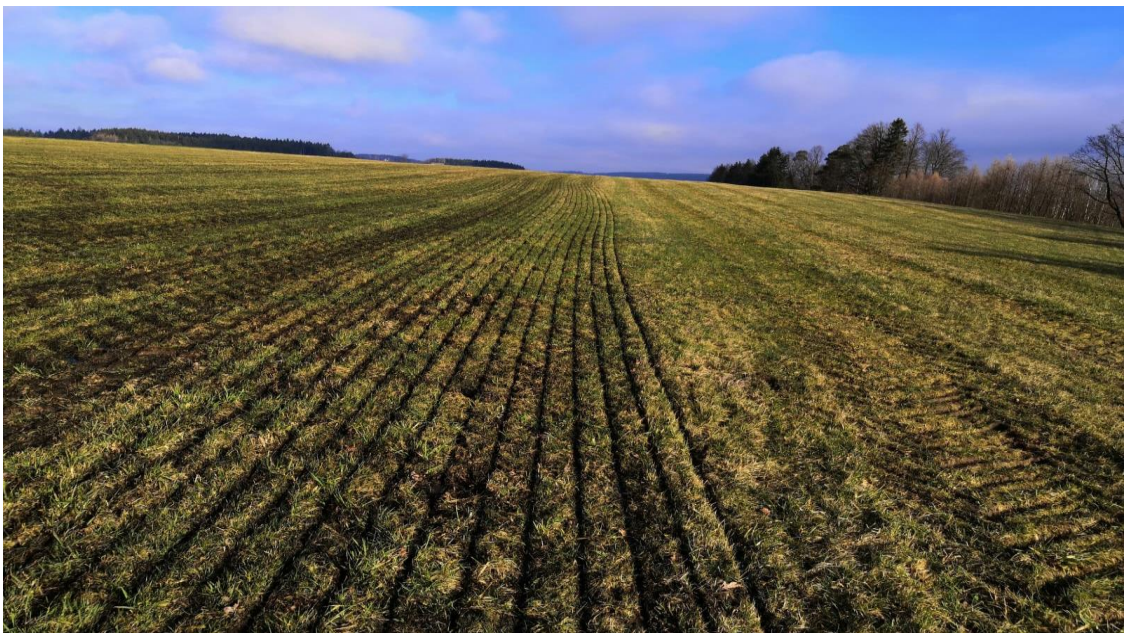
Obr. 4 Provedená aplikace na trvalý travní porost