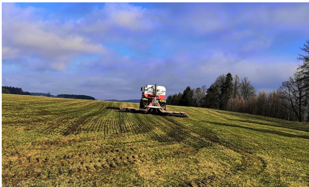
Obr. 2 Samohodný aplikátor (Foto V. Wanča)

Kromě cisteren s aplikátory vlečených traktory je možnost využít samohodný aplikátor vybavený cisternou. Výhodou tohoto stroje je přesná aplikace a díky širokým pneumatikám nízký tlak na půdu, což umožňuje brzké zapojení v jarním období (viz Obr. 2).