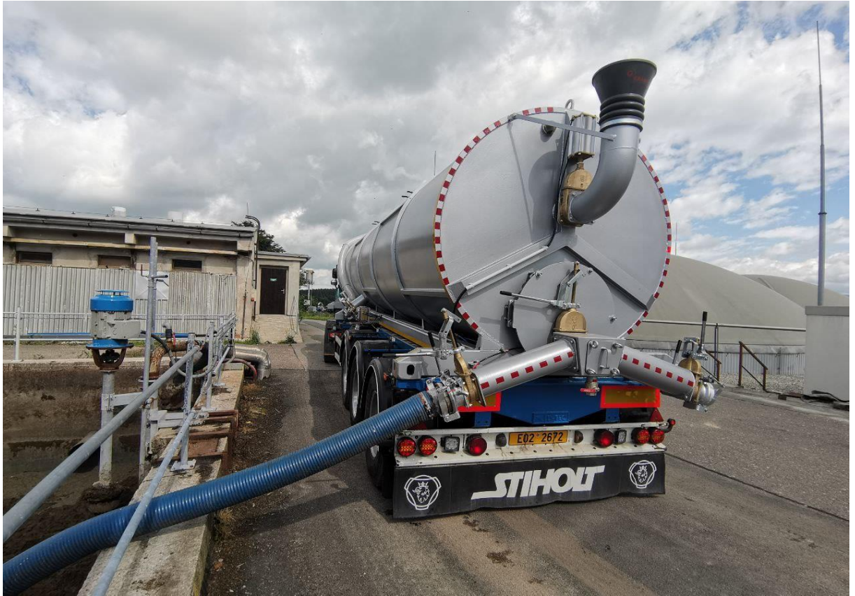
Obr. 7 Čerpání hnojiva do přepravní cisterny u bioplynové stanice