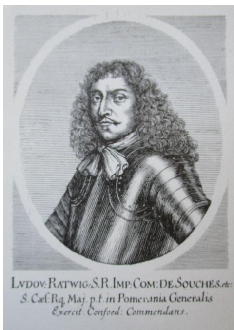
Obr. 2. Jean-Louis Raduit de Souches