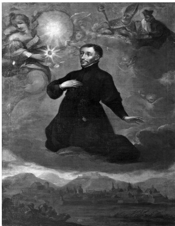
Obr. 6. Anonymní malíř 17. století, Martin Středa jako ochránce Brna, Brno, poslední třetina 17. století (?), olej, Moravská galerie v Brně