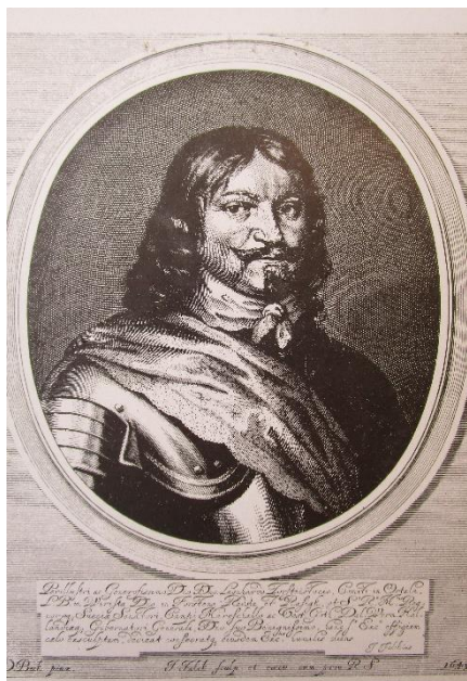
Obr. 4. Lennart Torsstenson

Samotné obléhání Brna začalo 3. května 1645, kdy k městu od Židlochovic dorazily přední hlídky nepřítelů. Lennart Torstensson [obr.4] 40 s celým vojskem přitáhl následujícího dne. Švédové se soustředili ve dvou velkých leženích. Jedno se nacházelo mezi městem a Královým Polem, kde zabrali kartuziánský klášter, druhé na Starém Brně okolo cisterciáckého kláštera a řeky Svratky. Obě předměstí jako vzdálenější od hradeb de Souches ušetřil spálení. V Králově poli umístil Torstensson svůj hlavní stan a jízdu dislokoval do zábrdovického kláštera. 41