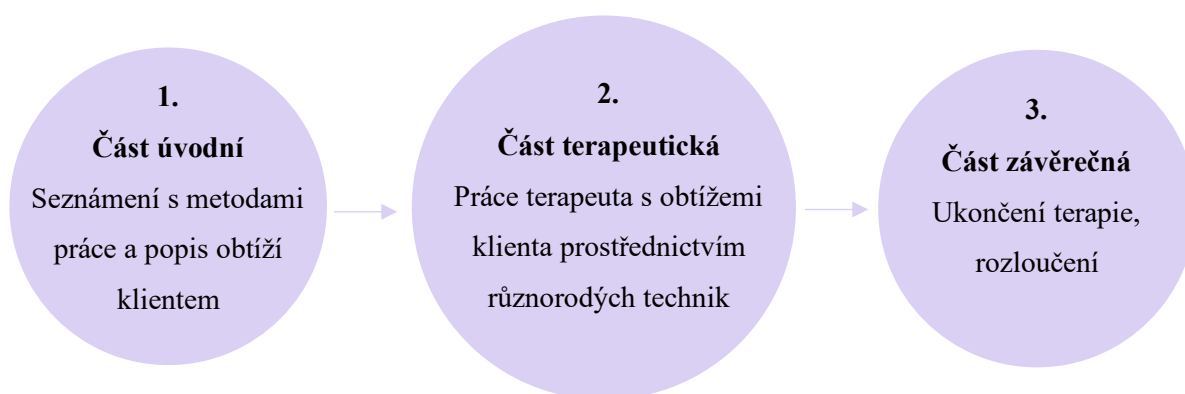
Schéma 1: Průběh nekvalifikovaných terapií

První označujeme jako část úvodní . V této prvotní fázi proběhlo seznámení s průběhem sezení. Terapeut klienty seznámil s tím, jak bude sezení vypadat, případně proběhlo také seznámení s některými technikami, které budou v průběhu sezení probíhat: „Začalo to krátkým vysvětlením, jak pracuje, ujištěním, že se nemusím bát. Takové ujištění na začátku. A pak už se šlo normálně pracovat.“ (R6) Následně klient popsal, s jakým problémem, případně problémy za terapeutem přichází.