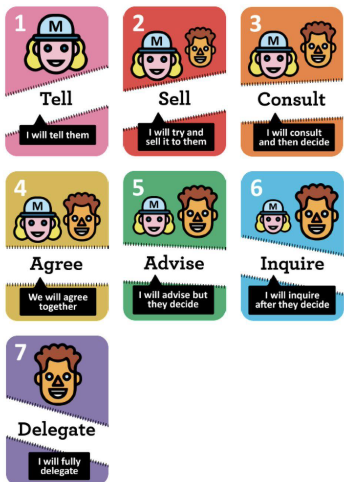
Obrázek 4. Postup delegování podle manuálu pro delegování

Třetím krokem je konzultace s podřízeným a na to navazuje odsouhlasení delegovaného úkolu ze strany podřízeného. Na to již navazuje ukázka úkolu a samotné delegování. Následně již veškerou práci odvádí podřízený.