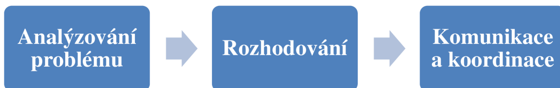
Obrázek 1. Paralelní manažerské funkce