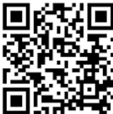
Obrázek 7 Nadhození předního kola s příšlapem

Poslední dovedností před skoky a výskoky je nadhazování zadního kola. Zásadním prvkem pro tuto dovednost je vytvoření tlaku na pedály a změna polohy přední a zadní nohy na pedálech. Ve výchozí pozici má dítě paty vodorovně, v ideálním případě směřují mírně k zemi. Provedení správného přenesení těžiště je podmíněno přetočením přední a zadní nohy na pedálech. Této změny se docílí aktivním zapojením svalů a pohybem v kotníku. Z výchozí pozice, rovnoměrně rozložená váha na pedálech, natažené dolní i horní končetiny, pata mírně k zemi. Pohybem v kotníku se změní pozice nohy na pedálu. Špička směřuje k zemi a pata vzhůru. Díky tomu se zapřou nohy do pedálů a jezdec snáz nadzvedne zadní kolo. A to jak s pomocí, tak bez pomoci přední brzdy. Přetočení nohou v kotnících zabrání vyklouznutí nohou z pedálu a pozice se stane komfortnější, ovladatelnější a stabilnější. Důležitou roli hraje načasování. Přetočení špiček k zemi se provádí ihned po vytvoření tlaku a je zahajovacím povel pro přenesení těžiště lehce nad řídítka. Lokty jsou po celou dobu pohybu natažené, zápěstí směřuje v prodloužení předloktí. Oporou horních končetin o řídítka nedojde ke ztrátě získané energie. Ta je následně využita k nadhození zadního kola. Nejčastější chybou při této dovednosti je pokrčení rukou. Tím dojde k destabilizaci pozice a narušení rovnováhy. Pohyb jezdce pak může pokračovat vpřed a způsobit pád přes řídítka nebo do strany.