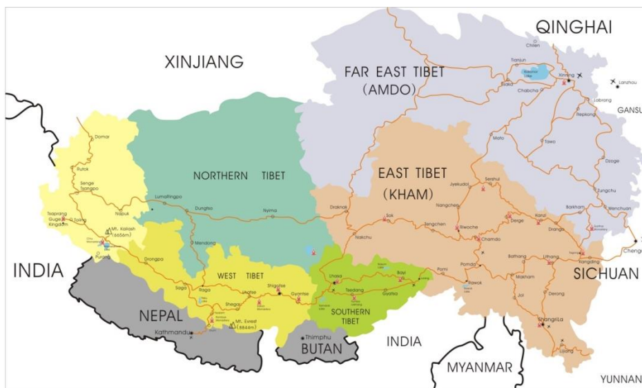
Obrázek 2: Mapa Tibetu, zdroj: http://www.exploretibet.com/maps/