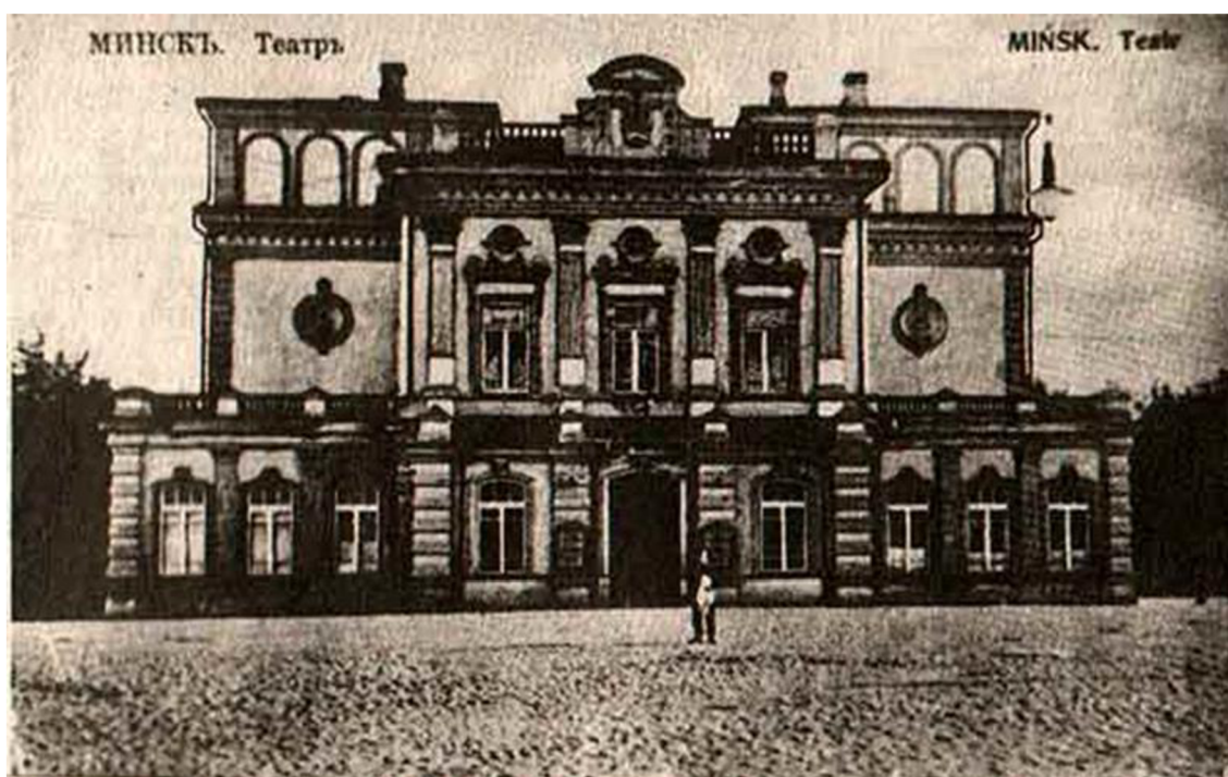
Budova Minského městského divadla, konec 19. století.

hudby Michaila Hlinky, Alexandra Puškina, Nikolaje Gogola, Alexandra Ostrovského. Převážně ruské osobnosti byly na stěnách divadla zobrazeny pravděpodobně z toho důvodu, že Bělorusko zatím neexistovalo ani jako samostatná země, ani jako republika v sestavě svazu. Minská gubernie byla součástí Ruského impéria. I když samozřejmě existovali běloruští klasici (kteří psali nejen v běloruštině, považované v té době pouze za dialekt ruského jazyka, ale i v ruštině), stále nebyli tak významnými kulturními symboly jako ruští literární, výtvarní a hudební umělci. Portál scény byl ozdoben štukovým erbem Minské gubernie. 3