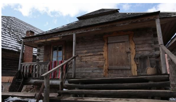
Scéna z Paŭlinky (2021) a místo, ve kterém se inscenace odehrála. Foto: archiv Kupałaŭců.

Obnovená Paŭlinka byla z objektivních důvodů koncipována především jako film, jehož záznam se měl objevit na oficiálním a nově založeném Youtube kanálu nezávislých Kupałaŭců. 95 Inscenace se zkoušela a nahrávala v autentickém dobovém běloruském statku. Důležitý je zde princip práce umělců, který spočívá v reakci divadelního souboru na události v Bělorusku a jejich založení vlastního nezávislého uskupení, jež začalo ještě na teritoriu státu samostatně tvořit. Tato partyzánská taktika „boje v týlu nepřítele“ je nejenom zkouškou funkčnosti v podmínkách totalitního režimu a věrnosti vlastním principům a vytrvalosti, ale také vhodným mírným instrumentem umění pro povzbuzování národa a jeho inspiraci na pokračování boje za práva, nezávislost a vlastní národní kulturu.