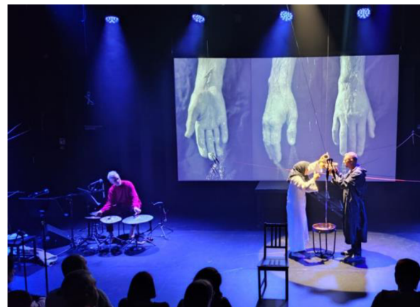
Scény z premiéry inscenace Šept v červnu 2023.