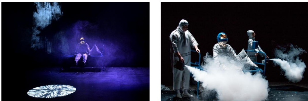
Scény z inscenace Radziva Prudok (2021, režie Raman Padaliaka).

obraz kosmu. Na první pohled se v inscenaci nic nezměnilo, vizuální obraz zůstal takový, jaký režisér spolu s členy souboru Kupałaŭského divadla v Minsku vytvořil ještě v roce 2018. 98