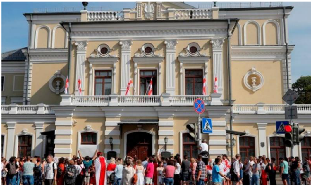
Národní akademické divadlo Janky Kupały v Minsku během protestů v srpnu 2020.

k přepočítání hlasů a ukončení násilí vůči civilistům. Umělecký soubor podpořil již bývalý ředitel divadla Pavel Latuška. Dne 17. srpna se nad divadlem objevily národní bílo-červeno-bílé vlajky. 79