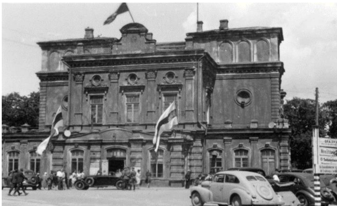
Národní akademické divadlo Janky Kupaly během okupace Běloruska, červen 1943.

Herecké soubory šly na frontu, hrály v nemocnicích. Umělci připravili programy pro sibiřské vojáky, kteří byli posláni na frontu, pro těžce raněné, transportované do týlu, pro dělníky obranných závodů. Obnovovali se nejlepší inscenace z těch odehraných v Minsku. Navíc se herci museli znovu naučit role v ruštině, pomáhat s přípravou kulis, šít kostýmy, vyrábět rekvizity. Běloruští partyzáni byli do Tomsku přivezeni z hlubin Palessie k ošetření. Jejich živé příběhy o válce a utrpení lidí, o vojenských záležitostech v Bělorusku soubor zasáhlo. Sbíralo se teplé oblečení pro partyzány, ve dnech volna se pořádala představení, sbíraly se peníze na letadlo Běloruského státního divadla. 25