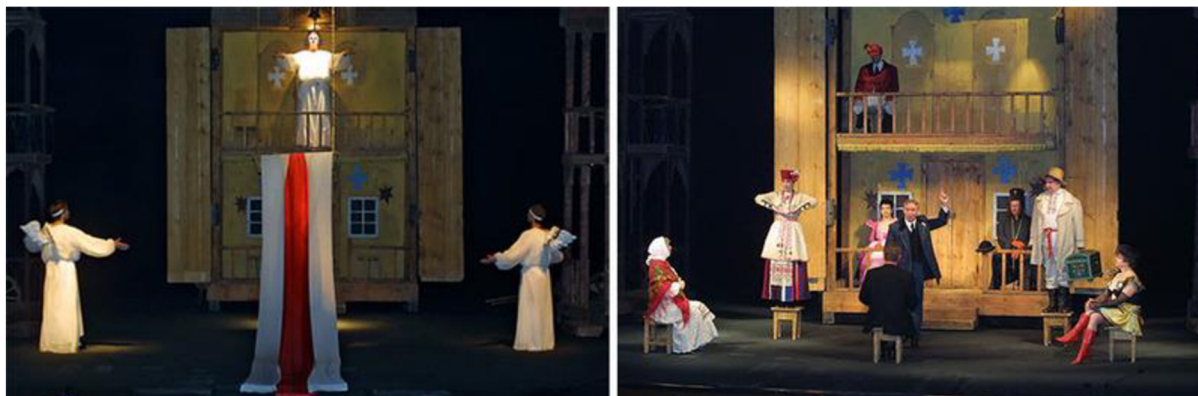
Scény z představení Tutejšyja , 1990.

a politického pluralismu ze strany úřadů. V duchovní sféře se objevila svoboda názorů, přesvědčení a svoboda slova. 66