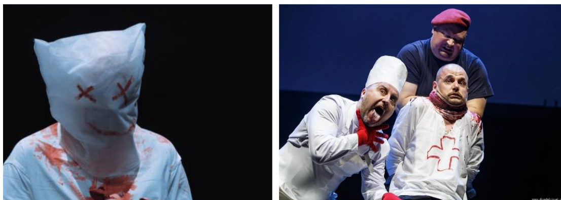
Scény z představení Woyzeck (2020, režie Raman Padaliaka).

„Režie Ramana Padaliaky se z Woyzecka nesnažila vytěžit zásadně nové interpretace, kterými se inscenační tradice jen hemží, ale spíš z něj pečlivě vybrala některé pasáže a režijně je zdůraznila. Vznikla tak padesátiminutová zpráva o formách násilí a jeho následcích – počínaje násilím jedince na jedinci, konče násilím páchaném celým systémem. Woyzeck je obětí systému, kde si mocní a bohatí mohou dělat, co chtějí, ale na které se v rámci pomsty jen těžko dosáhne – a tak je pomsta vykonána na těch nejbližších.“ 101