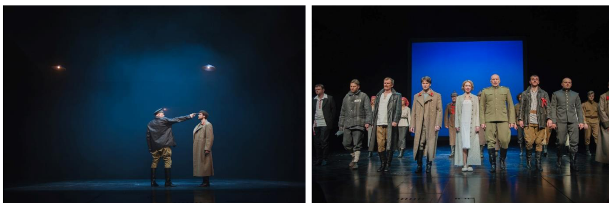
Scény z inscenace Dvě Duše (2016, režie M. Pinihin).

„Je to muž, který je na jakékoliv straně: není ani bolševik, ani příznivce carské strany (i když je v císařské armádě), ale každý se ho snaží přetáhnout na svou stranu. Pro mě je tato osoba kontemplativní. On není lhovce. Jen v obtížné době změn jde o krok zpátky a chce se podívat na situaci zvnějšku. Všichni se ho snaží někam vtáhnout, ale on začíná mluvit o tom, že si už koupil bělorusko-moskevský slovník a začal se z něj něco učit. Každý má možnost se samostatně rozhodnout.“ 55