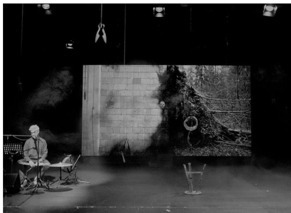
Scény z premiéry performativní čtené Šept v listopadu 2022. Foto: Facebook Kupalaŭců.