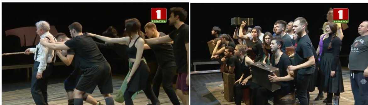
Scény ze zkoušek inscenace En souvenir de Chagall .

představení En souvenir de Chagall o osudu a lásce významného světoznámého běloruského malíře Marca Chagalla – inscenace beze slov, ve které měl být celý příběh vyprávěn jenom řečí těla bez verbálních prostředků, což pro soubor Kupaťašského divadla bylo experimentem a velkou výzvou. V poslední době se plastická představení stala módou – hodnota stylu plastické dramatiky spočívá v tom, že překládá dramatická díla do jazyka srozumitelného v jakékoli zemi světa. 58