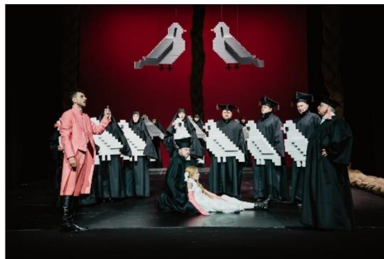
Scény z inscenace Ramantyčnaść.