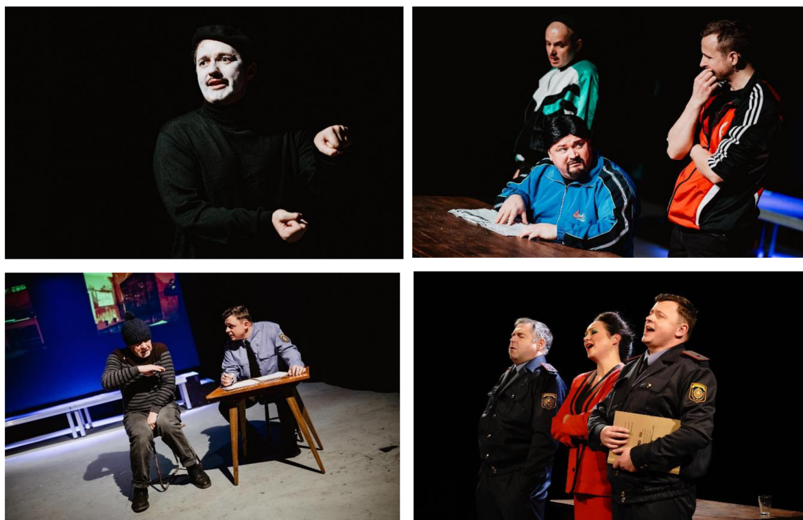
Scény z inscenace Sfagnum .

běloruského státu a systému společnosti. Je to satirická metafora moderního Běloruska, které do teď stává „sfagnem“ – bažinatou rostlinou, shnilým mechem. 129 Projekt vznikl s finanční podporou Stabilizačního fondu – iniciativy na podporu kulturních a vzdělávacích organizací na Ukrajině, ve východní a jihovýchodní Evropě a střední Asii, které utrpěly následky války na Ukrajině. Speciální poděkování od Nezávislé divadelní skupiny Kupałaŭcy dostalo také několik dalších organizací v Polsku, mezi kterými jsou Instytut Teatralny im. Zbigniewa Raszewského, Fundacja Tutaka, Teatr Dramatyczny m. st. Warszawy a Muzeum Wolnej Białorusi w Warszawie. Zkoušky inscenace nejdříve probíhaly v domácích podmínkách, dva týdny před premiérou našli členové skupiny divadelní prostor pro zkoušky a premiéru. Tímto prostorem se stala malá scéna Przodownik v okrese Mokotów, spadající pod Teatr Dramatyczny im. Gustawa Holoubka ve Varšavě. 130