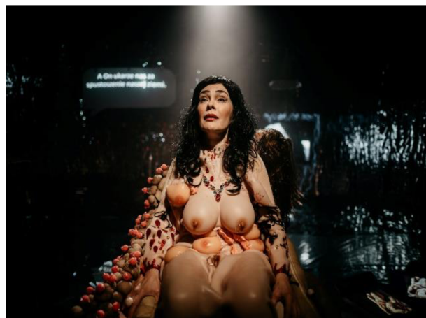
Scény z inscenace Komedie Judyty (2023, rež. Pavel Passini.)

V daném případě je soubor provokativní nejen tématem inscenace, ale také po výtvarné stránce. Kostýmy, scéna a obrazy inscenace jsou velmi daleko od bývalé tvorby na půdě Národního akademického divadla Janky Kupały. Výpověď jednoho z Kupałaŭců to potvrzuje – podle jeho dojmu se tato inscenace nepodobá ničemu z toho, co umělecký kolektiv dosud vytvořil. 172 Zdá se, že Komedia Judyty je pro Nezávislou divadelní skupinu Kupałaŭcy svérázným dramaturgickým bodem obratu, který posouvá soubor do experimentálnější roviny a otevírá cestu progresivnímu myšlení, které není závislé na předešlých uměleckých normách.