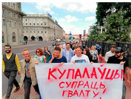
Členové souboru Národního akademického divadla Janky Kupały na minských protestech. Nápis na plakátech: Kupaľaucy proti násilí.

Hromadný odchod většiny zaměstnanců Národního akademického divadla Janky Kupały se nestal pro soubor koncem jejich umělecké kariéry, nýbrž krokem k založení nové formy tvůrčí činnosti – a to Nezávislé divadelní skupiny Kupaľaucy. Její způsob fungování se právě díky faktoru nezávislosti měl výrazně lišit od státního divadla nejenom tím, že se již nepodřizovala vládě a státnímu rozpočtu a otevírala nové, nikým necenzurované možnosti pro tvorbu, ale také tím, že status skupiny a její budoucnost se nemohly naplánovat dopředu. Podmínky existence Kupaľauců a odpovědi na otázky, jaké budou nové zdroje financování, kdo bude poskytovat prostory pro realizaci nových projektů skupiny a kde bude pokračovat činnost souboru zůstávaly v nejistotě. Tyto nezvyklé podmínky existence pro bývalé zaměstnance státního Národního akademického divadla Janky Kupały jsou právě důvodem, proč jejich nezávislou činnost zkoumat – jelikož soubor nebyl na události takového rázu připraven, a proto považují za podstatné se zabývat analýzou způsobu, jímž Nezávislá