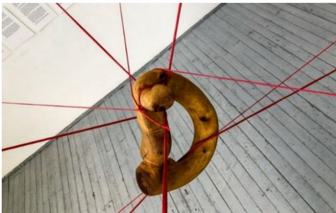
Element výstavy podle knihy Šept v minském Centru současných umění.

forma, kterou Padaliaka volí pro inscenování, vyvolává otázky ohledně dramaturgie inscenace samotné. Jde především o podobu inscenace, kterou lze spíše pojmenovat jako performativní čtení. Od prvního uvedení projektu v Německu v roce 2022 režisér totiž nezměnil v podstatě nic – scény zůstaly statickými a převážně monologickými, délka představení se z 30 minut prodloužila jen na 45. Projekt působí nedokončeně mimo jiné kvůli nevyužitému potenciálu scénografie, udělané podle vzoru výstavy pro knihu Šept v Minsku v srpnu 2022. Fotografie autora knihy sloužily jako závěrečná zadní jevištní projekce, ke které se přidalo několik videí a fotografií, natočených herci a režisérem speciálně pro inscenaci.