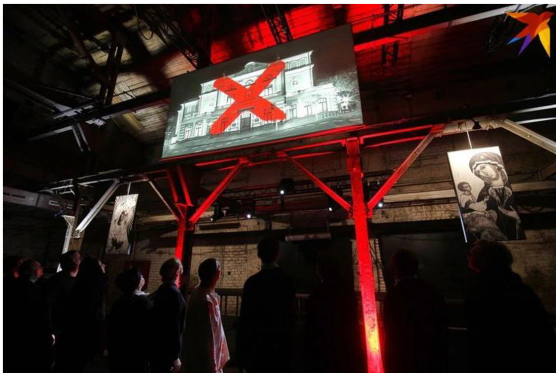
Přeškrtné státní Národní akademické divadlo Janky Kupały jako symbol ukončení velké epochy divadla. Scéna z představení Tutejšyja, 2020.