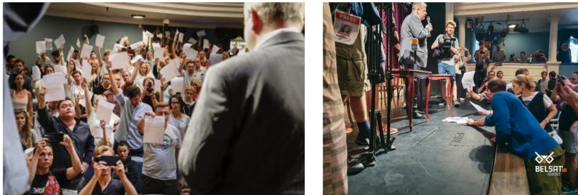
Zaměstnanci divadla Janky Kupały v Minsku předkládají běloruskému ministru kultury své výpovědi.

pokračovat a začali nad hlavy zvedat své výpovědi v písemné formě a následně je složili na jevišti před ministrem. 80