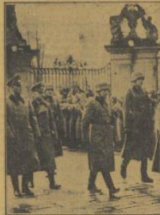
z Novin, Praha. Z pobytu Vádce a říšské říšské kancléř Adolf Hitler přehlíží čestnou