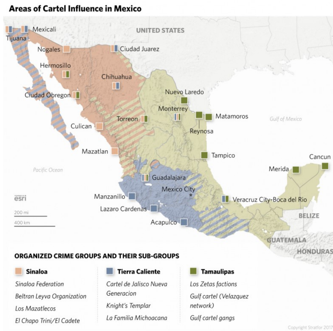
Obr. 1: Oblasti vlivu kartelů v Mexiku v roce 2017