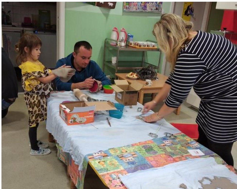
Obrázek 15 - Keramická dílna