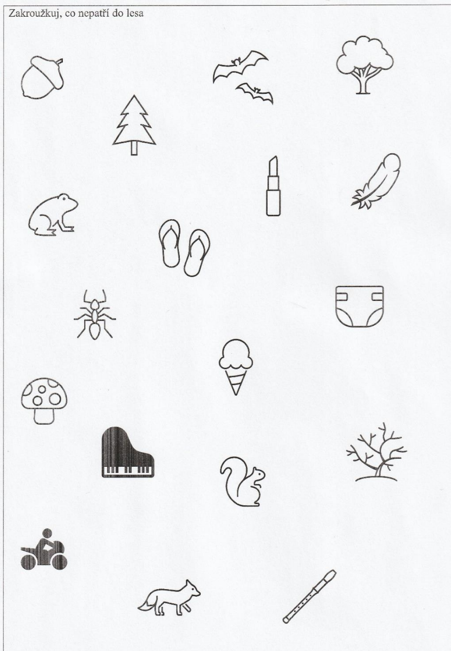
Příloha 5 - Pracovní list les