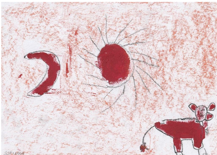
Obrázek 9 - Jeskynní malba dítěte