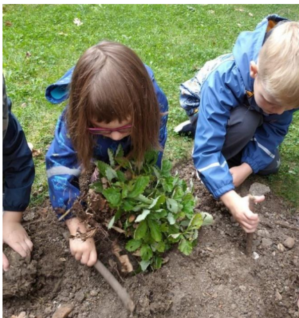
Obrázek 10 - Sazení lesních jahod