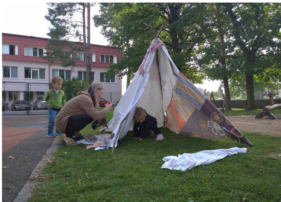
Obrázek 5 - Ukázka vyrobeného stanu

Komunikační kruh: „Nyní se rozhlédni a podívej se, co jsme dnes všechno dokázali, zamysli se a řekni mi, co tě při tomto pohledu napadne?“ pokud děti nevědí paní učitelka předvede: „Dívám se, dívám a napadá mě, že to byla zábava.“ pokud možno předvede i druhá paní učitelka: „Dívám se, dívám a napadá mě, že to byla těžká práce!“. Pokračují děti.