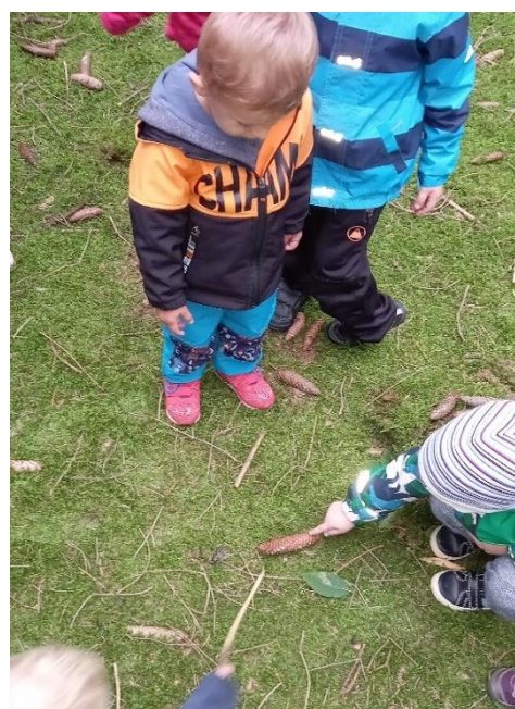
Obrázek 12 - Porovnávání velikostí