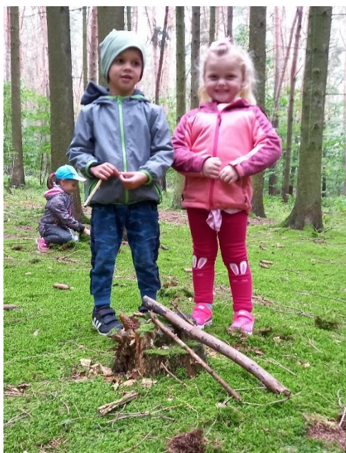
Obrázek 11 - Stavba domků pro skřítky