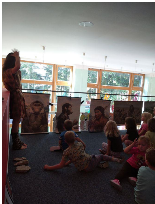
Obrázek 1 - Fotografie z výstavy