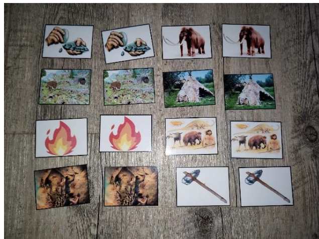
Obrázek 2 - Tematické pexeso