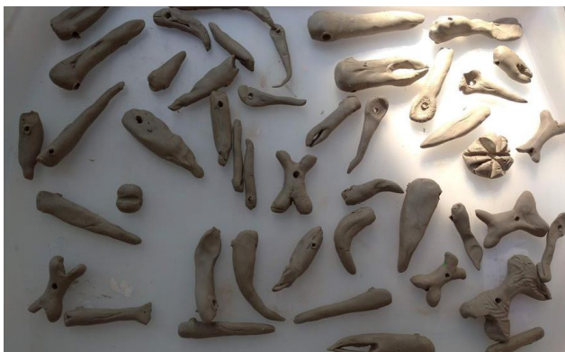
Obrázek 6 - Práce dětí zuby a kosti z keramiky