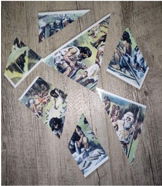
Obrázek 3 - Tematické puzzle