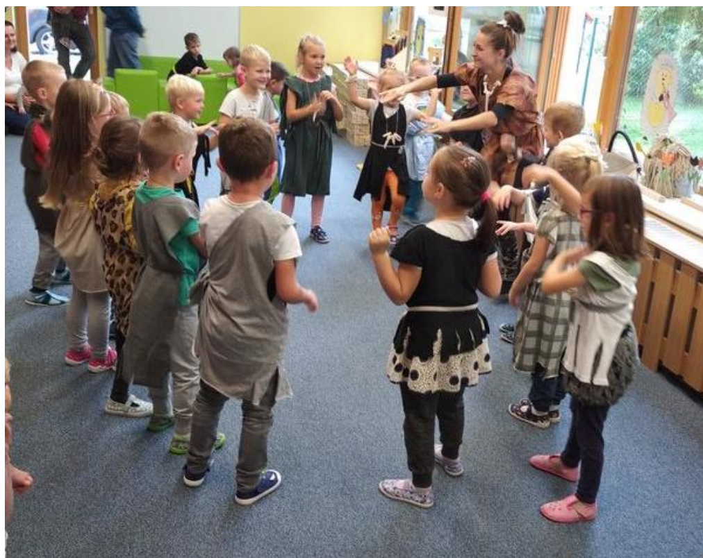
Obrázek 13 - Kostýmová přehlídka