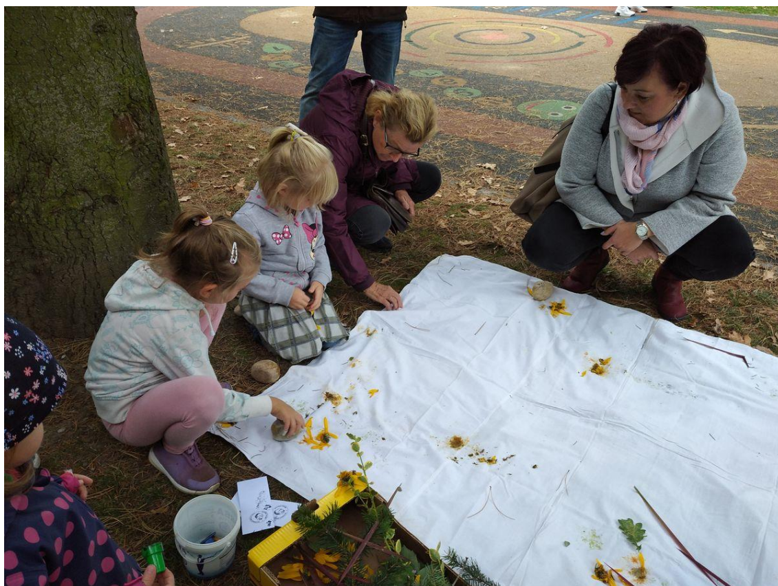
Obrázek 14 - Otisky z přírodnin na látku

Akce proběhla v pátek 17. září a účastnila se jí většina rodičů, ale i sourozenců našich dětí, a také celý kolektiv mateřské školy. Na přípravě a organizaci se děti samy podílely. Od prvního dne jsme poctivě nacvičovali vystoupení, v pondělí 13.9. děti začaly rozdávat pozvánky svým rodičům (pozdánky jsme rozeslali také emailem) a v pátek 17.9. jsme po odpočinku začali s přípravami. Děti nachystaly jednotlivá centra, oblékly se do kostýmů stejně jako paní učitelky a přivítaly své rodiče. Předškolní děti rozdaly průvodky a celou akci jsme zahájili úvodním vystoupením. Po vystoupení se děti připojily ke svým rodičům a sourozencům a provedly je jednotlivými centry. V centrech byly činnosti, které už samy jednou prožily, a tak měly jedinečný prostor naučit je i své rodiče. Od rodičů, ale i od dětí jsme dostali pozitivní zpětnou vazbu a rodiče ve školce zůstávali i po dokončení činností a povídali si s ostatními rodiči nebo s námi, čímž se navázali bližší vtahy.