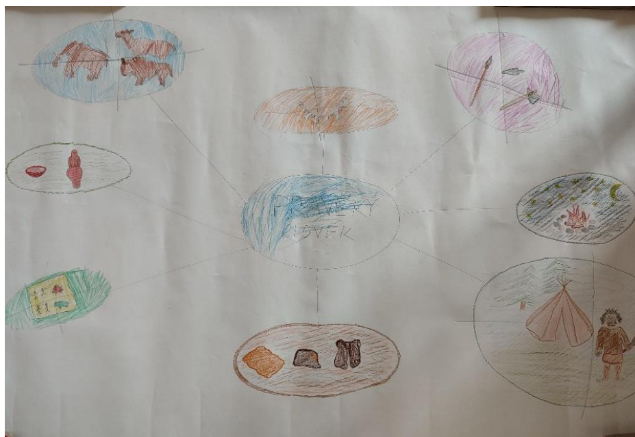
Obrázek 4 - Myšlenková mapa dětí