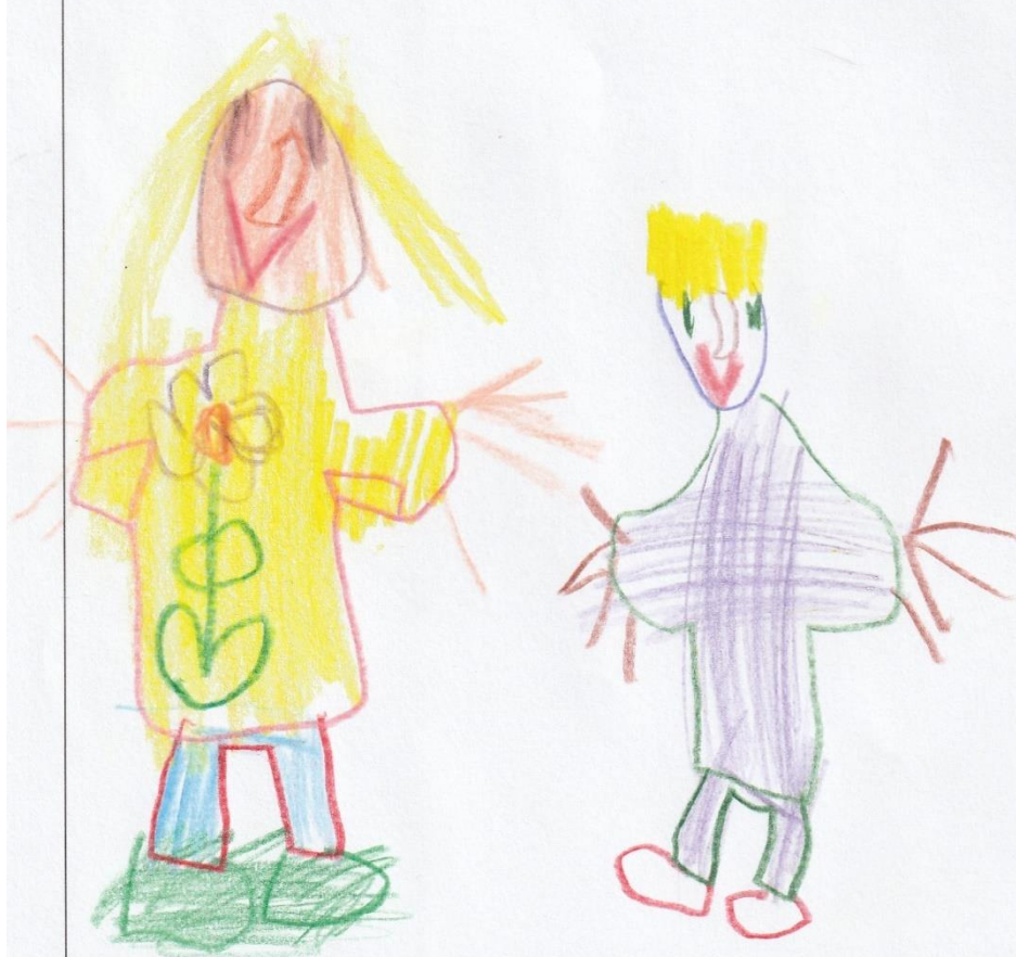
Příloha 7 - Pracovní list kamarádi

Nakresli všechny svoje kamarády, které máš ve školce