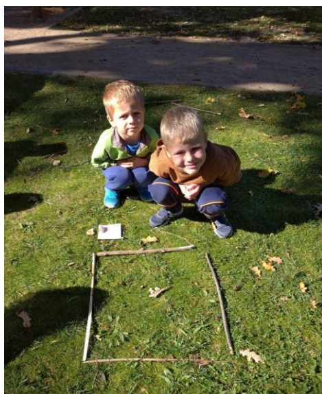
Obrázek 7 - Skládání větví