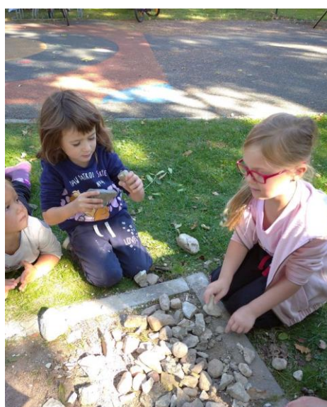
Obrázek 8 - Opracování kamene