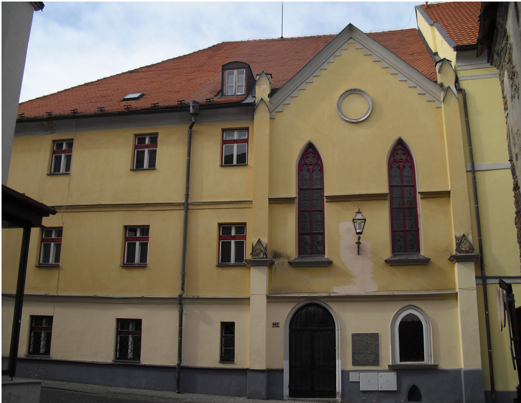
Rodný dům Jana Nepomuka Neumanna