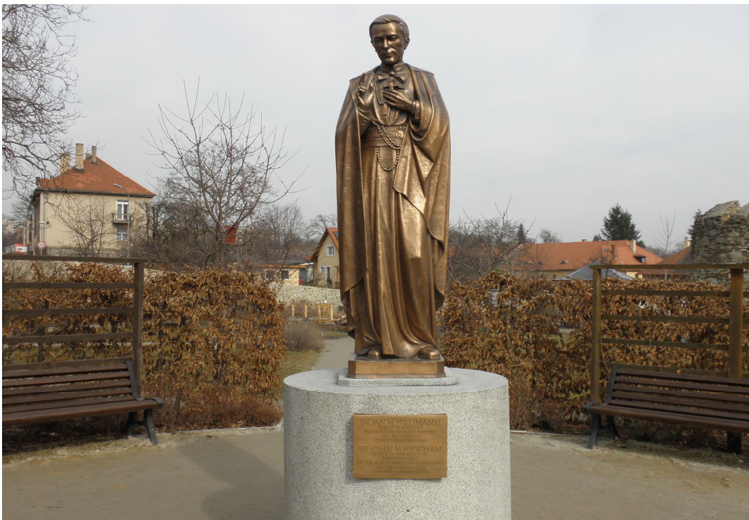
Socha sv. Jana Nepomuka Neumanna v areálu hospice