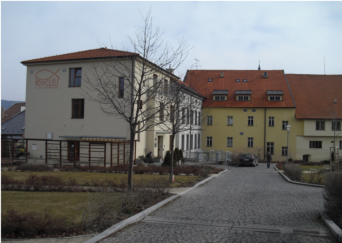
Hospic sv. Jana N. Neumanna (zadní část rodného domu s novou přístavbou)