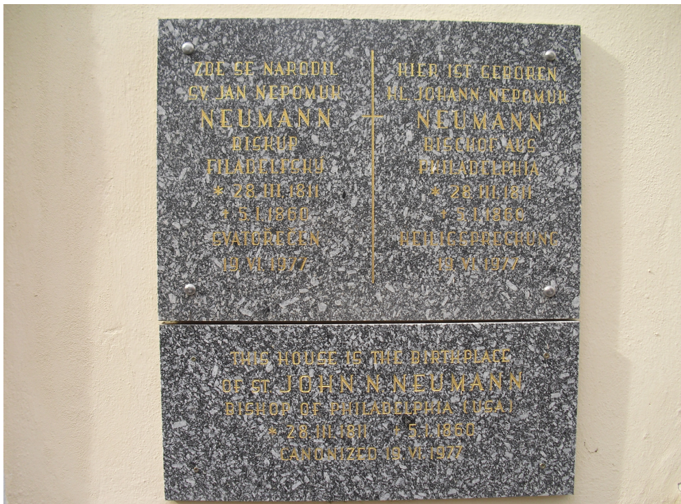
Pamětní deska Jana Nepomuka Neumanna na jeho rodném domě