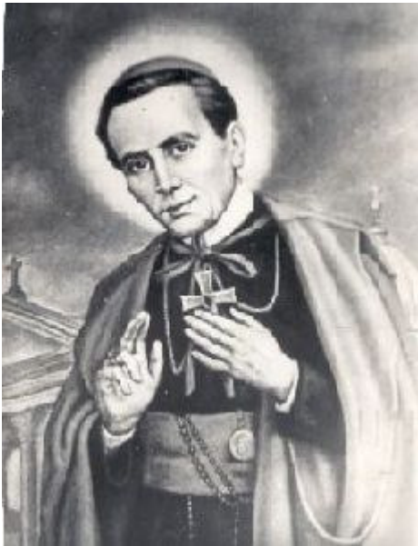
Svatý Jan Nepomuk Neumann