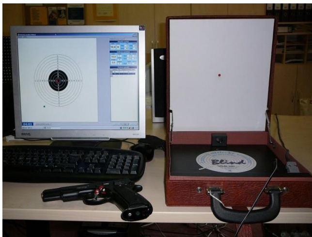
Obrázek 13: střelecký trenažer