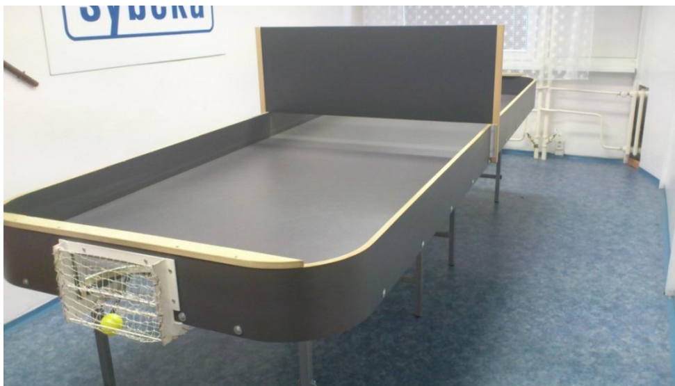
Obrázek 11: showdownový stůl