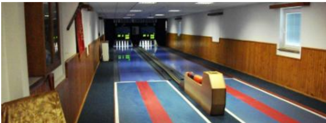
Obrázek 12: kuželková dráha