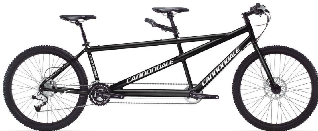
Obrázek 7: tandemové kolo