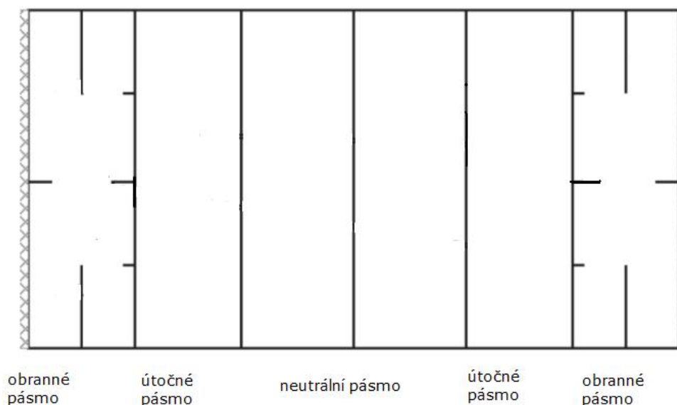
Obrázek 8: goalballové hřiště