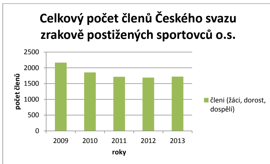
Graf 1: Vývoj členské základny ČSZPS v ČR od roku 2009 – 2013