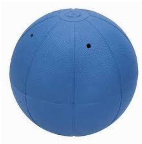
Obrázek 9: goalballový míč