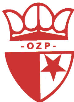
Obrázek 16: znak SK Slavia Praha OZP

Zdroj: SK SLAVIA PRAHA OZP. Logo . [online]. [cit. 2015-02-16] dostupné z: http://www.skslavia-ozp.cz/