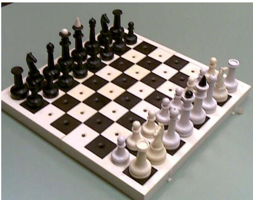
Obrázek 14: šachovnice pro zrakově postižené