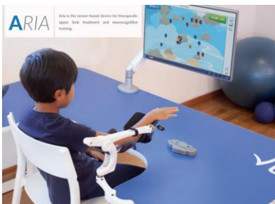
Obrázek 4 Nerobotická technologie Gloreha Aria (Gloreha, 2023)

Dále se do skupiny nerobotické rehabilitace řadí koncept Armeo Spring (Navrátil et al., 2022, s. 138).