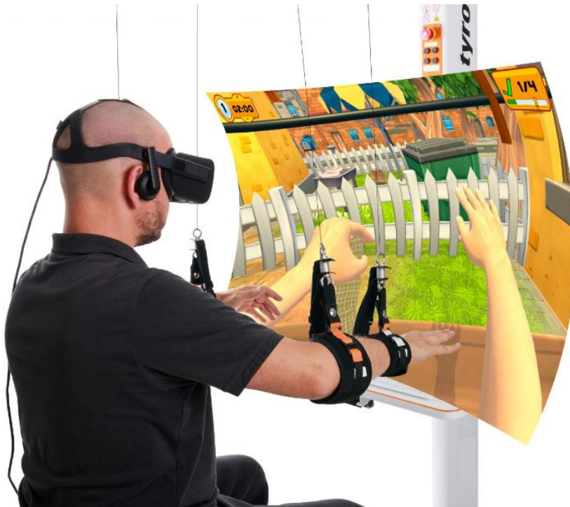
Obrázek 6 Robotický systém Diego (Tyromotion, 2024)

Jedna nebo obě horní končetiny jsou spojeny se zápěstními nebo loketními popruhy s lany, která jsou ovládána čtyřmi motory vybavených senzory. Pomocí distální podpory zápěstí a lokte se zvyšuje proximální stabilita trupu a ramen, což pomáhá snižovat kompenzační mechanismy. Dosahové aktivity pak lze trénovat jako celek (zvedání, dosah, přenášení), nebo je možné zacílit na konkrétní kloubní pohyb na úrovni postižení. Výhodou je také to, že terapeut má možnost věnovat se dalším aktivitám, jako je například facilitace lopatky a ovládání trupu během tréninku (Jakob et al., 2018).