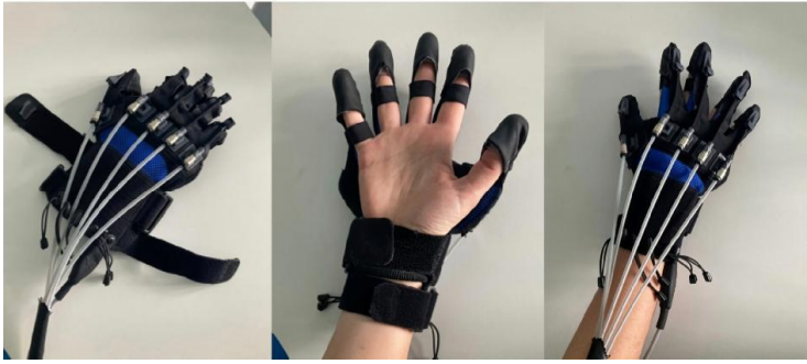
Obrázek 3 Robotická rukavice Gloreha Sinfonia (Bressi et al., 2023).