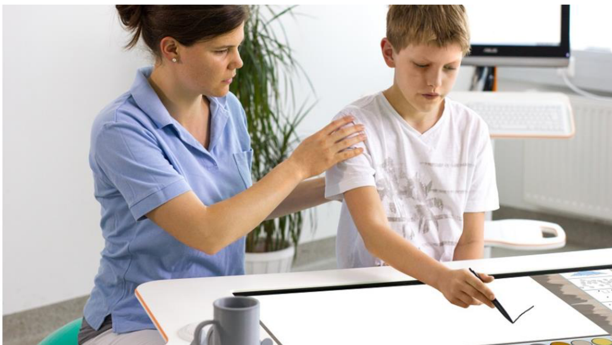
Obrázek 7 Terapeutická plocha Myro (Tyromotion, 2024)

Systém Myro je vysoce přizpůsobivý, poskytuje pracovní prostor i pro více osob zároveň a lze jej využít v kombinaci s robotickým systémem Diego. Zajišťuje úkolově orientovanou rehabilitaci se senzory na povrchu a reálnými objekty a zlepšuje motoriku, aktivní rozsah pohybu a je základem pro kreativní terapii. Využívá se u pacientů neurologických a ortopedických, od dětských až po geriatrické. Systém se používá pro terapii u pacientů zejména s deficitem motorických funkcí, koncentrace, selektivní pozornosti, zrakové a prostorové percepce a prostorově percepční schopnosti (Tyromotion, 2024).