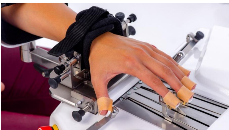
Obrázek 5 Robotický přístroj Amadeo (Tyromotion, 2024)

V praxi se Amadeo využívá pro zhodnocení rozsahu pohybu, zhodnocení svalové síly, léčby a spasticity, pro pohybovou terapii, trénink citlivosti nebo povrchovou EMG. Podporuje řešení spasticity, umožňuje trénink na bázi EMG, díky čemuž je možná aktivní terapie i bez svalové síly. Cílem je obnovit motorické schopnosti, reedukaci pohybových vzorů a zlepšení koordinace. Zařízení se dá využít při rehabilitaci u dětí i dospělých ve všech fázích rehabilitace. Podporuje léčbu spasticity i testování hmatové citlivosti, nabízí možné pasivní, asistované i aktivní režimy terapie. Dále je možné nastavit výšku stolu, polohu ruční jednotky v pronaci a supinaci, nebo rozložení pohybu jednotlivých prstů (viz obrázek 5) (Tyromotion, 2024).