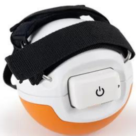
Obrázek 9 Pablo Multi-ball (Ectron, 2023)