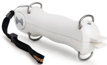
Obrázek 8 Pablo Handsensor (Ectron, 2023)