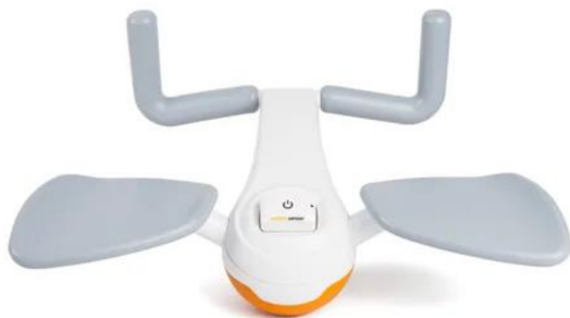
Obrázek 10 Pablo Multiboard (Ectron, 2023)