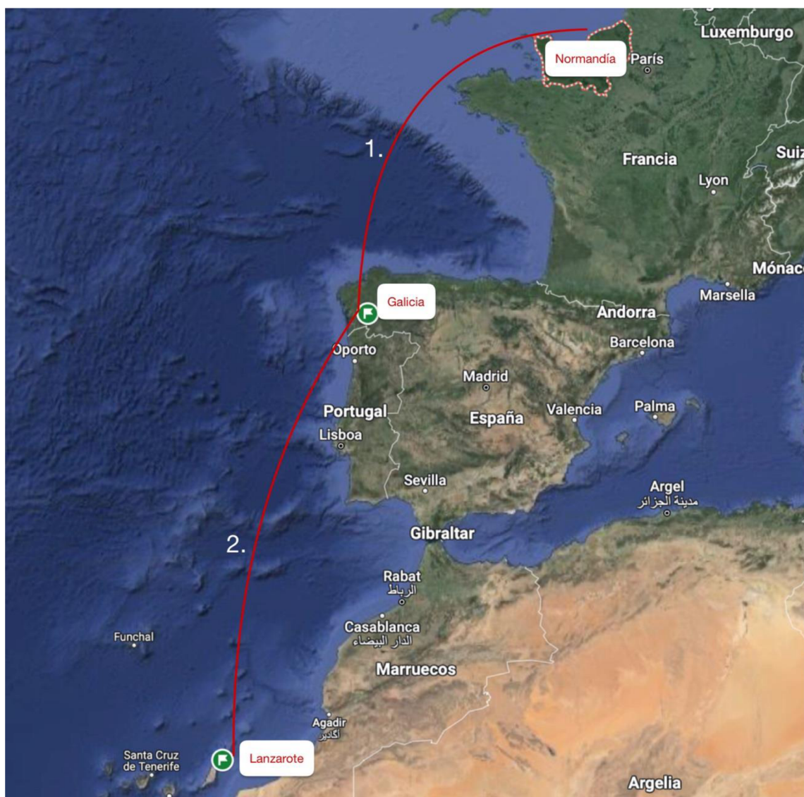
Ilustración 2: Mapa del proceso de la navegación a las Islas Canarias (elaboración propia)

Para realizar el análisis, he organizado los resultados en ocho categorías temáticas que son las siguientes: Estilo de vida, Paisaje, La lengua, La conquista, Armas, Vestido, Aspectos religiosos y fiestas y El modo de enterramiento.