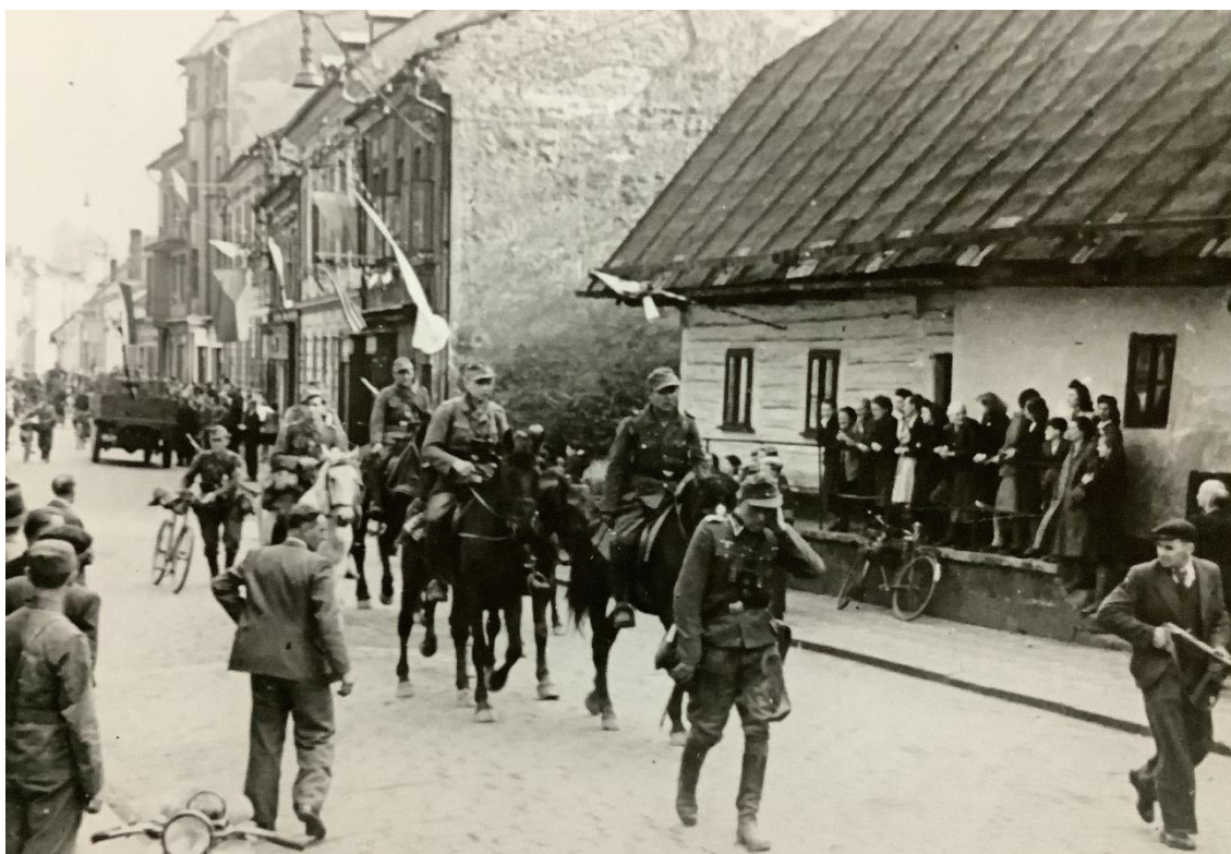
Příloha č. 10 – Němečtí vojáci dne 9. 5. 1945 směřují do zajetí k jednotkám Rudé armády.