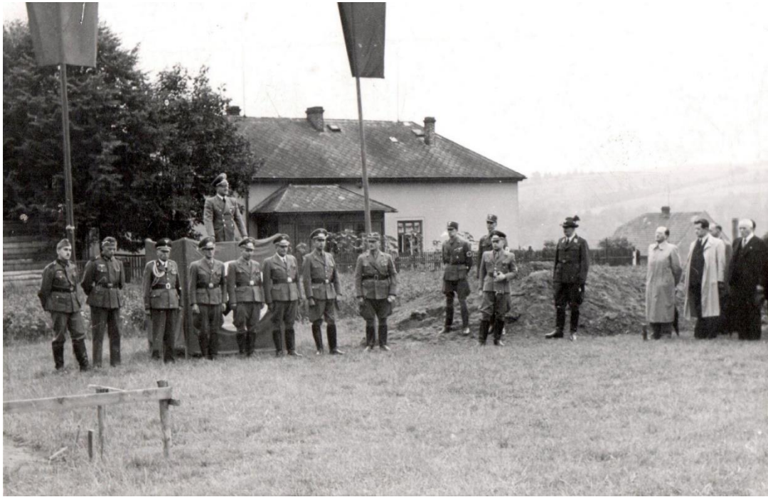
Příloha č. 3 – Konrad Henlein mluví k lidem při slavnostním proslovu při stavbě domků pro německé občany Na Lánech v roce 1942.