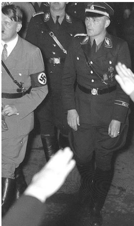
Příloha č. 5 – SS Gruppenführer Curt Wittje po boku Adolfa Hitlera. Ve třicátých letech velice vlivný nacist. Pro jeho homosexuální sklony byl Wittje odklizen do Úpice, kde se stal vlastníkem firmy Bratří Buxbaumů. ( https://forum.axishistory.com/ Curt Wittje)