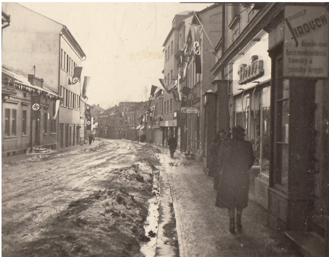
Příloha č. 1 – Ulice pod městem, podle nevydlážděné cesty se jedná pravděpodobně o rok 1939-1940.