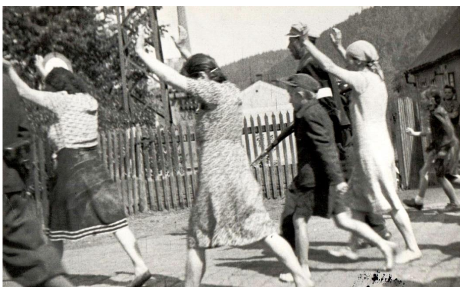
Příloha č. 12 – Skupina českých dobrovolníků revolučních gard zatýká kolaboranty.