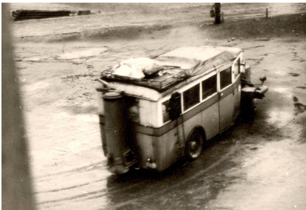
Příloha č. 9 – Vojáci Waffen SS utíkají před Rudou armádou v autobusu na dřevoplyn.