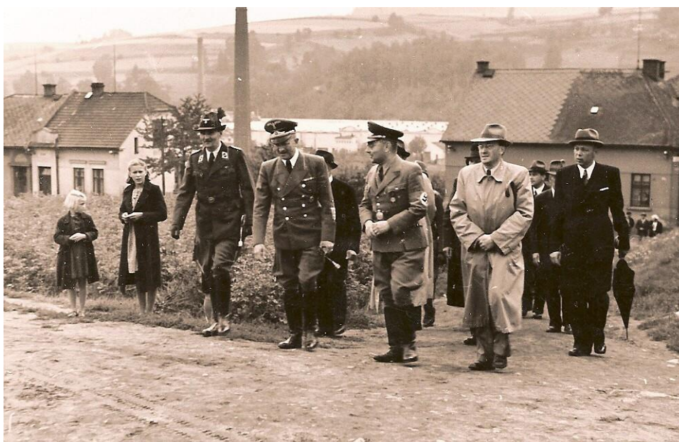
Příloha č. 2 – Konrad Henlein a Wilhelm Nisser u slavnostního proslovu při stavbě domků pro německé občany Na Lánech v roce 1942.