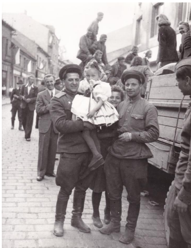
Příloha č. 11 – Vojáci Rudé armády radostně vítají místní obyvatele dne 9. 5. 1945.