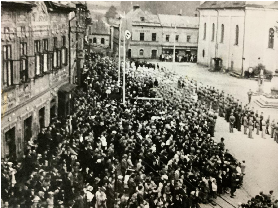
Příloha č. 9 – Veliké cvičení protiletcecké ochrany na náměstí konaného dne 4. 7. 1943.