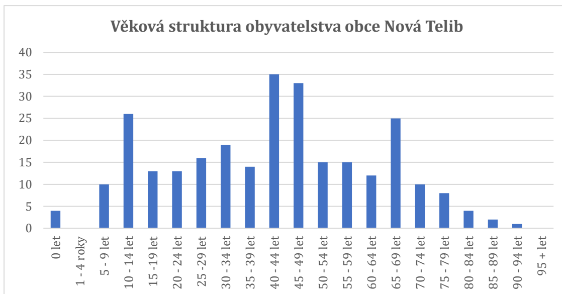
Graf č. 2: Věková struktura obyvatelstva obce Nová Telib (pětileté skupiny) k 31.12.2021.

Zdroj: Český statistický úřad (vlastní zpracování).