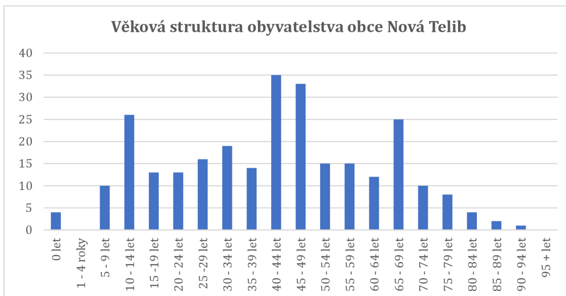
Graf č. 2: Věková struktura obyvatelstva obce Nová Telib (pětileté skupiny) k 31.12.2021.

Zdroj: Český statistický úřad (vlastní zpracování).