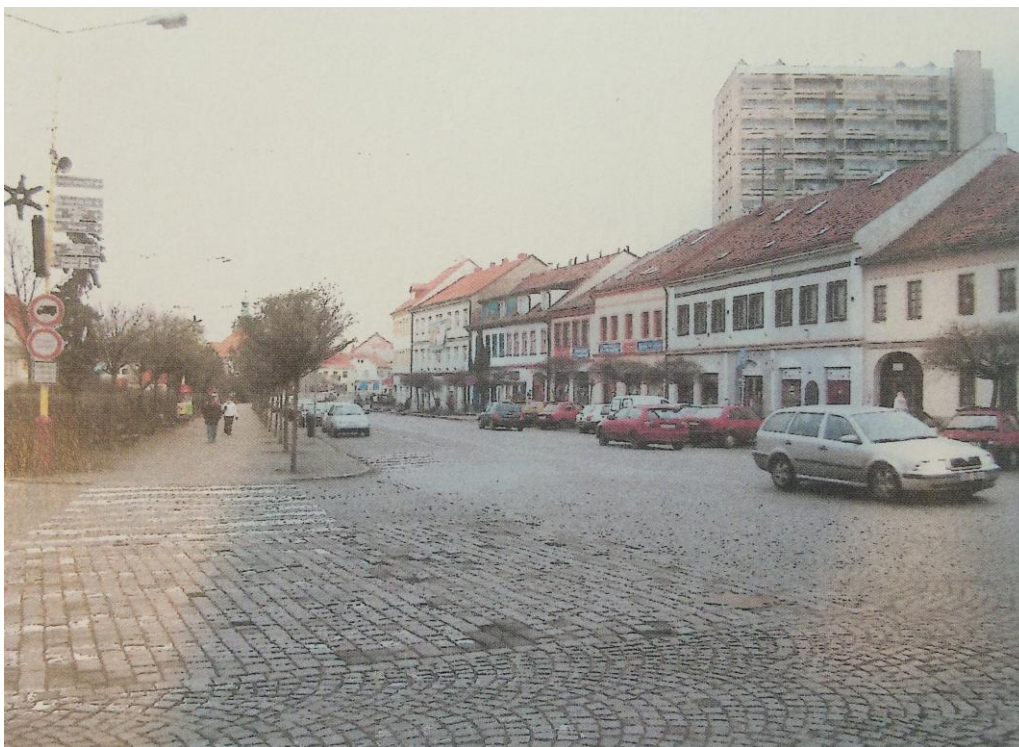
r. 2011: pohled od České spořitelny směrem k akátové alejce