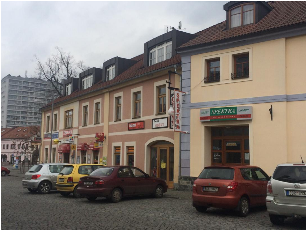
r. 2016: zeleň před domy č.p. 211 a 70 po revitalizaci