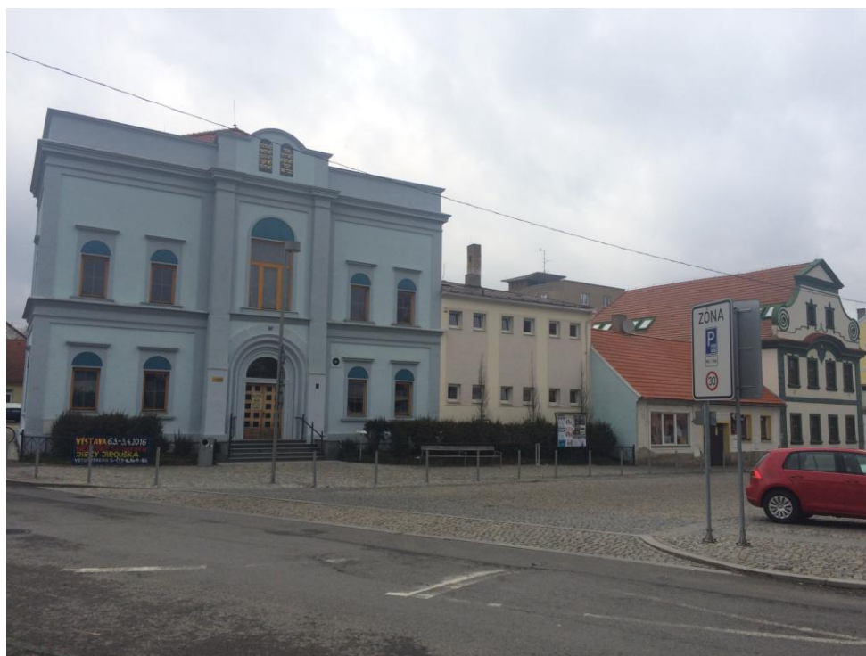
r. 2016: zeleň před kulturním domem po revitalizaci