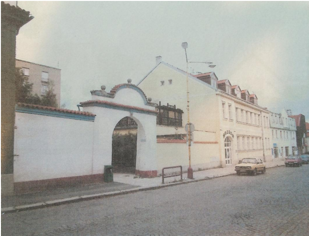
r. 2011: pohled směrem k muzeu