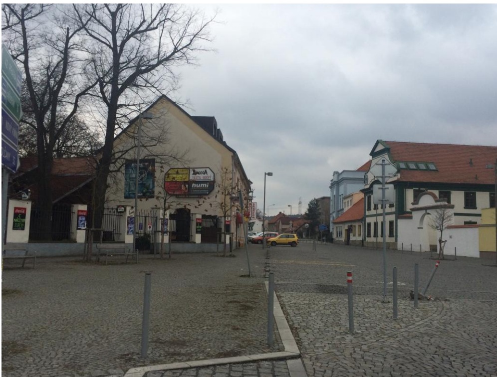
r. 2016: pohled k průchodu u Základní umělecké školy po revitalizaci