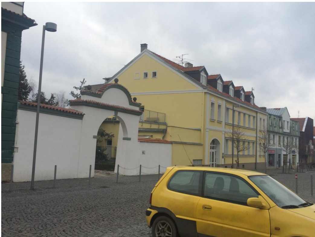
r. 2016: pohled směrem k muzeu po revitalizaci