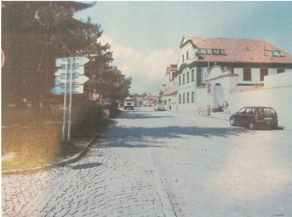
r. 2011: pohled k průchodu u Základní umělecké školy