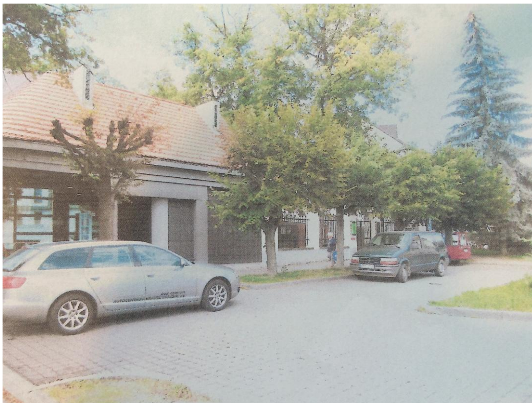
r. 2011: zeleň v prostoru před Českou spořitelnou