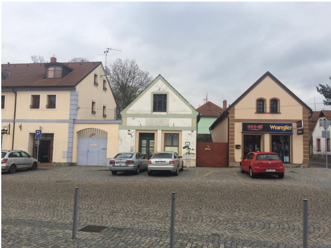
r. 2016: nároží křižovatky Rosovická po revitalizaci