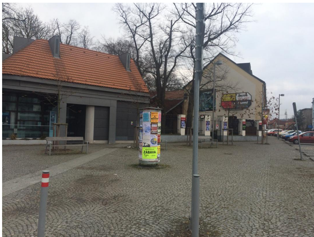
r. 2016: zeleň v prostoru před Českou spořitelnou po revitalizaci