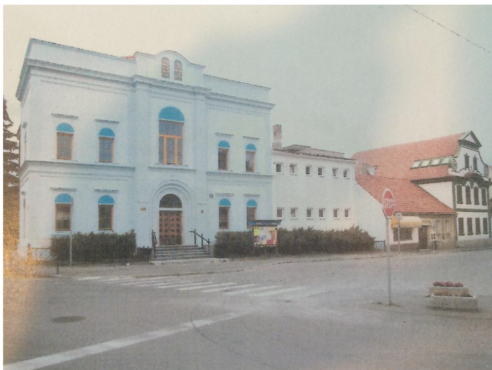
r. 2011: zeleň před kulturním domem (Zdroj: projektová dokumentace města)