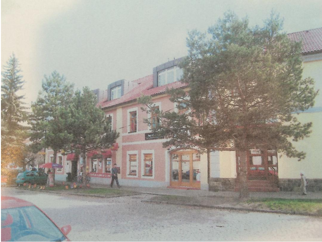
r. 2011: zeleň před domy č.p. 211 a 70