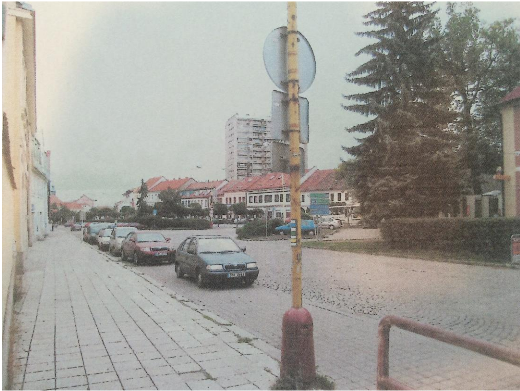
r. 2011: pohled od muzea