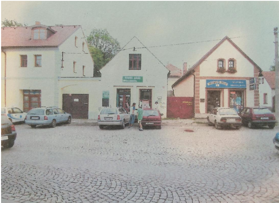
r. 2011: nároží křižovatky Rosovická