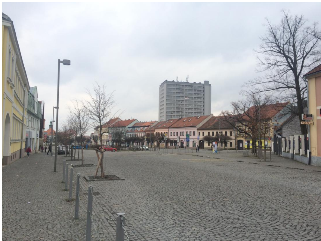
r. 2016: pohled od muzea po revitalizaci