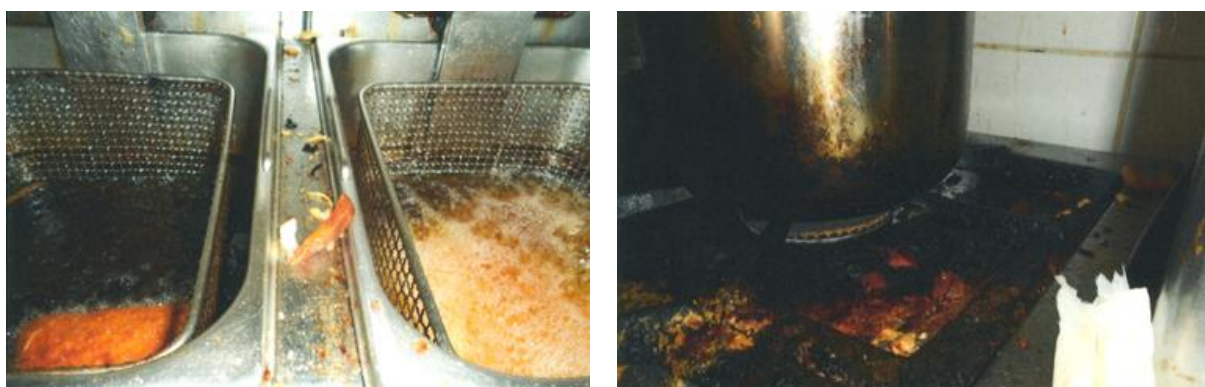
Obrázek č. 8 - Znečištěné technologické plochy provozovny společného stravování