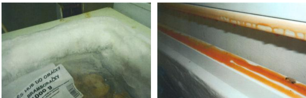
Obrázek č. 7 - Znečištění a námraza chladicího a mrazicího zařízení provozovny společného stravování