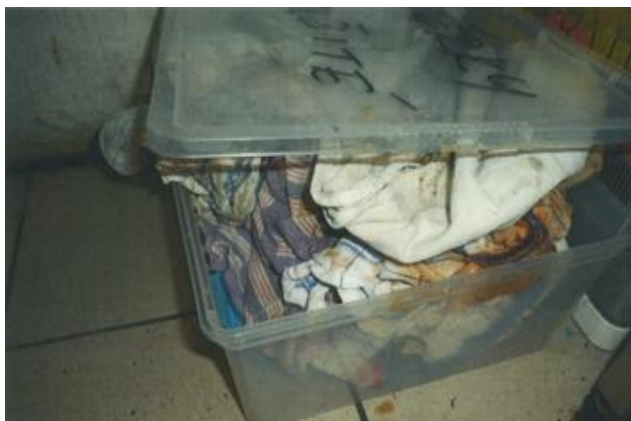
Zdroj: Krajská hygienická stanice Plzeňského kraje se sídlem v Plzni, oddělení hygieny výživy

Tím nebyla dodržena povinnost stanovená v článku 4 odst. 2 ve spojení s přílohou II kapitoly IX bod 2 a 3 nařízení ES č. 852/2004, neboť potraviny a suroviny musí být uloženy tak, aby byly chráněny proti kontaminaci, a to ve všech stupních výroby, zpracování a distribuce.