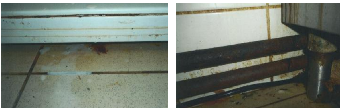
Obrázek č. 6 - Silně znečištěné podlahové plochy provozovny společného stravování