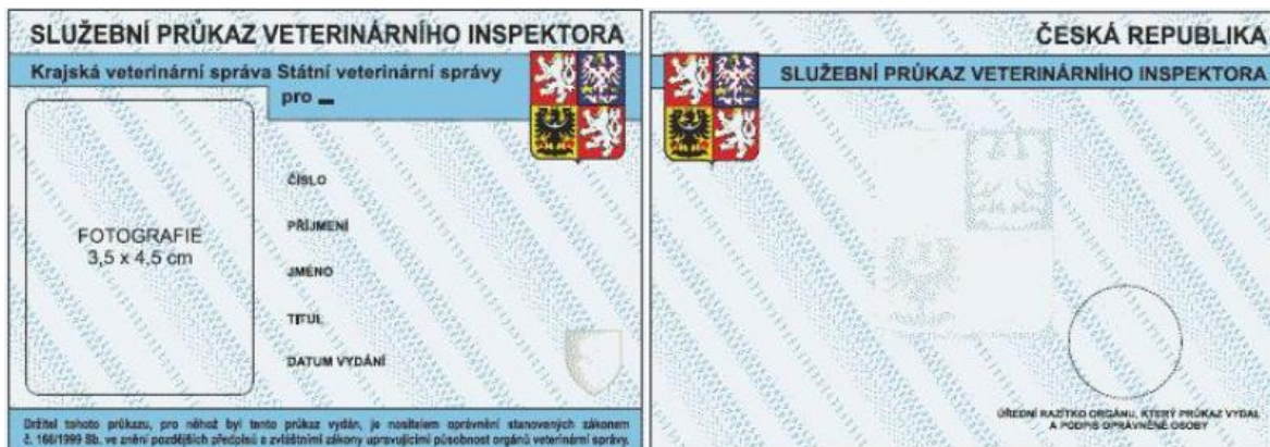
Obrázek č. 4 - Vzor přední a zadní strany služebního průkazu inspektora Státní veterinární správy