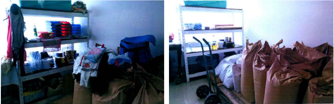
Zdroj: Krajská hygienická stanice Jihomoravského kraje se sídlem v Brně, oddělení hygieny výživy