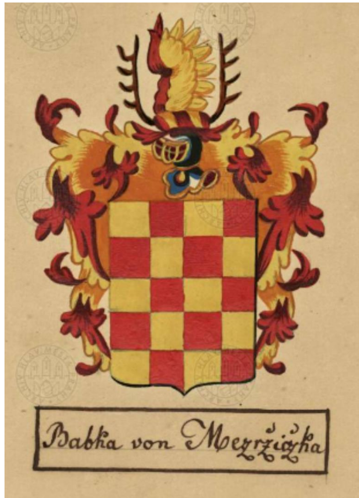
Příloha č. 1 Erb Babků z Meziříčka