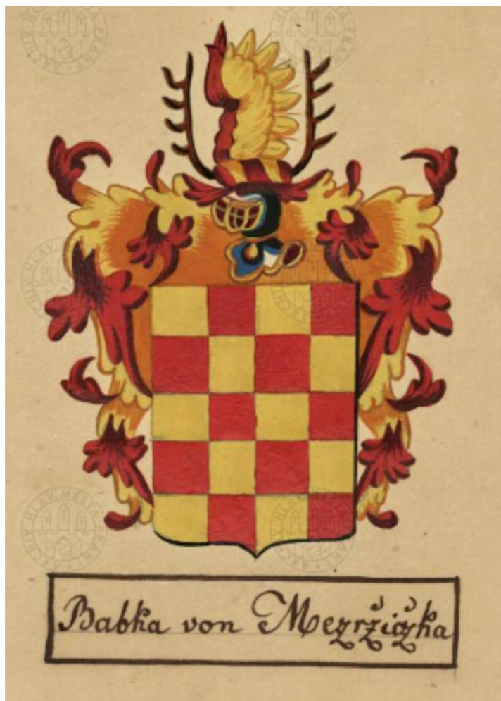
Příloha č. 1 Erb Babků z Meziříčka