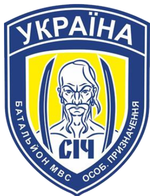
Obrázek č. 9