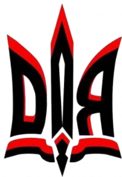
Obrázek č. 7