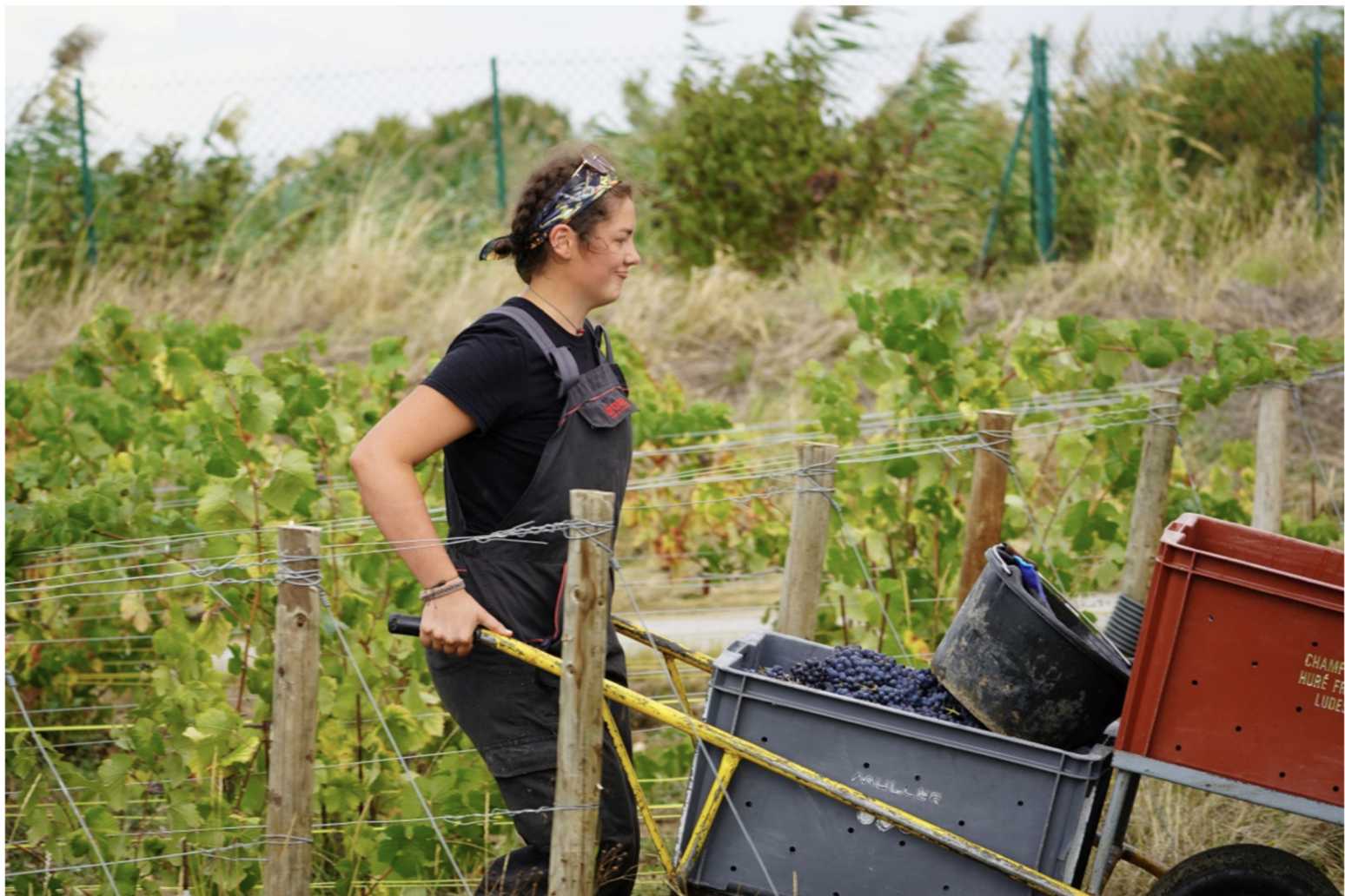
Příloha 4: Svážení sklizených hroznů z řádku poblíž vesnice Chigny-les-Roses, Francie. Na fotografii je zachycen speciální svážecí vozík.