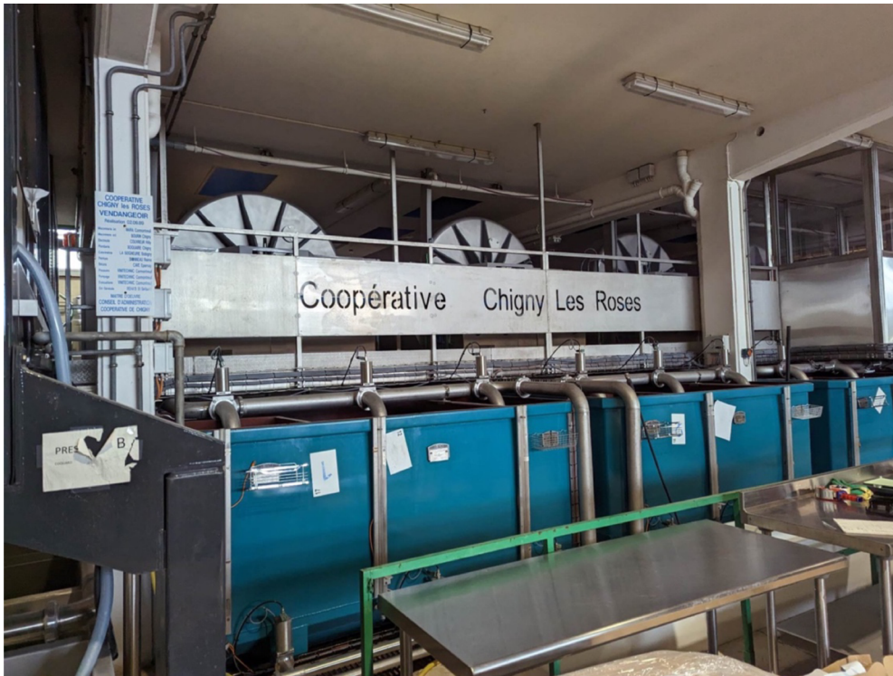
Příloha 13: Lis uvnitř budovy družstva vesnice Chigny-les-Roses.