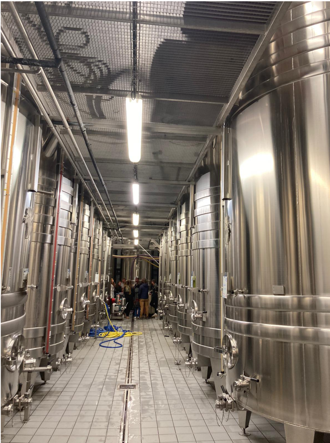
Příloha 5: Cuverie – nádrže z nerezové oceli umístěné v budově družstva s řízenou teplotou, ve kterých je uskladněna šťáva z hroznů. Probíhá zde proces první fermentace a ze šťávy se díky kvasinkám stává víno.