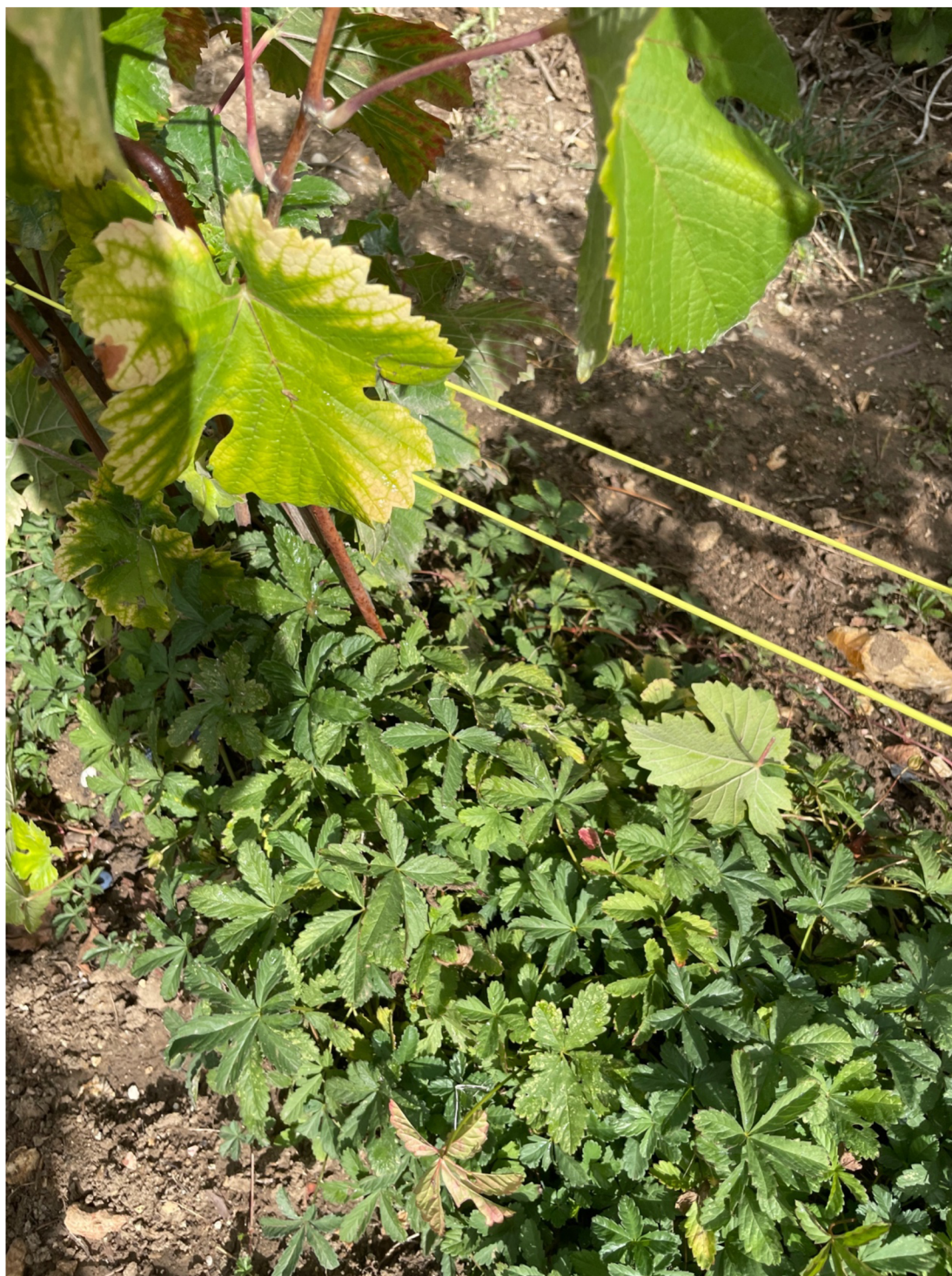
Příloha 9: Plevel rostoucí ve vinici. Na snímku je zachycena Mochna plazivá ( Potentilla reptans ).