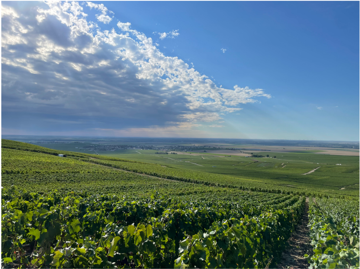
Příloha 1: Jižní svahy vinice nedaleko obce Bouzy, Francie.