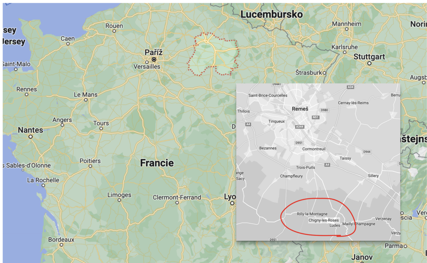
Příloha 21: Mapa Francie s vyznačeným departmentem Marne (přerušovaná červená) a výřez z oblasti Marne (černobílý čtverec) s červeně vyznačenou oblastí, v níž se nacházejí vesnice, pod které spadají vinice použité pro analýzu této práce ( https://www.google.com/maps , upraveno).