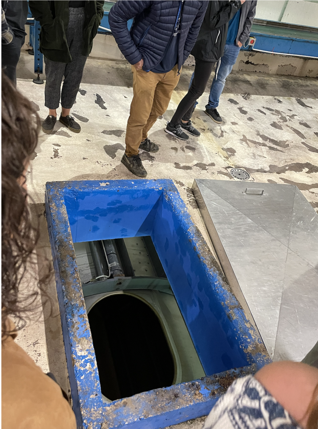
Příloha 6: Otvor vedoucí do lisu.