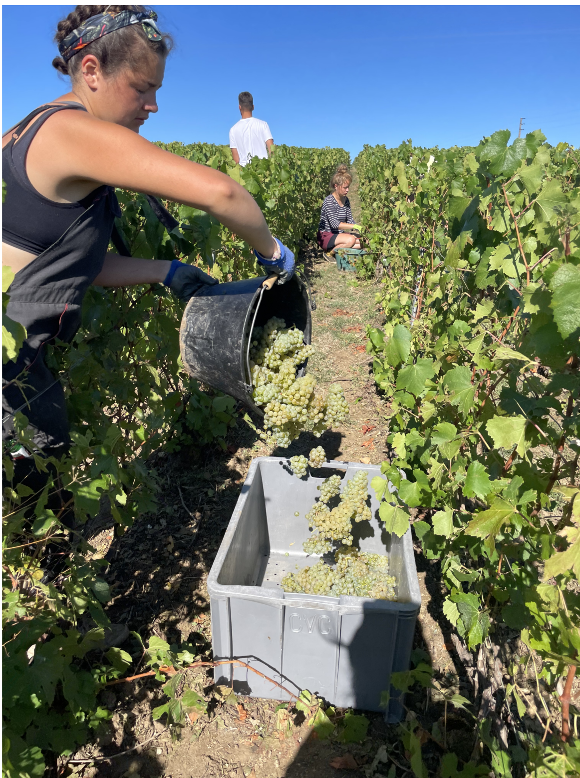
Příloha 2: Sklizeň odrůdy Champagne 6. září 2022 na vinici nedaleko vesnice Rilly la Montagne, Francie.