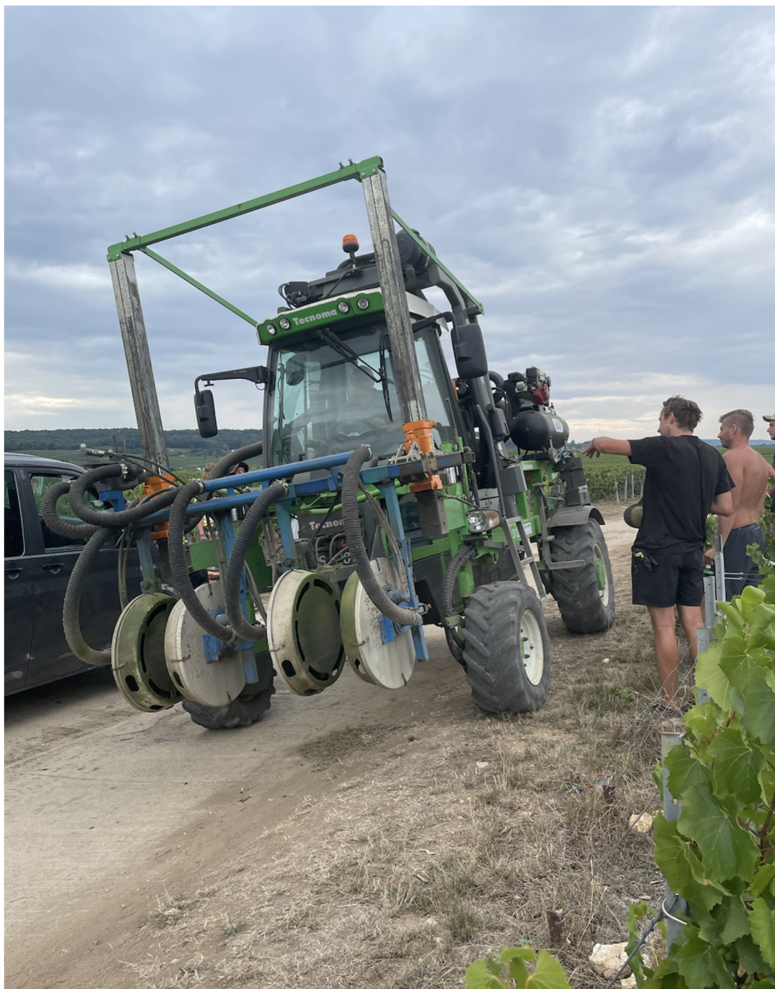
Příloha 12: Speciální traktor určený k metodě effeuilleuse, tedy ofoukání přebytečných listů před zahájením sklizně.