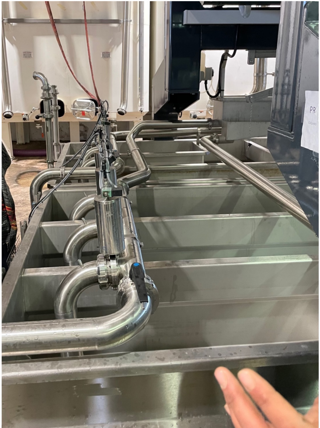
Příloha 10: Otevřená nádrž (beton), ve které se separuje šťáva tekoucí z lisu a kde se přidává oxid siřičitý.