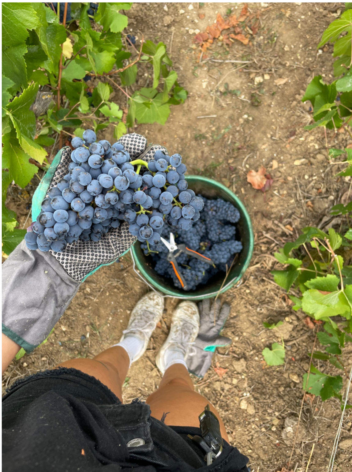
Příloha 3: Sklizeň červené odrůdy Pinot Menieur na vinici v okolí vesnice Chigny-les-Roses, Francie. Na fotografii je zachyceno příslušenství sběrače.