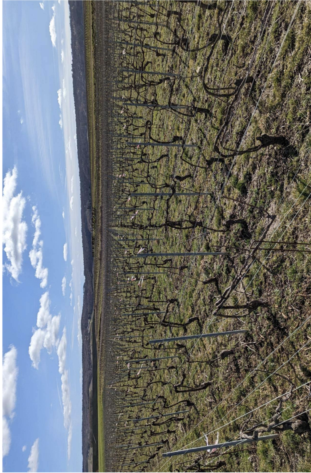
Příloha 11: Pěstování vinné révy metodou Cordon de royat. Na snímku zachycena vinice nedaleko vesnice Chigny-les-Roses, použítá pro sběr dat (vzorek C).