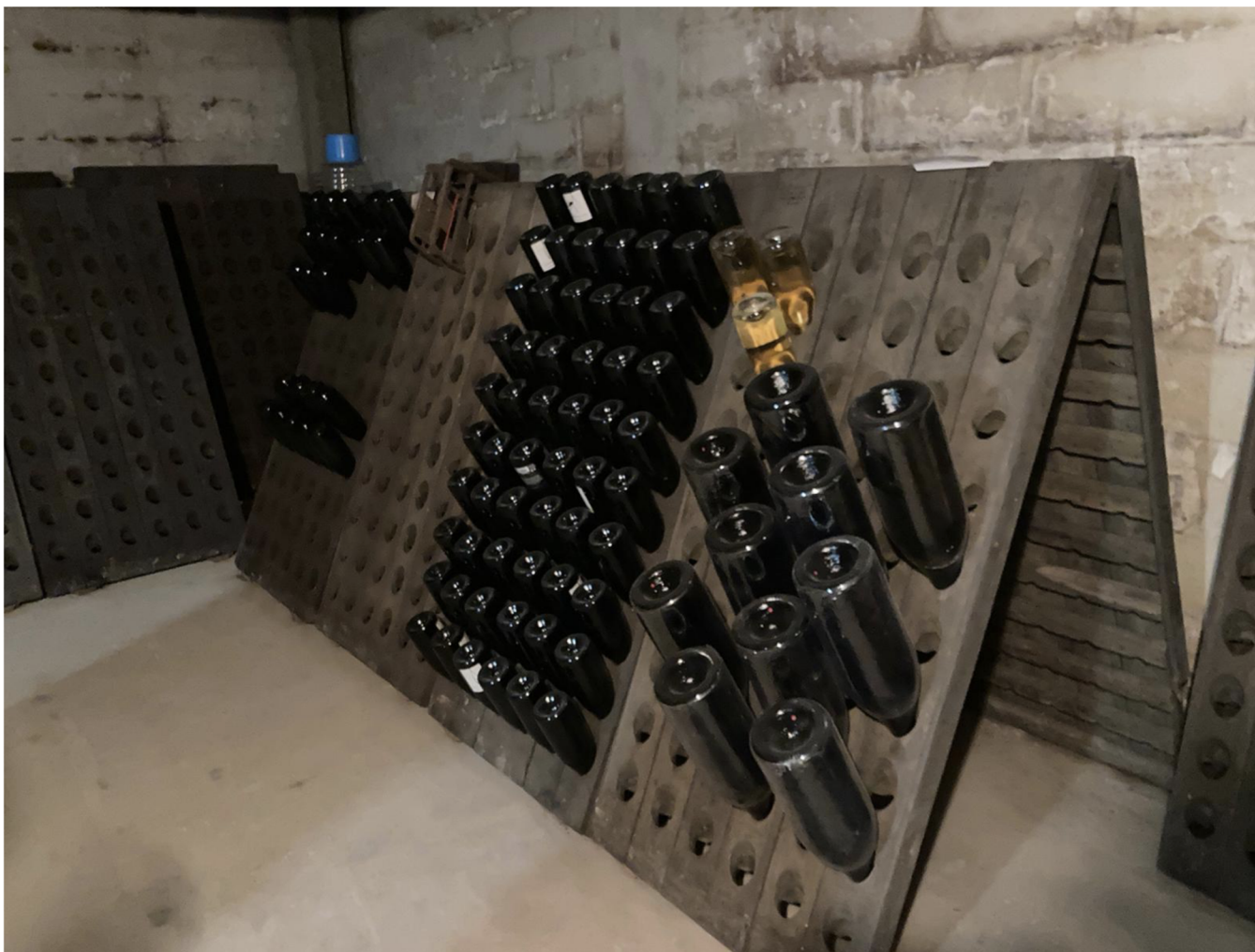
Příloha 8: Remuage – způsob, při kterém zraje šampaňské při procesu druhé fermentace, kdy je uvolňován alkohol a bublinky. Sedimenty a kvasinky se ukládají v hrdle lahve.