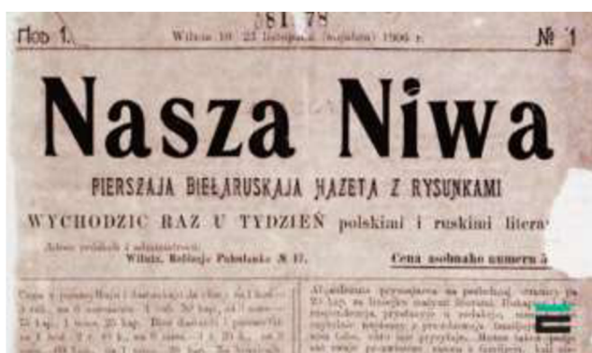
Рис. 3 Газета «Наша ніва», написанная латиницей

К концу XIX – началу XX вв. под влиянием православной церкви латиница начинает относительно мирно сосуществовать с кириллицей. Например, газета « Наша ніва » в это время издавалась как латиницей, так и кириллицей одновременно (рис 3 и 4). Это происходило потому, что западная часть белорусских земель охотнее читала на латинице, а восточная – на кириллице.