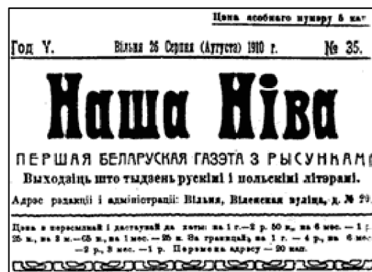
Рис.4 Газета «Наша ніва», написанная кириллицей