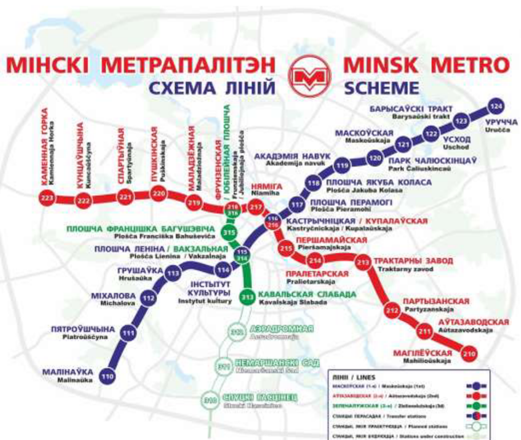
Рис. 5 Карта минского метрополитена

В некоторой степени белорусская латиница существует и сегодня. Во-первых, есть малый процент белорусскоговорящего населения, которые предпочитают на письме использовать латиницу. А, во-вторых, латиница нашла широкое применение в транслитерации, в первую очередь наименований географически значимых объектов. В то время как, например, в России транслитерация происходит по правилам английской графики (ш → sh, ч → ch и т.д.; сравн. ст.м. Пушкинская → Pushkinskaya), белорусская Академия наук посоветовала правительству использовать транслитерацию, основанную на латинице, которой пользовались белорусы в начале XX века (Пятроўшчына → Piatroŭščyna) (рис 5).