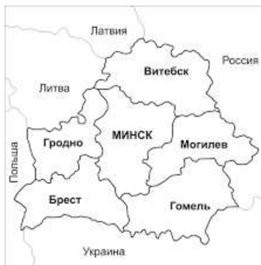
Рис. 6 Карта Республики Беларусь

По данным в таблице 1 видно, что число людей, назвавших белорусский родным, значительно уменьшилось за исследуемый промежуток времени. И хотя больших отличий с этой точки зрения между регионами нет, тем не менее, по данным Национального статистического комитета по отдельным регионам страны, можно заметить, что, в то время как в большинстве областей тенденция соответствует общей по стране, в Брестской области (область, граничащая с Польшей и Украиной) (см. рис. 6) процент граждан, назвавших белорусский родным не только не упал, но даже возрос.