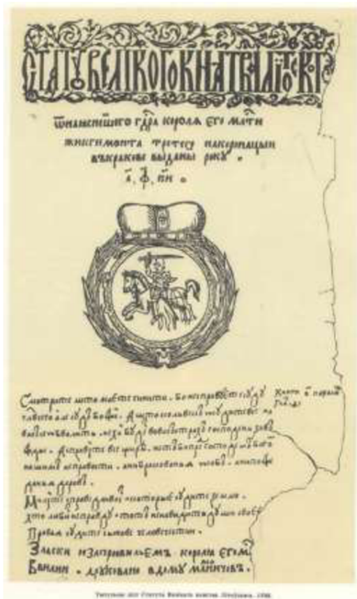
Рис. 1 Статут ВКЛ

Формирование белорусского языка на основе диалектов племен дреговичей, кривичей, родимичей и некоторых других относится к XIII–XIV вв. В это время появляются разного рода официальные тексты на территории славянских княжеств,