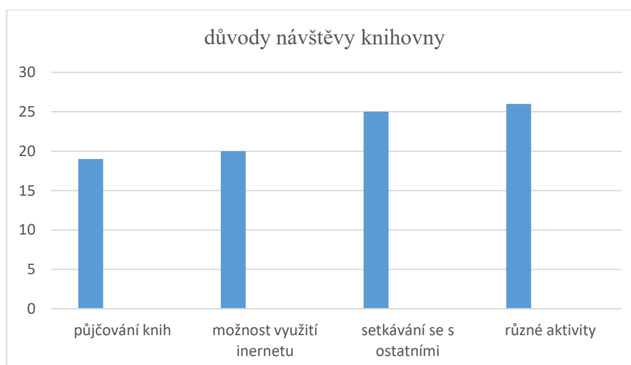
Graf 2 - Jednotlivé důvody návštěvy knihovny