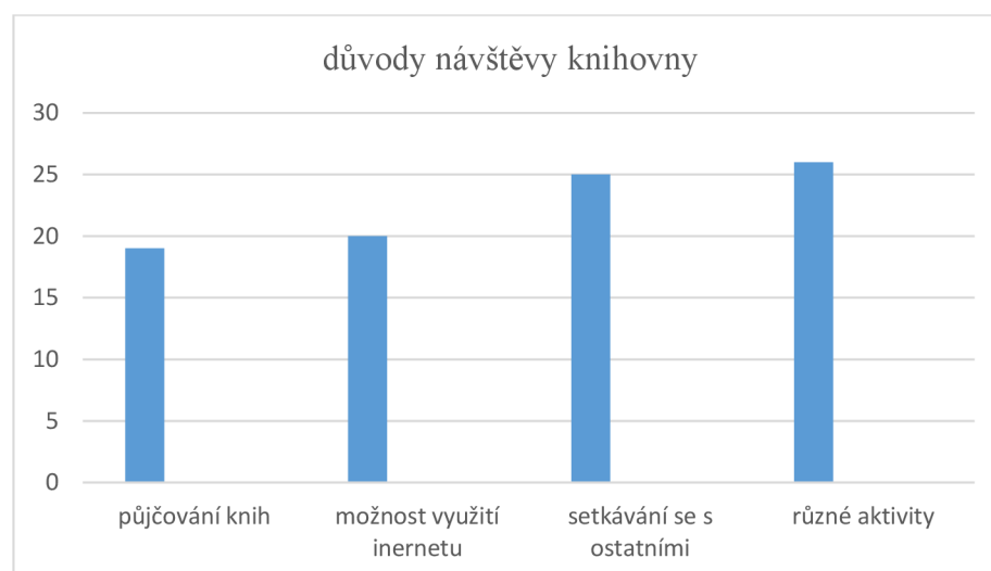
Graf 2 - Jednotlivé důvody návštěvy knihovny