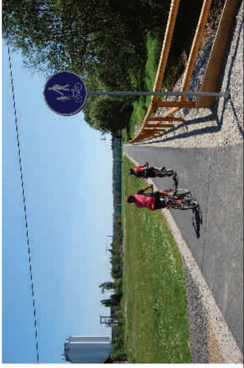
Obr. 1 - Cyklostezka