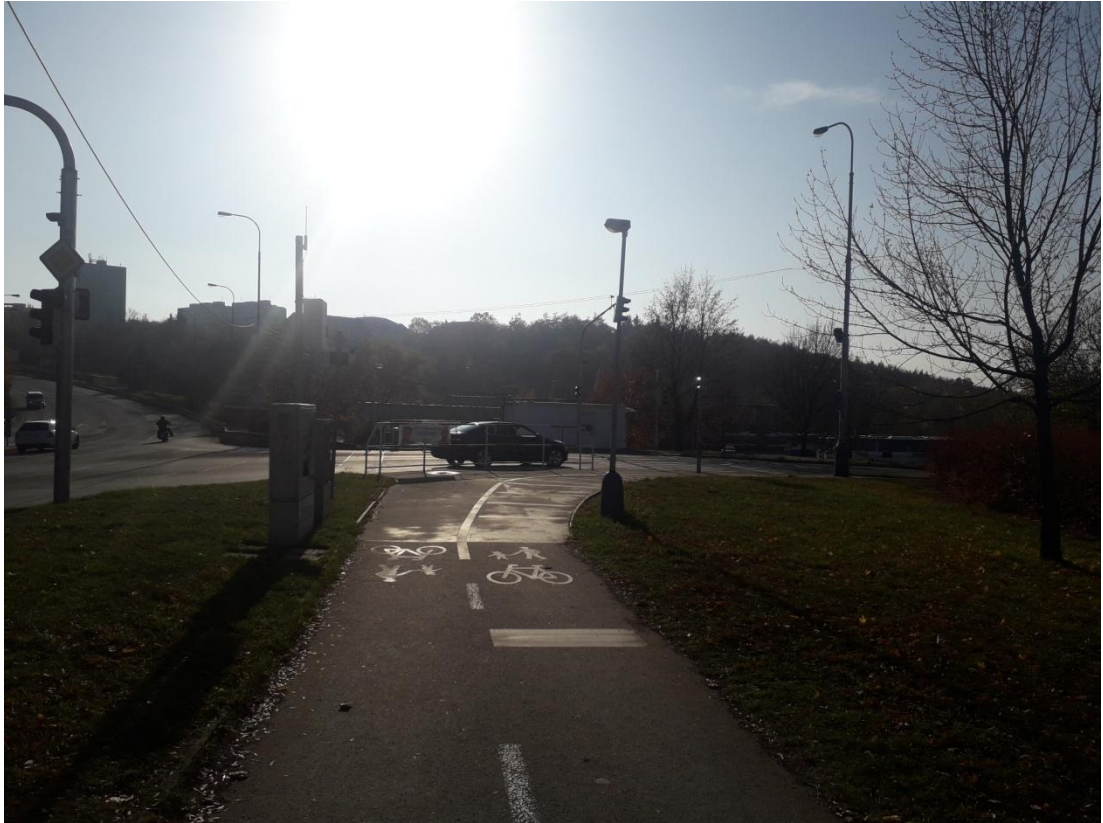
Obrázek 11: Cyklostezka v blízkosti komunikace (Jakubiček, 2018).