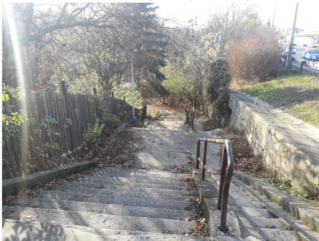
Obrázek 16: Špatná průchodnost územím v západní části území (Jakubiček, 2018)