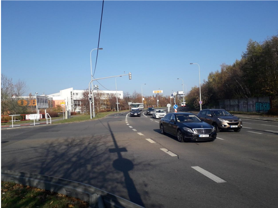
Obrázek 8: Dopravní vytíženost (Jakubíček, 2018).