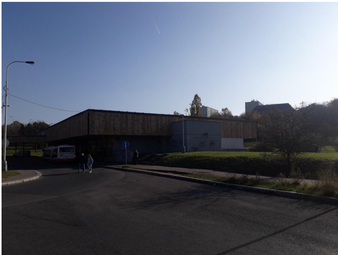
Obrázek 1: Stanice metra Roztyly (Jakubíček, 2018).