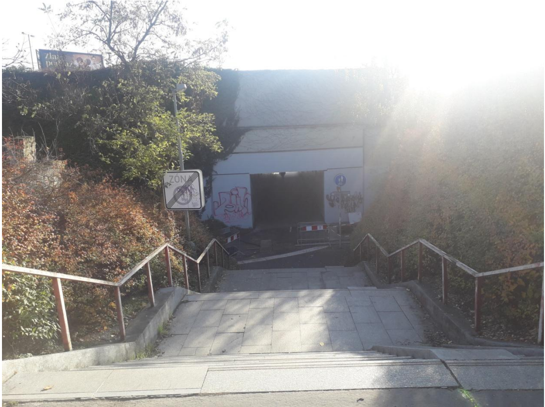
Obrázek 13: Špatná prostupnost územím (Jakubíček, 2018).