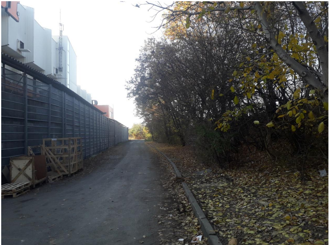
Obrázek 14: Zelený pást dělicí řešené území od komunikace 5. května (Jakubíček, 2018).