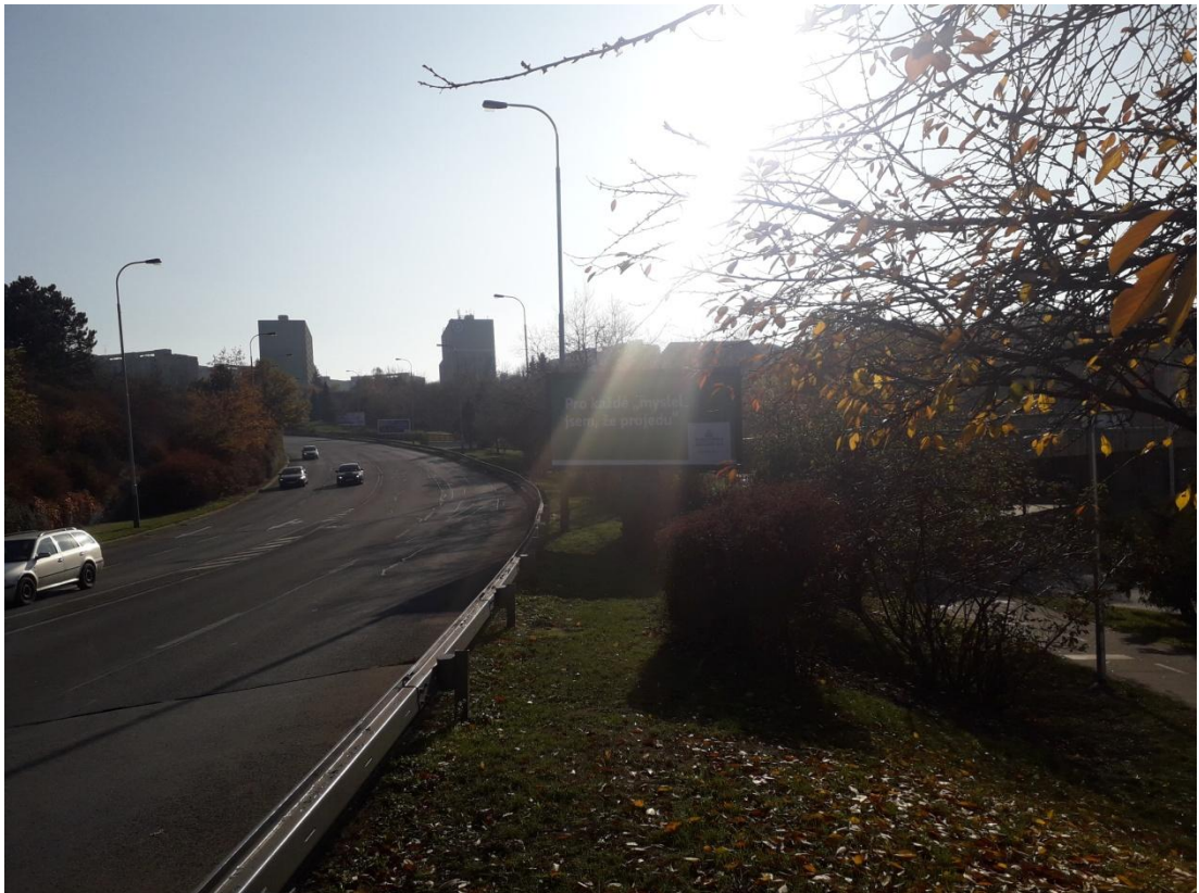
Obrázek 6: Cyklostezka v blízkosti komunikace (Jakubíček, 2018).