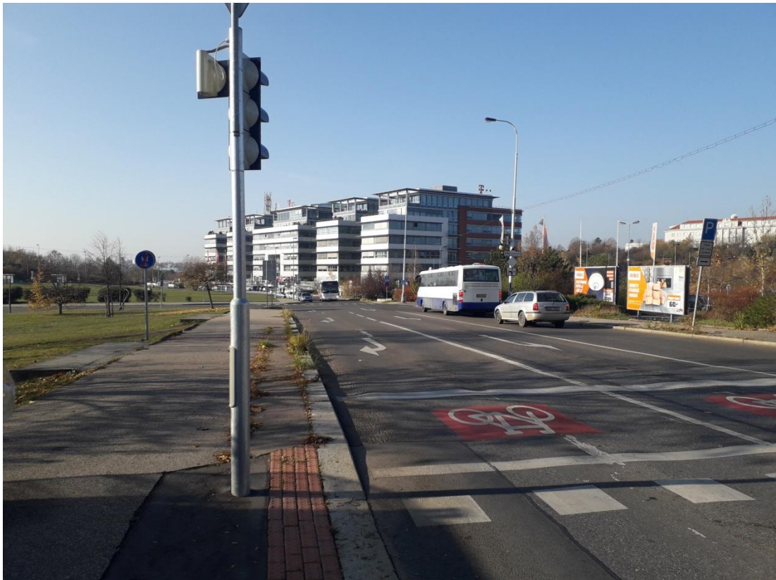
Obrázek 9: Příjezdová komunikace do řešeného území (Jakubíček, 2018).