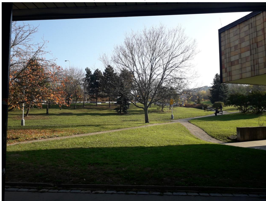
Obrázek 4: Okolí stanice metra (Jakubíček, 2018).