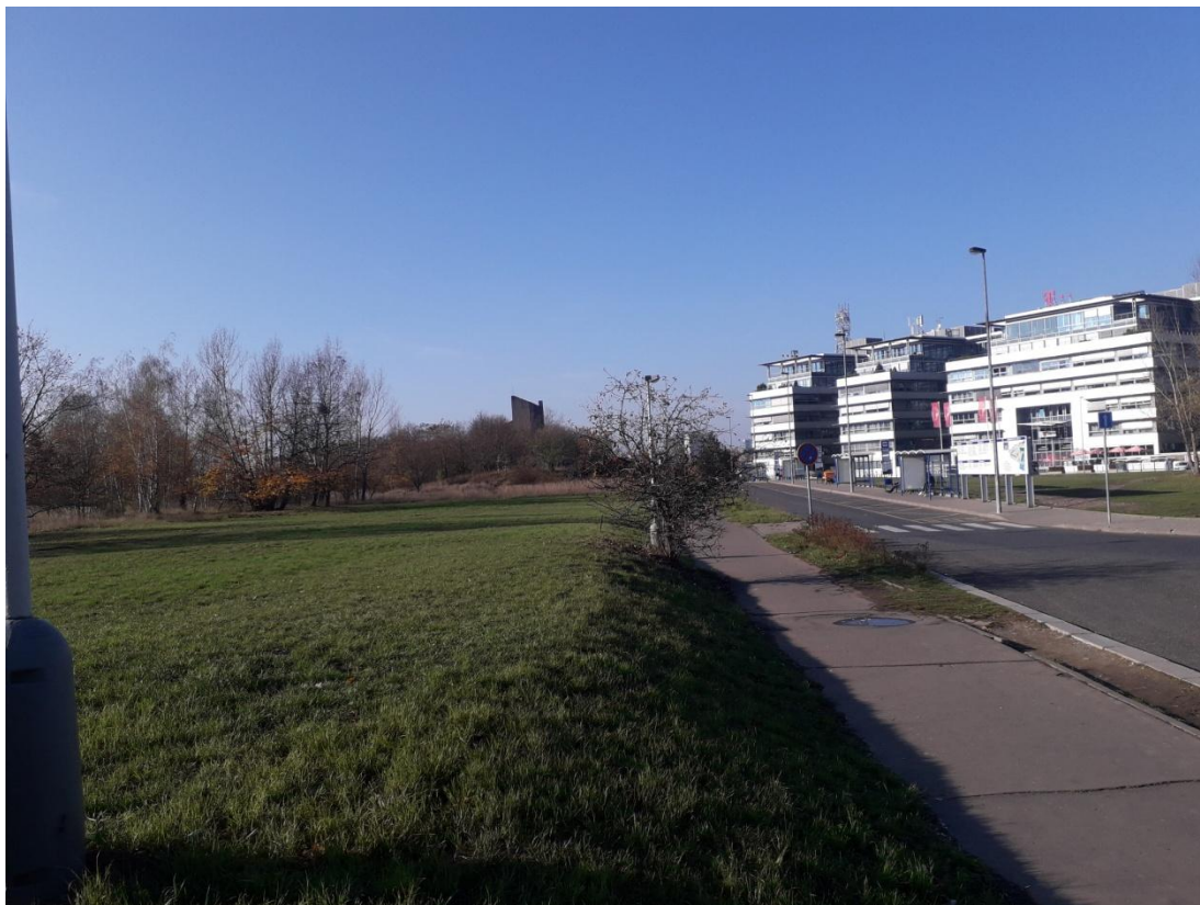
Obrázek 2: Budova T- mobile (Jakubíček, 2018).