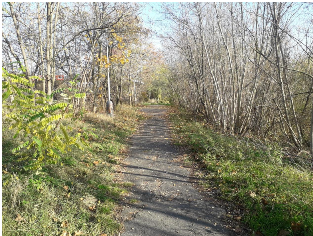
Obrázek 15: Průchodnost území v severozápadní části (Jakubiček, 2018).