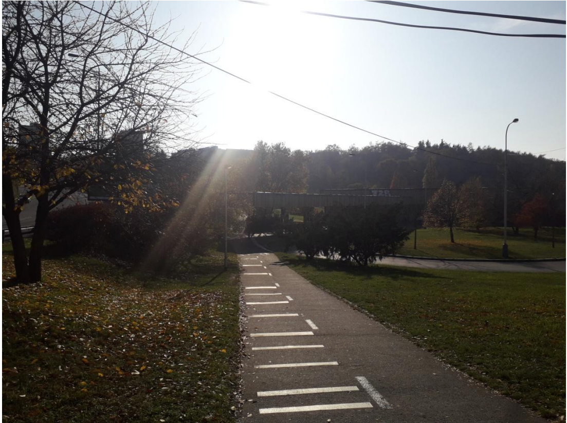
Obrázek 5: Cyklostezka (Jakubíček, 2018).