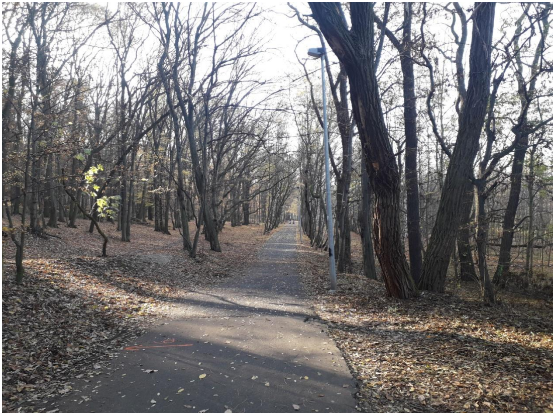
Obrázek 18: Michelský les (Jakubíček, 2018)