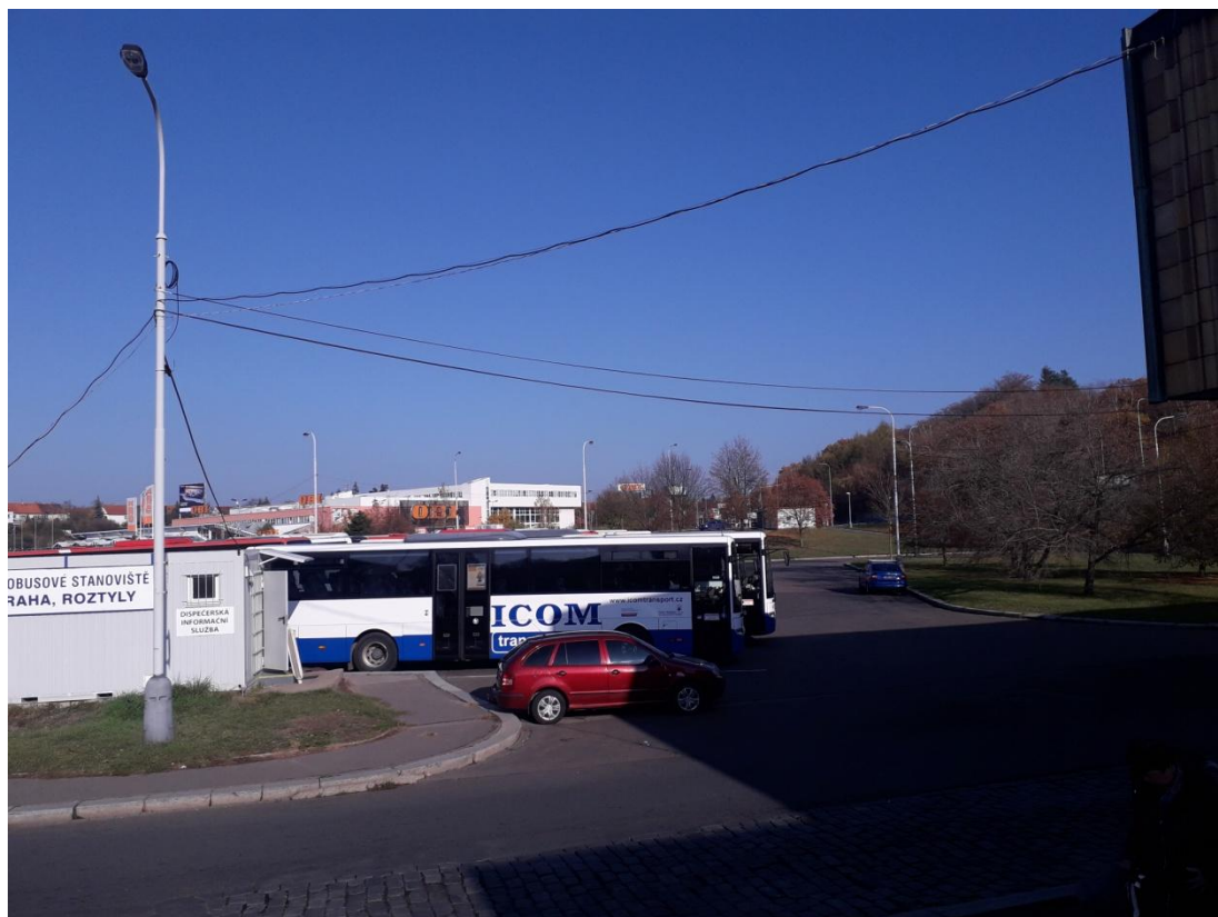
Obrázek 3: Autobusové nádraží (Jakubíček, 2018).