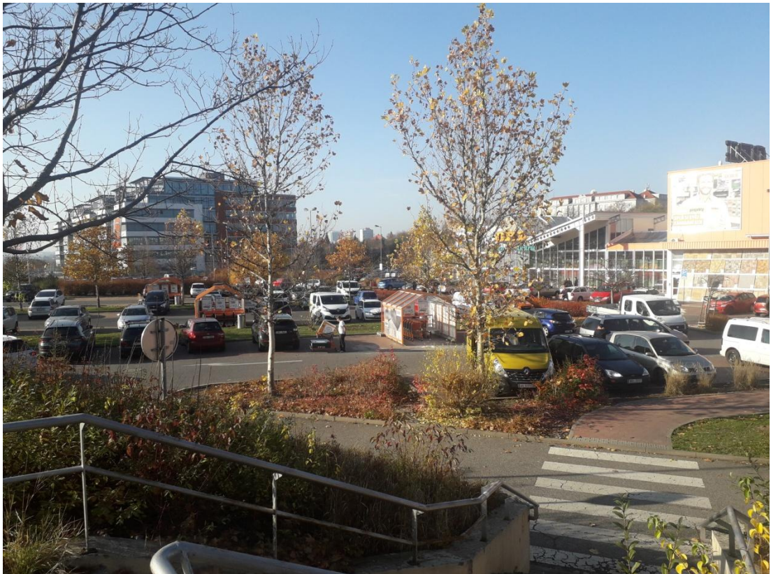
Obrázek 12: Parkoviště v blízkosti OBI a T-mobile (Jakubiček, 2018)