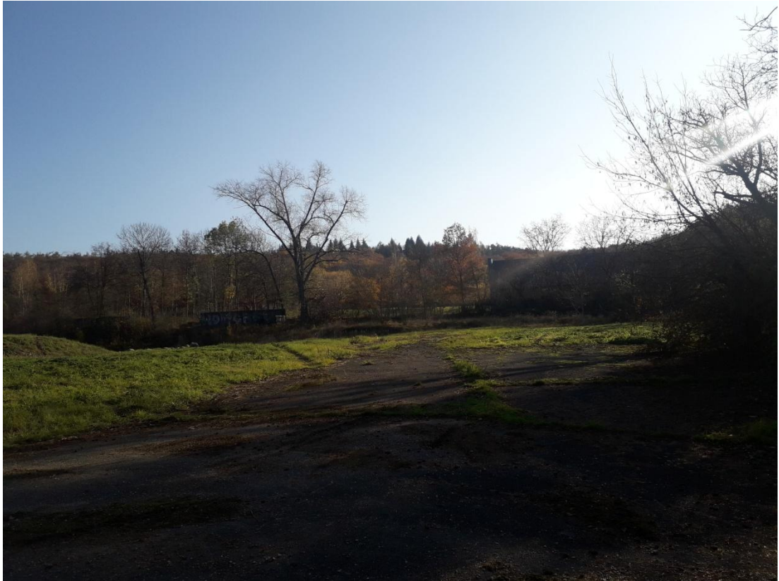
Obrázek 17: Plocha brownfieldu (Jakubíček, 2018).