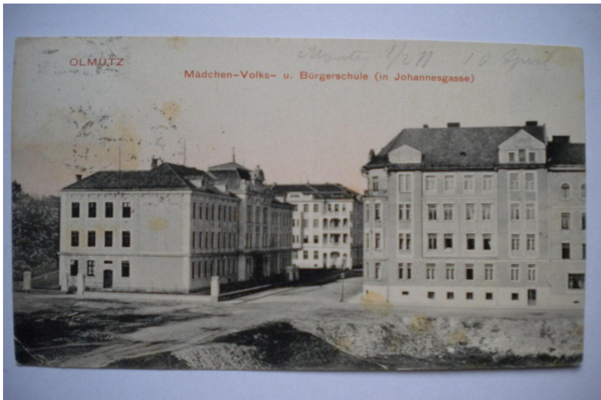
Příloha . 6 o dívčí obecná a měšťanská škola v dnešní T. Spojenc .