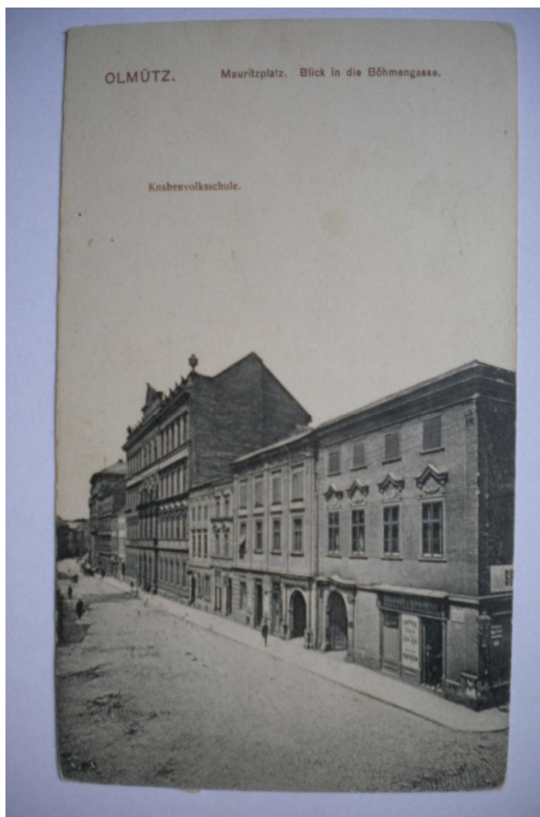
Příloha 9 Chlapecká obecná škola na Morickém náměstí.