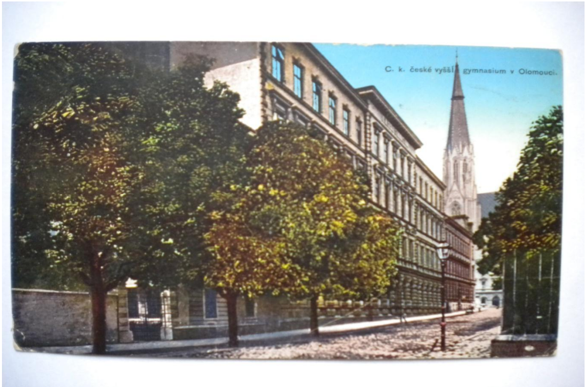
Příloha . 10 a 11 české reálné gymnázium. Rolnická škola.