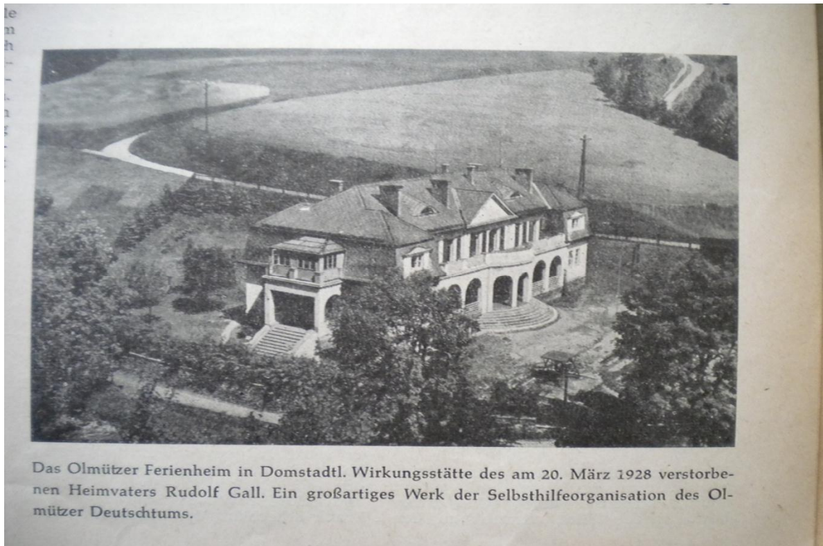
Příloha . 5 o Prázdninový dům v Domáňově .