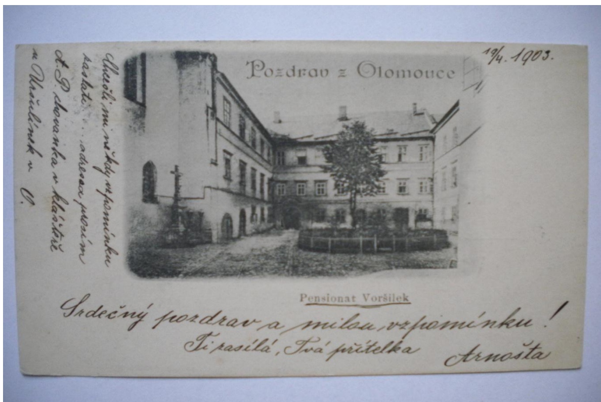
P íloha . 7 a 8 ó Pensionát Vor-ilek. Pöttingeum.