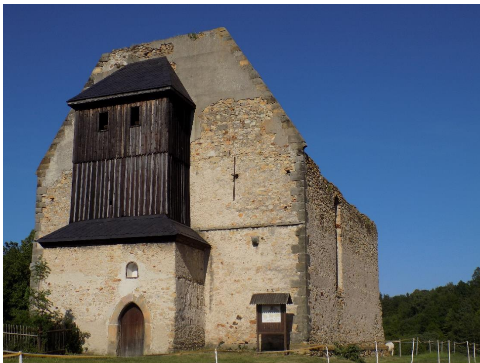
Obrázek 6: Pozůstatky kláštera Koruna Matky Boží v Krasíkově, za jehož obnovou roku 1466 stál Jiří Tunkl z Brníčka.