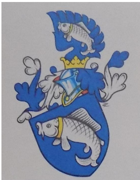
Obrázek 1: Erb šlechtického rodu Tunklů z Brnička a Zábřeha. Stříbrný kapr se zlatým obojkem na modrém poli. Klenot se u některých zobrazení liší.