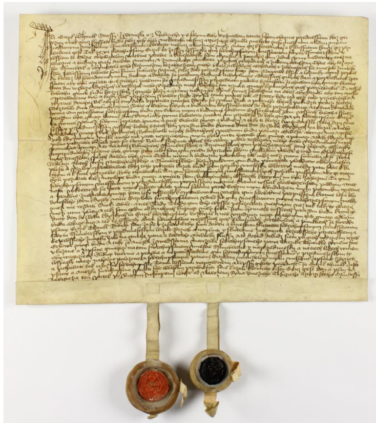
Obrázek 11: Listina z roku 1481, ve které upravuje Jiří Tunkl z Brnička práva šumperským měšťanům po urovnání vzájemných neshod. Červená pečeť je Jiřího Tunkla, černá pak jeho manželky Anežky z Valdštejna.