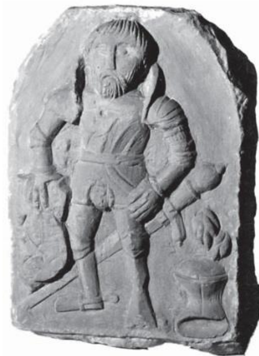
Obrázek 7: Kamenná plastika přisuzovaná Jiřímu Tunklovi z Brníčka. Sběrka zábrěžského muzea.