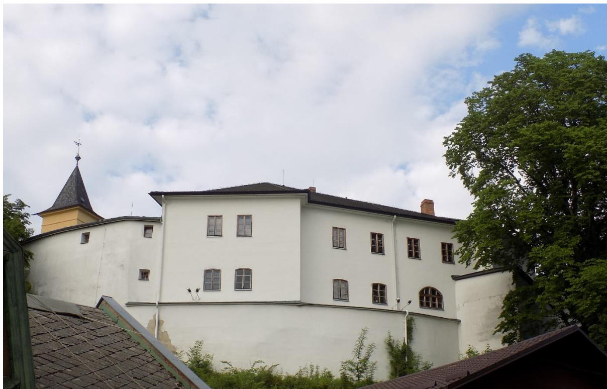
Obrázek 4: Městský hrad v Zábřezě, někdejší sídlo Jiřího Tunkla z Brnička. Dnes zde sídlí starosta a městský úřad.