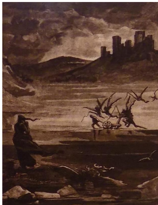
Obrázek 12: Ilustrace Hanse Schwaigera k pověsti o Tunklovi z roku 1897. Jiří Tunkl z Brnička byl podle pověsti přinucen za trest rozorávat hráz svých rybníků jsa zapřažen v čertově pluhu.