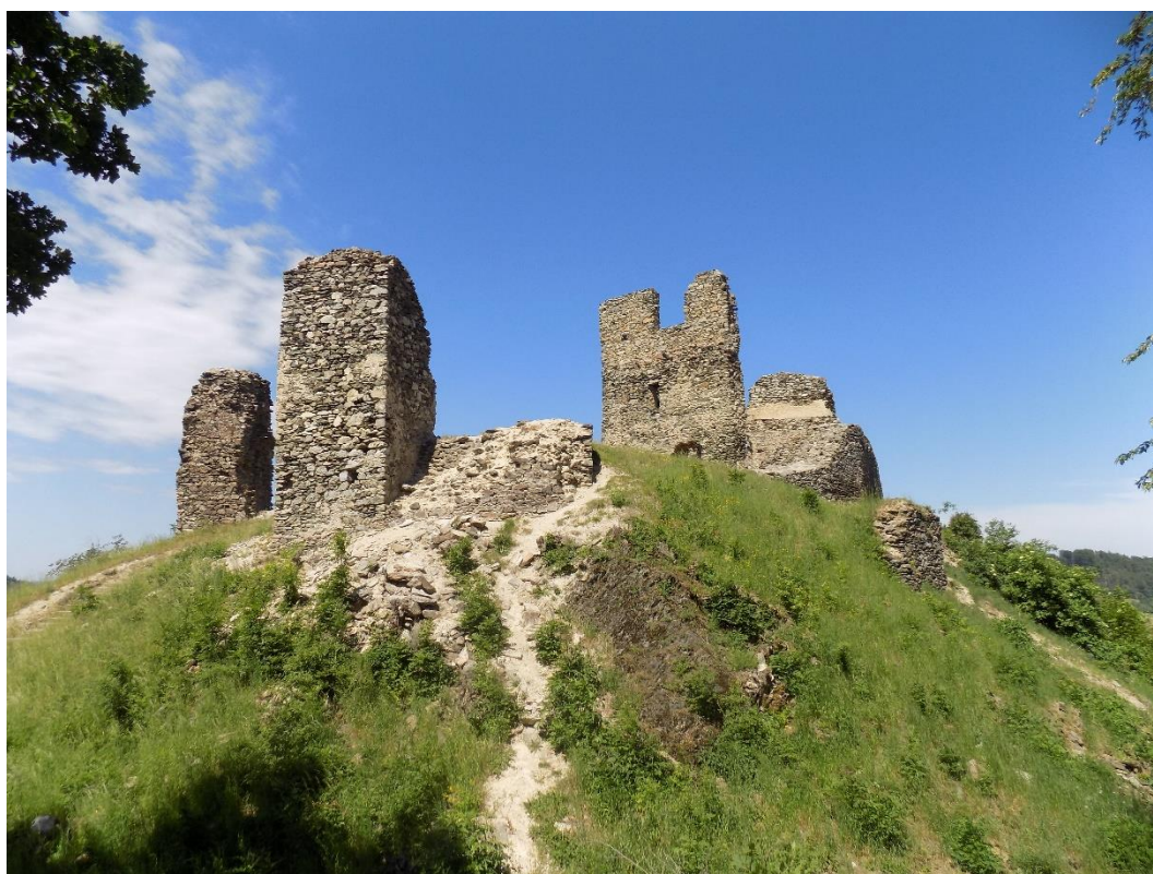
Obrázek 2: Zřícenina hradu Brničko, sídla brničské větve rodu. Po jeho dobytí někdy kolem roku 1471 nebyl znovu obnoven a již jen chátral.