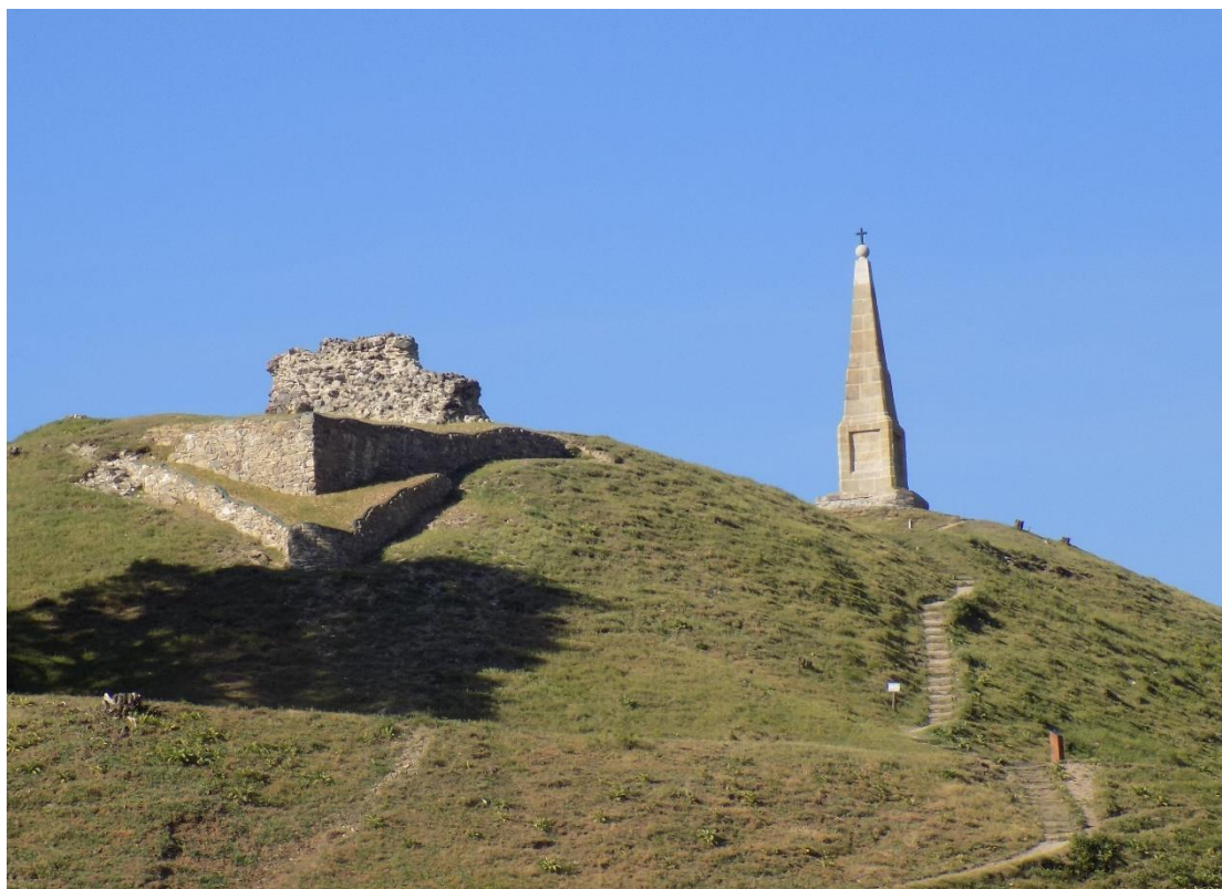
Obrázek 5: Zřícenina hradu Hoštejn, který Tunklové získali roku 1463. V poslední době byla část hradeb za přispění nadšenců opravena.