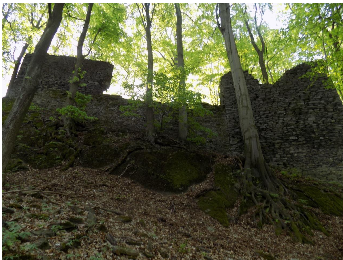
Obrázek 8: Zřícenina Nového Hradu u Hanušovic, který měli Tunklové v zástavním držení. Příčinou jeho dobytí vojsky Matyáše Korvína byla jeho velká rozloha a nepočtená posádka, která nemohla dlouhé hradby obsadit.