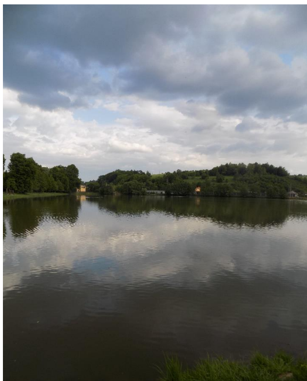
Obrázek 10: Rybník Oborník (dříve Zámecký) v Zábřeze, jehož založení je připisováno Jiřímu Tunklovi z Brníčka.