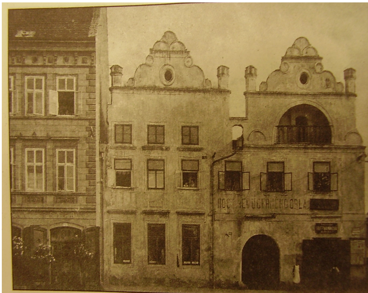
Příloha č. 1: Dům U Černého orla