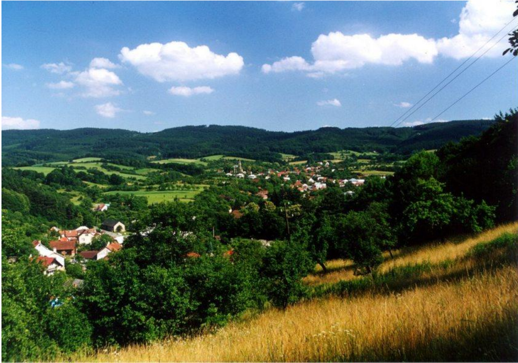
9. Pohled na Bratřejov od Ubla.