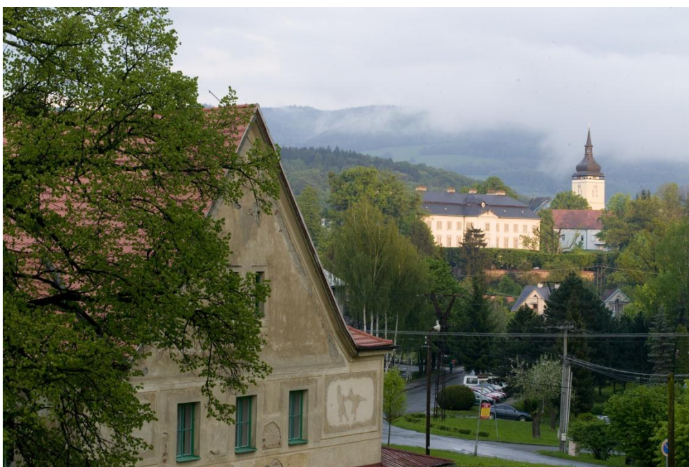
6. Město Vizovice. Na snímku jsou zachyceny hlavní dominanty města (zleva) – Sokolovna, zámek a věž kostela. ( http://www.vizovice.eu/ )