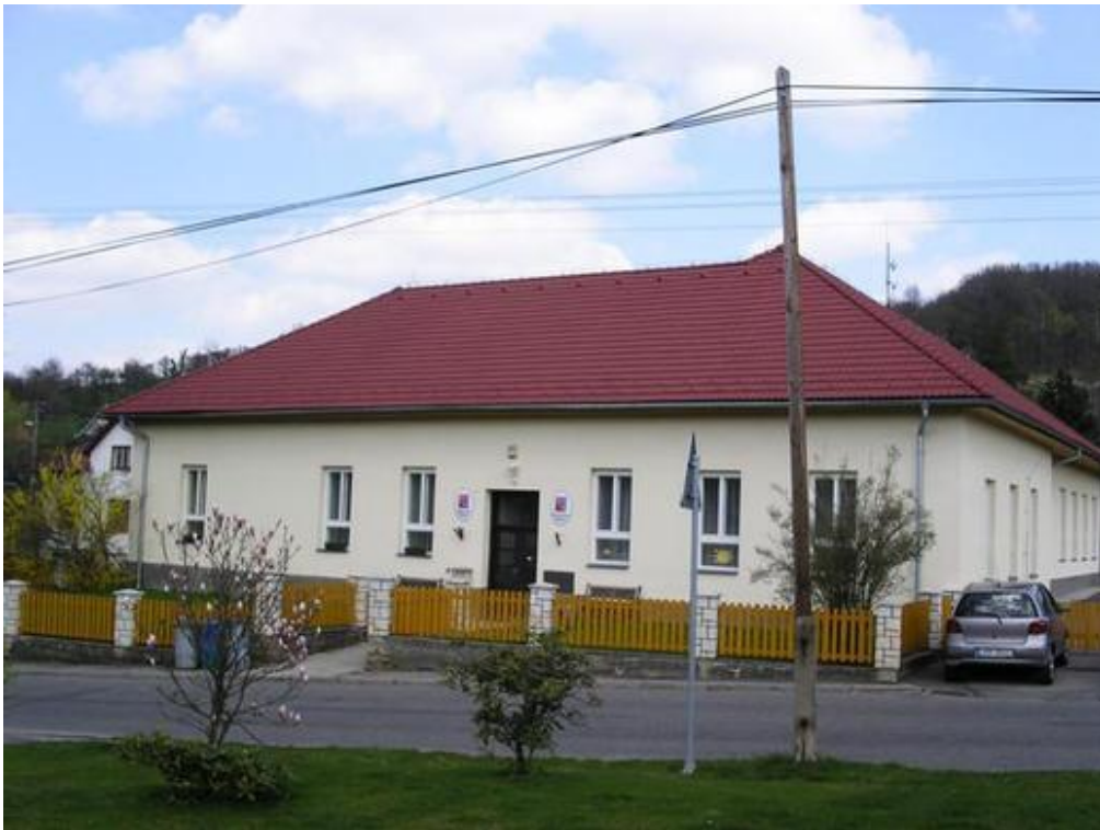
10. Budova dnes již bývalé školy postavená roku 1884. V současnosti je v budově umístěna mateřská škola a obecní úřad. ( http://www.ublo.cz/ )