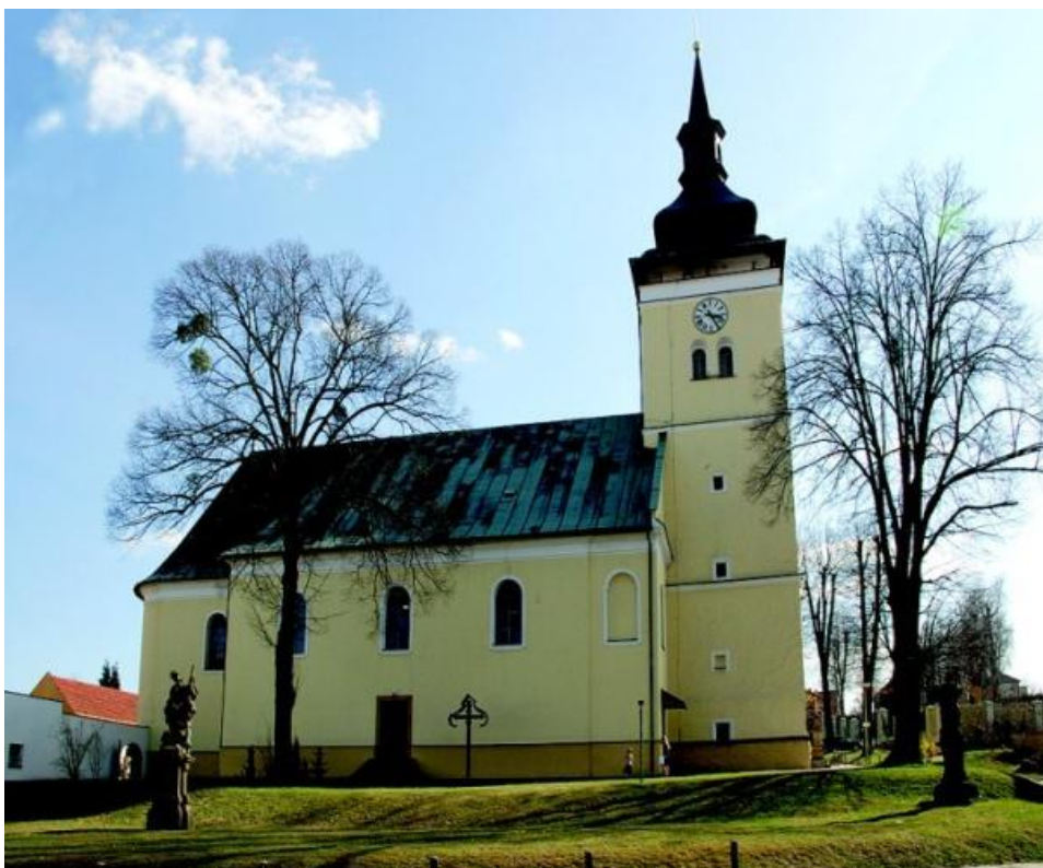
5. „Nový“ vizovický kostel sv. Vavřince vystavený v letech 1793–1795. Věž kostela pochází z roku 1495. Na místě před věží kostela stávala školní budova č. p. 366 vystavená v roce 1785. Před ní na stejném místě stávala pravděpodobně dřevěná škola vystavená v roce 1726. ( http://www.farnostvizovice.cz/ )