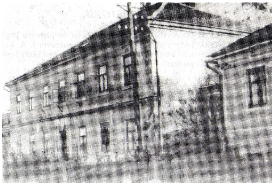
2. Trojtřídní škola ve Vizovicích z roku 1862. ( 100. výročí budovy školy na Masarykově náměstí ve Vizovicích 1892-1992 . Vizovice: [s. n.], 1992, s. 5)