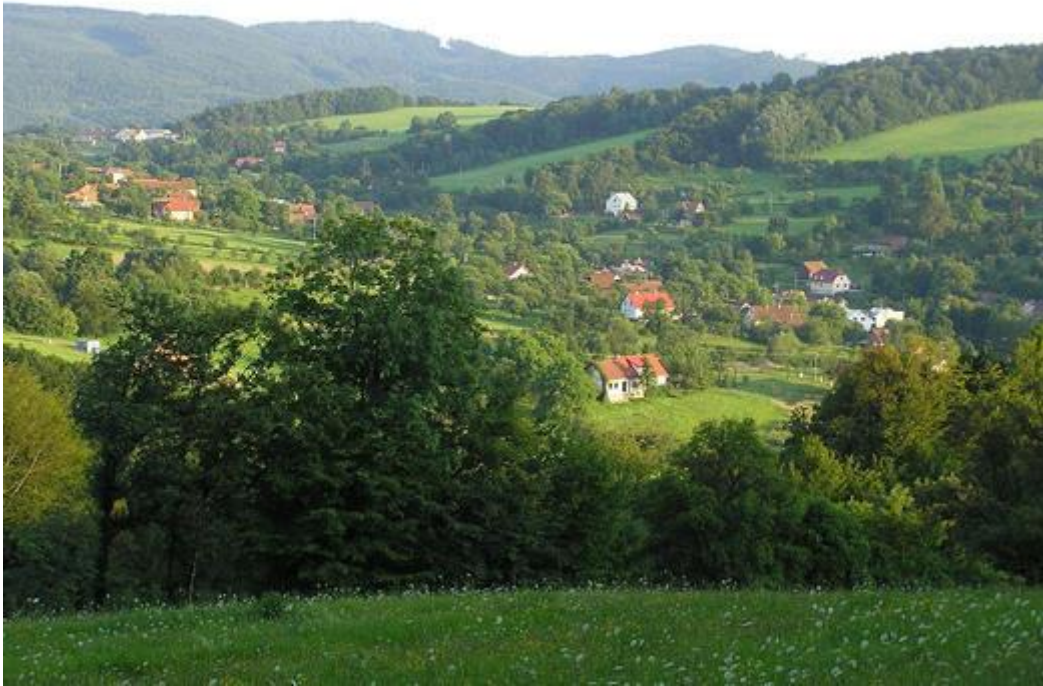
11. Pohled na Ublo. ( http://www.ublo.cz/ )