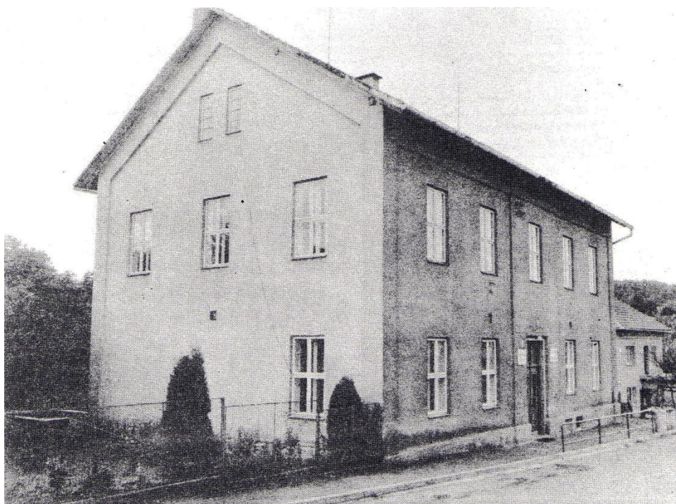
8. Budova nové školy pocházející z roku 1886. V této budově je škola umístěna i v současnosti. (LUKŠA, Miroslav. 100 let trvání budovy školy v Bratřejově . Bratřejov: Místní národní výbor v Bratřejově, 1986, s. 62)