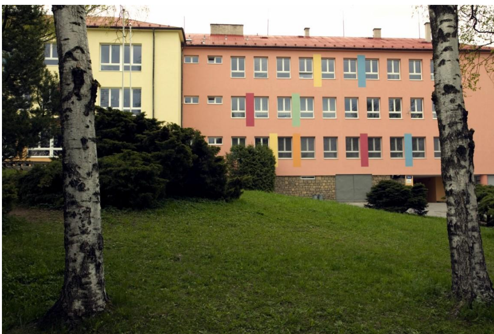
4. Budova hlavní vizovické „nové školy“ z roku 1950, stojící na ulici Školní. V posledních letech prošel interiér i exteriér školy velkou rekonstrukcí. ( http://www.vizovice.eu/ )