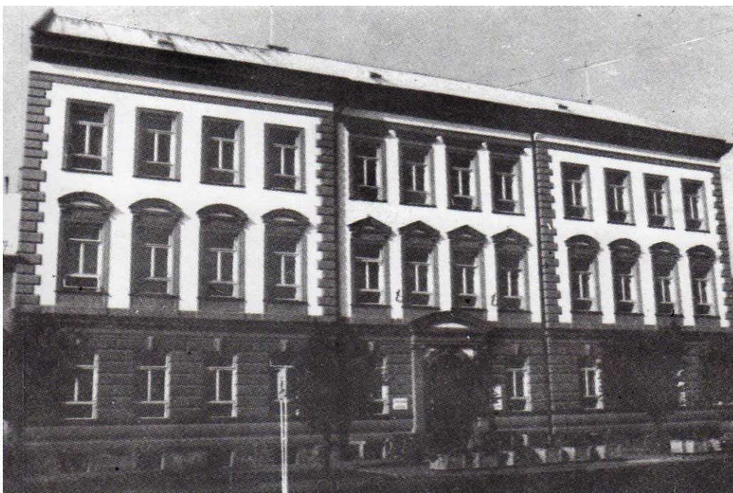
3. Budova „staré školy“ z roku 1892, stojící na Masarykově náměstí ve Vizovicích. Dnes jsou v této budově umístěny 1. – 3. třída prvního stupně Základní devítileté školy a Základní škola praktická. ( 100. výročí budovy školy na Masarykově náměstí ve Vizovicích 1892-1992 . Vizovice: [s. n.], 1992, s. 5)