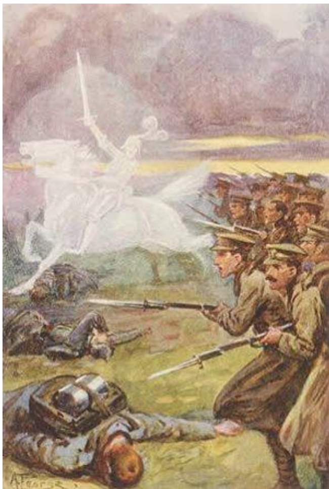
9. Svatý Jiří vedoucí britské vojáky do útoku. 172