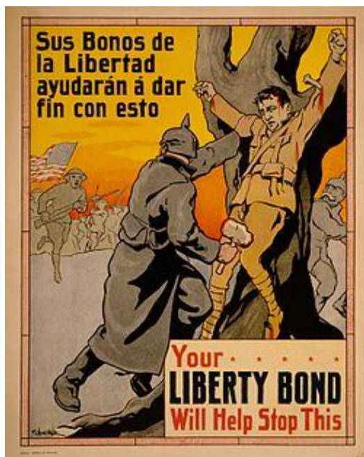
12. Propagandistický plakát zobrazující ukřižovaného vojáka, nápis zní: Vaše dluhopisy pomohou toto zastavit. 175