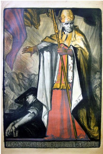
3. Kardinál Joseph Mercier chráníci Belgie. 166