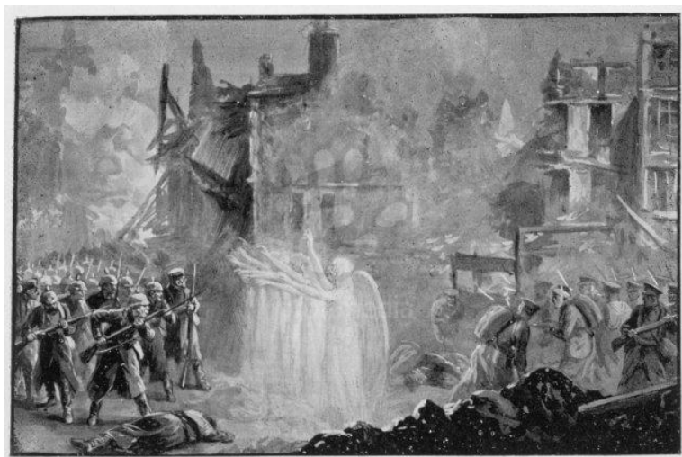
6. Andělé čelící německým jednotkám ve městě Mons. 169