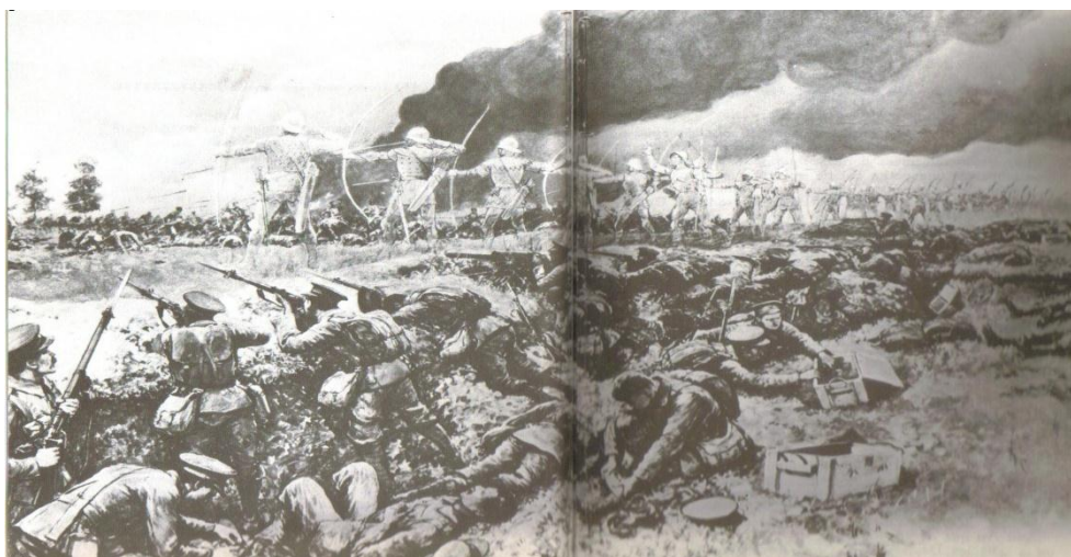
11. Lučištníci z bitvy u Agincourt zastavující útočící německou infanterii. 174