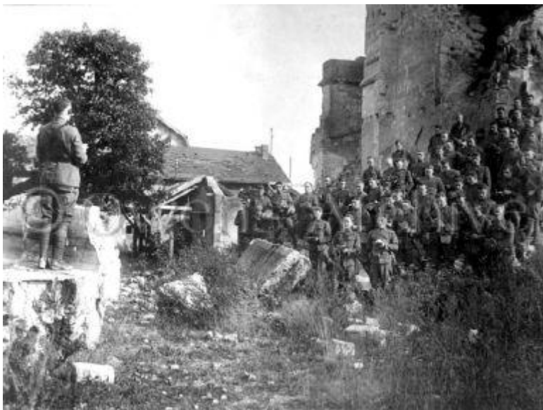
4. Polní mše. 167