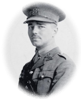
Wilfred Owen 163

Tak vstal Abraham a dřeva nadělal A nůž i oheň s sebou vzal Jak spolu kráčeli Izák, syn prvorozený náhle děl Otče můj Pohled' - oheň i rožeň připraven Kde však ovce kterou obětovat chceš? Tu spoutal Abraham mládence toho opasky a popruhy a zákop s předprsňemi udělal A nůž vztáhl, aby zabil syna svého Když tu andělův se ozval z nebes hlas Řkouc - ušetři syna svého, a nečiň jemu ničeho. Pohled' - Tam v houští beran za rohy se chyt Nabídni jej v oběť místo něho Ale ten starý muž však nedbal A synu svému život vzal A půl sémě Evropy, jednoho po druhém oddělal.