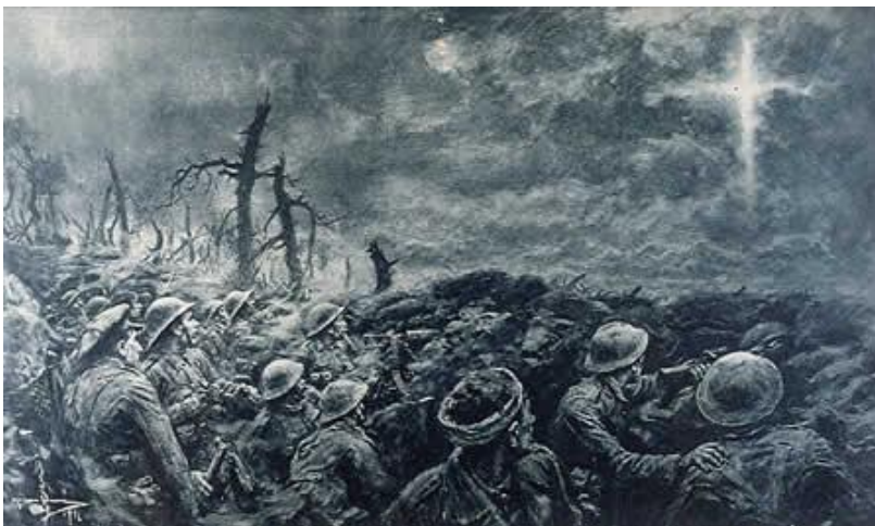
8. Zjevení kříže na obloze na sommské frontě. 171