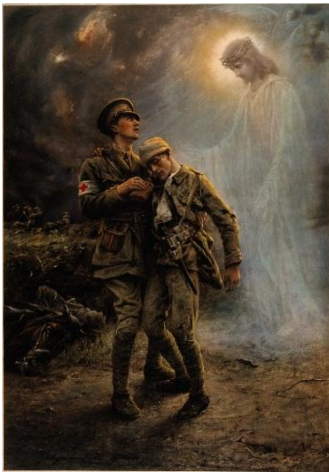
10. Kamarád v bílém stylizován jako Ježíš Kristus. 173