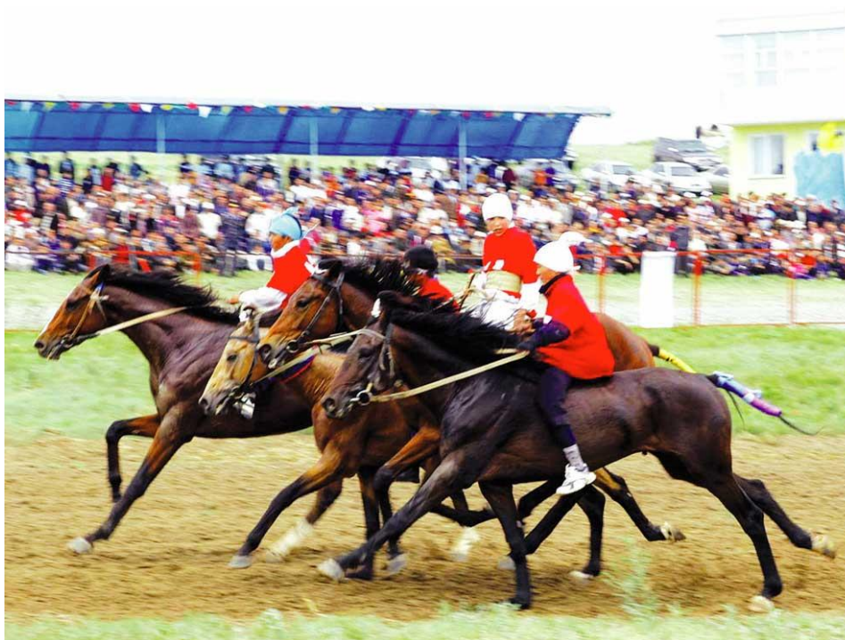
Obrázek 13: Alman – bajga (Алман-байга)