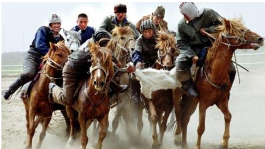
Obrázek 12: Kok-par (Кок-пар)