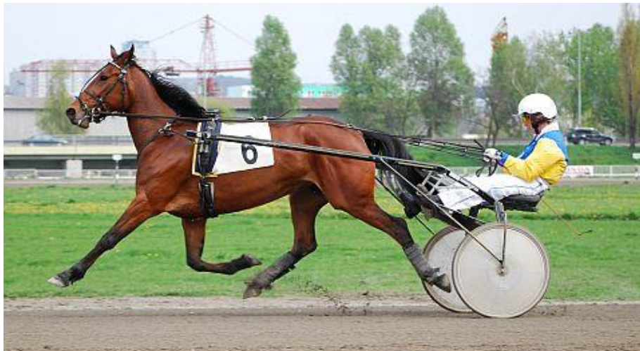
Obrázek 6: Klusácké dostihy