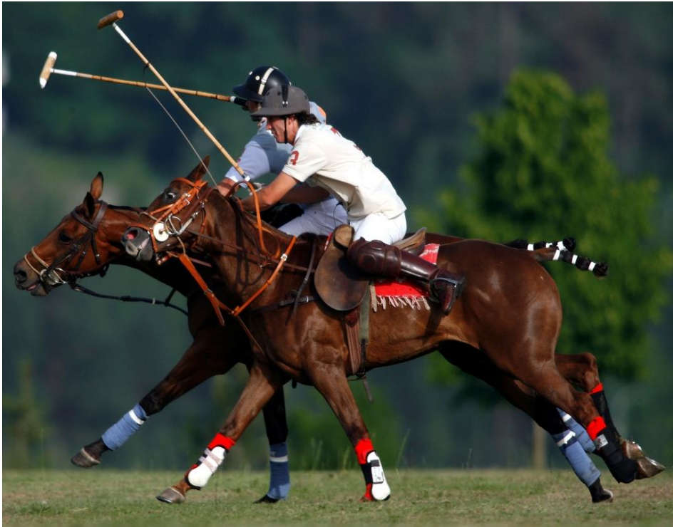
Obrázek 14: Pólo