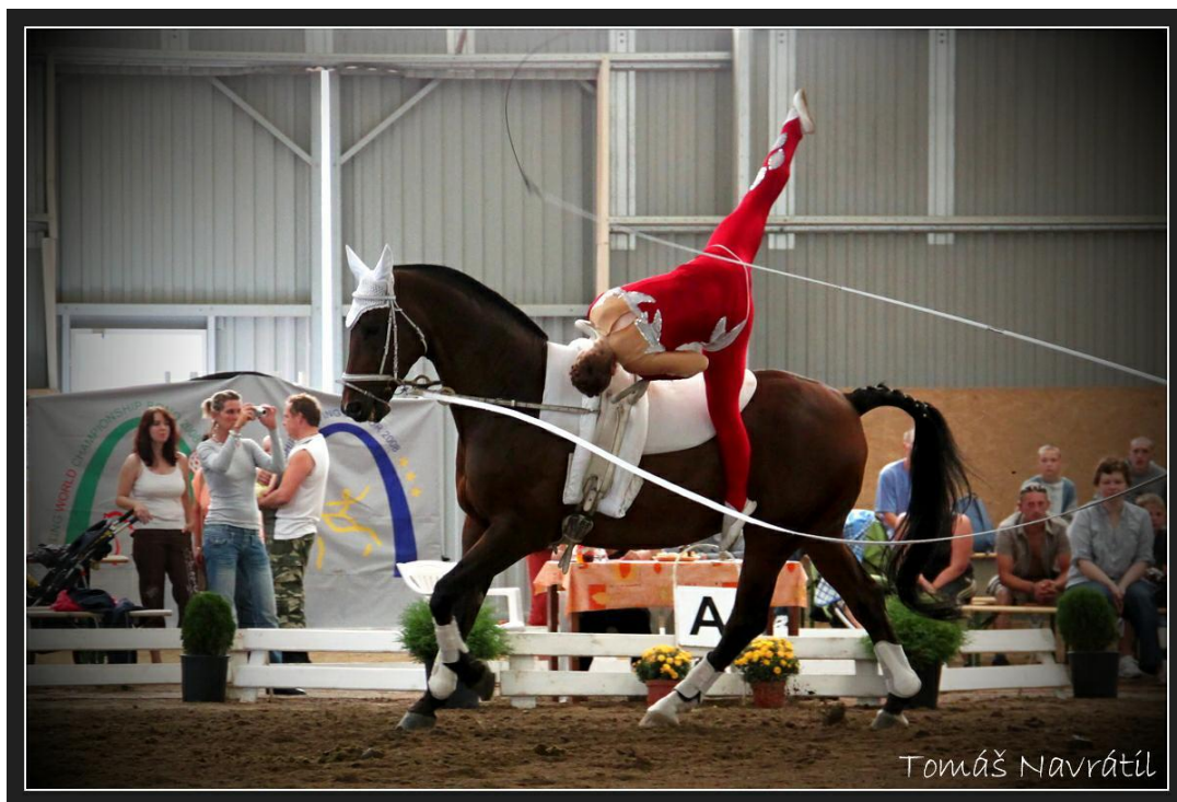
Obrázek 10: Voltiž