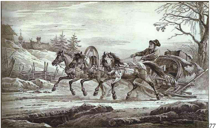
Obrázek 16: Ruská trojka

77 Тройка лошадей. [Тройка лошадей. [online]. [cit. 2014-04-29]. Dostupné z: http://ru.wikipedia.org/wiki/%D0%A2%D1%80%D0%BE%D0%B9%D0%BA%D0%B0?oldid=12335166