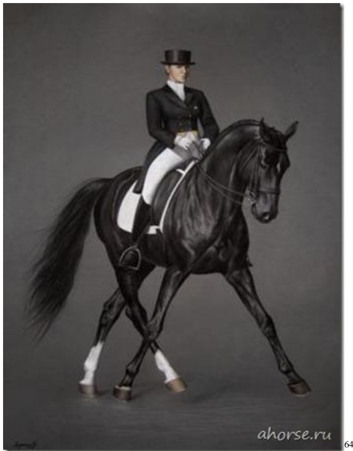
Obrázek 1: Drezúrní úloha: překroky v klusu