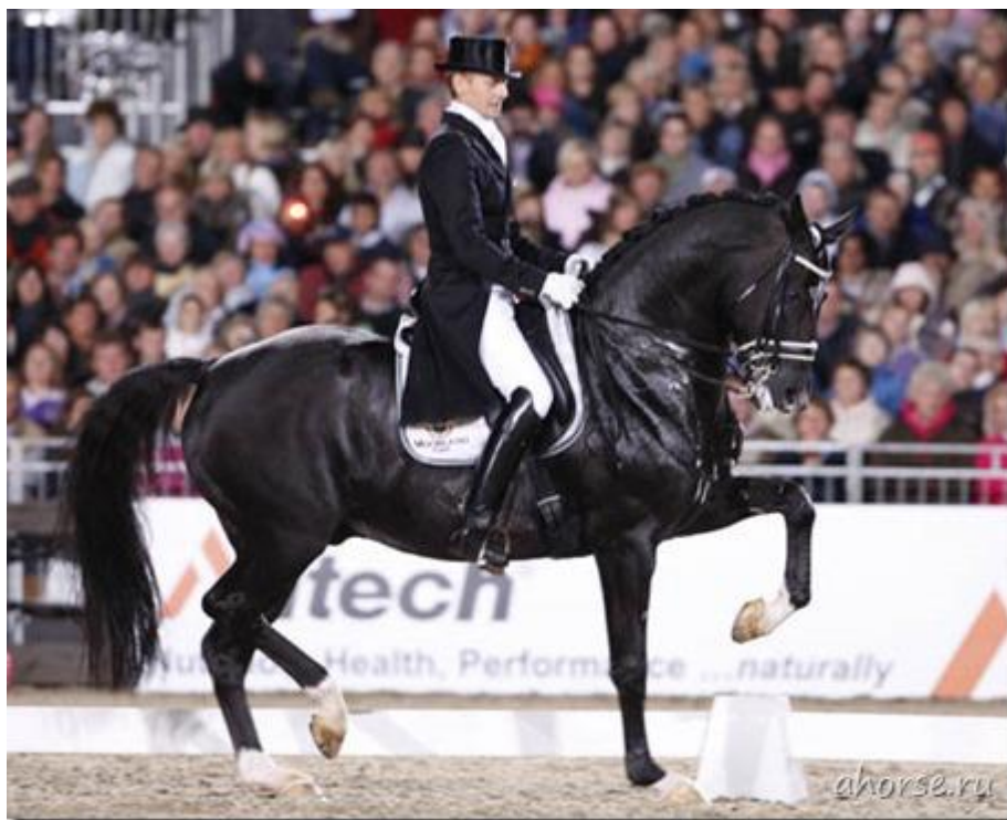
Obrázek 2: Drezúrní úloha: piaffa