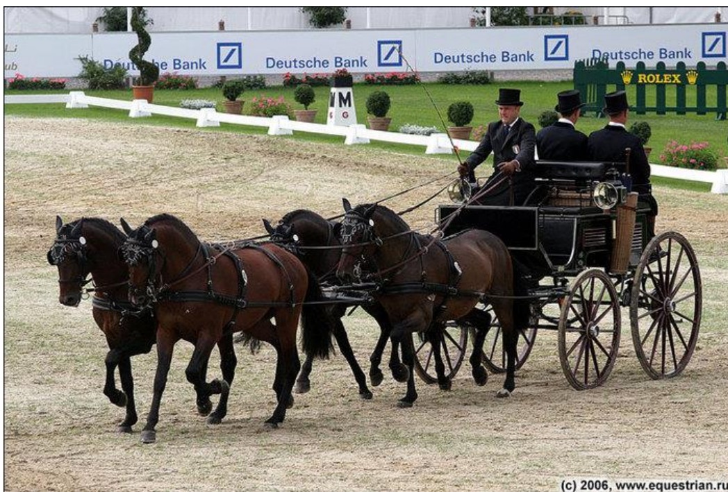
Obrázek 15: Vozatajství: čtyřspřeží