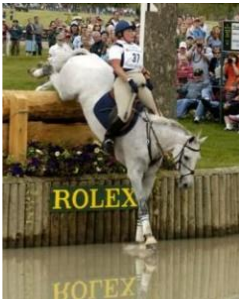
Obrázek 7: Všestrannost