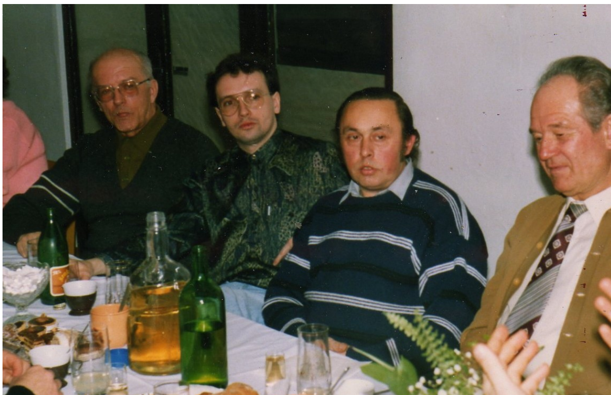
Příloha č. 3