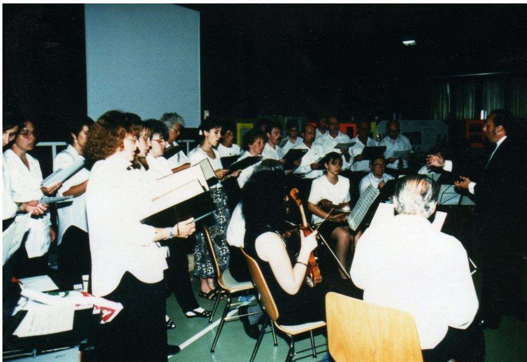
Příloha č. 14