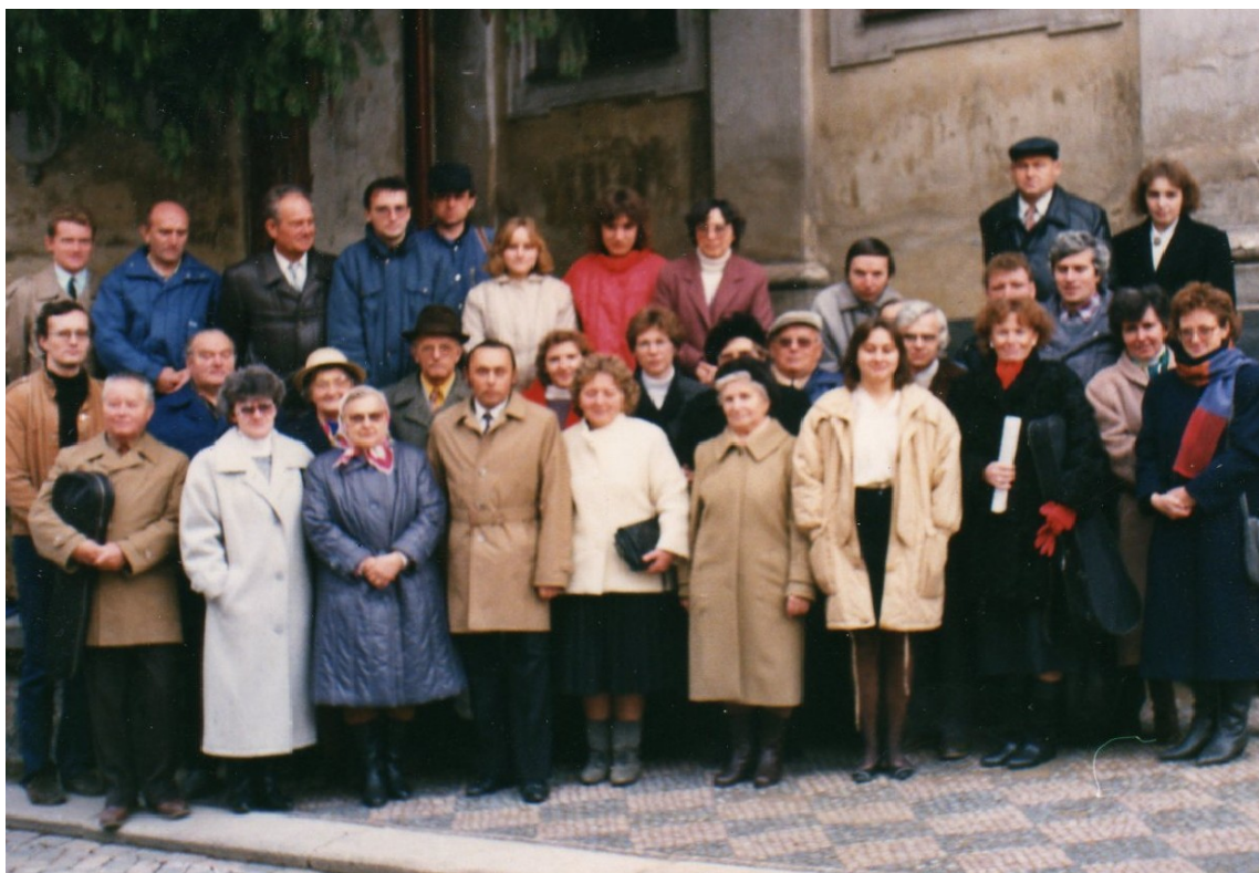
Příloha č. 13