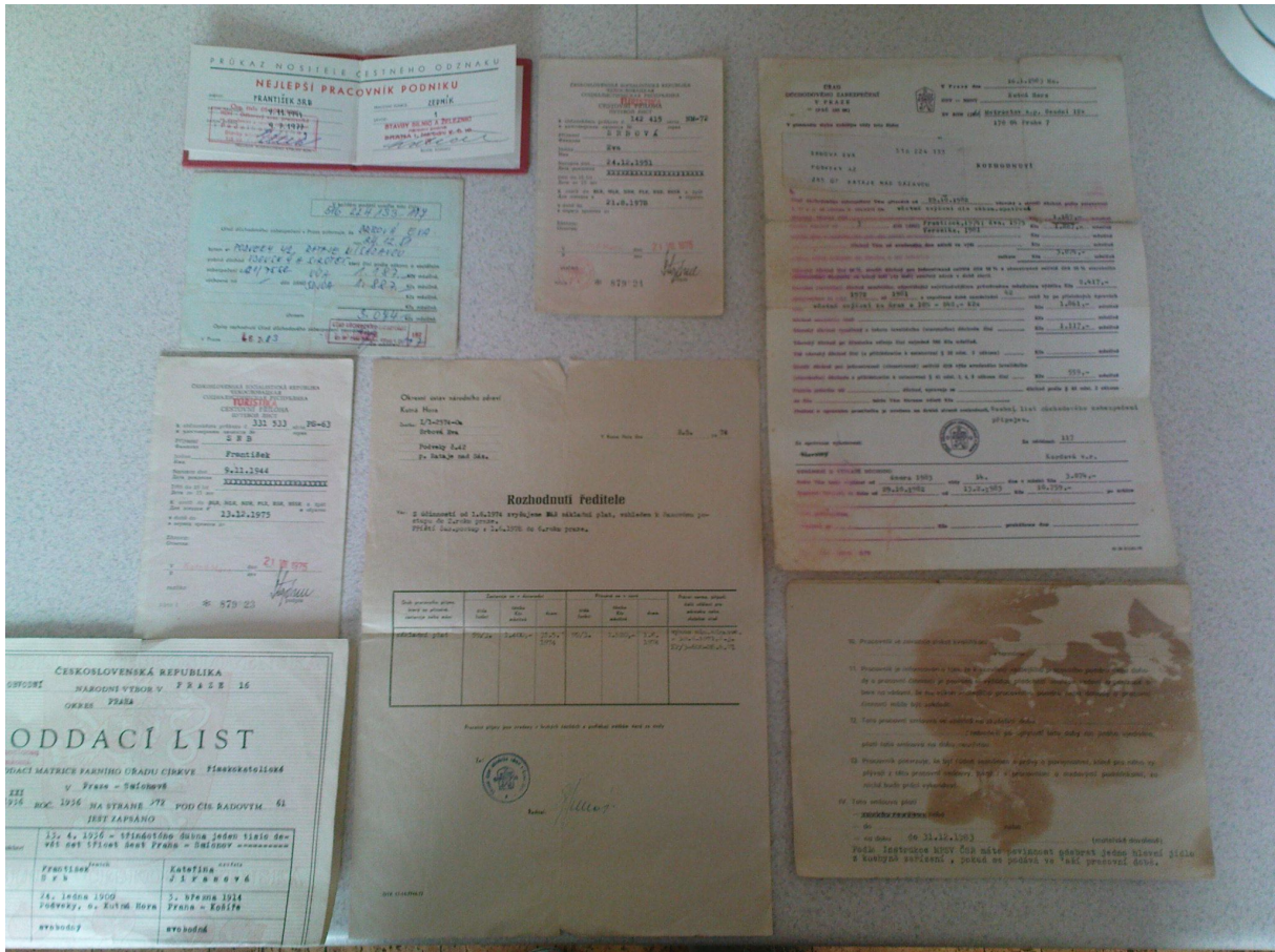
Dokumentace přiložených dokumentů a smluv, fotografie, A4, A5, A3