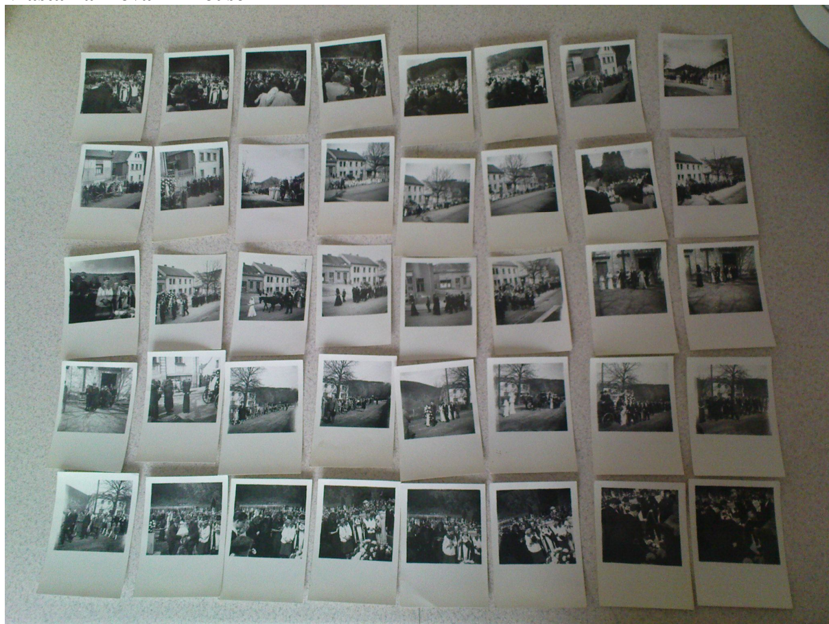
Dokumentace pohřbu, černobílé fotografie, 9x13, 1954