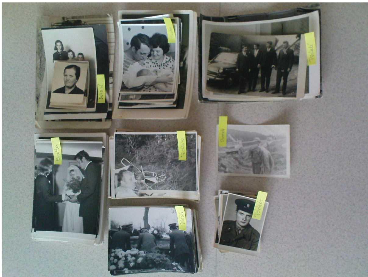
Souborná dokumentace veškerého použitého materiálu, černobílé fotografie, různé formáty, 1944 – 1982