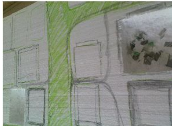
Nákresy a model instalace