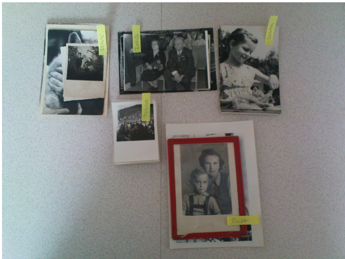
Souborná dokumentace veškerého použitého materiálu, černobílé fotografie, různé formáty