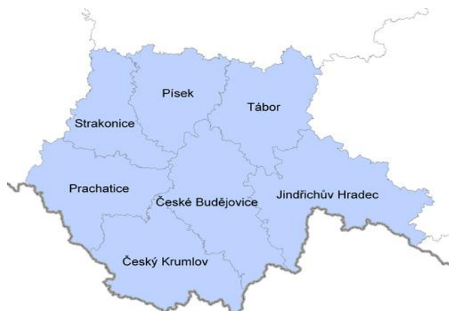
Obrázek 1 Okresy Jihočeského kraje