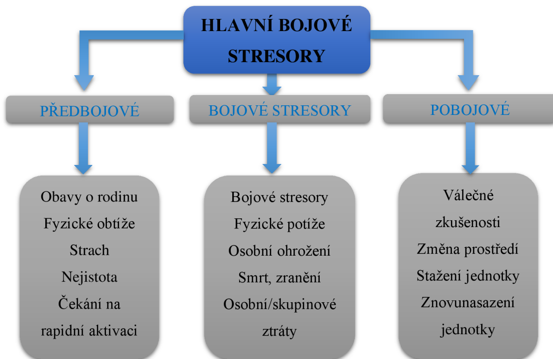
Schéma 1 Hlavní bojové stresory