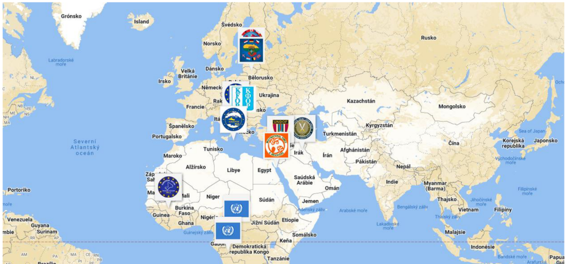
Obrázek 1 Aktuální místa nasazení