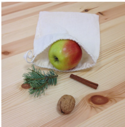
Obr. 6: Předměty ve stereognomickém sáčku

Po zvládnutí může následovat řazení jednotlivých potravin podle druhů pomocí kartiček s barevně označeným okrajem.