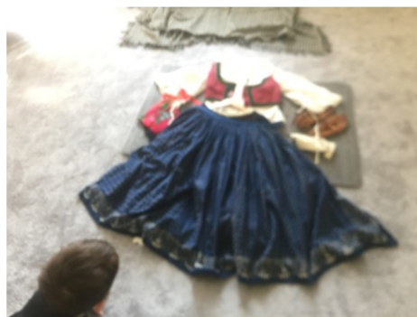
Obr. 8: Prezentace částí ženského valašského kroje