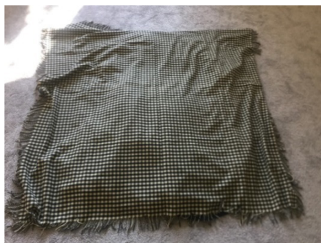
Obr. 7: Tajemství – příprava na prezentaci kroje (motivace)