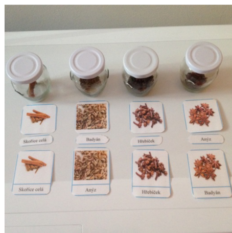
Obr. 5: Čichové lahvičky – koření s třísložkovými kartami