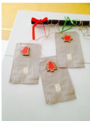
Obr. 2: Příprava adventního kalendáře

Před tímto datem průvodci naplní pytlíky zážitkovými kartičkami, na kterých bude uveden každý den jeden zážitek, který mohou děti uskutečnit jak ve školce, tak i se svými rodinami (např. Dojděte pro Barborku, dejte do vázy a pozorujte, jestli vykvete - Nasypte krmení ptáčkům do krmítka – Zapalte si františka nebo purpuru a proveďte si třídu, zdobení perníčků, zpívání koled...)