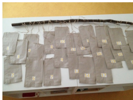
Obr. 3: Adventní kalendář