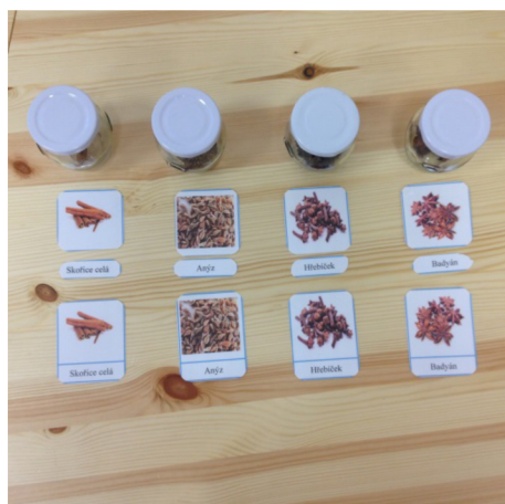
Obr. 4: Třísložkové karty – koření