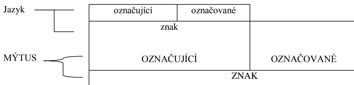
Schéma 2 – Podoba znaku v jazyce a v mýtu (převzato z Barthes (2004: 113))

Pro lepší orientaci zavádí Barthes vlastní pojmy: označující jako výsledný člen primárního systému je smysl , to stejné označující jako výchozí člen sekundárního systému je forma . Označované v sekundárním systému je koncept a znak v tomto systému je signifikace .