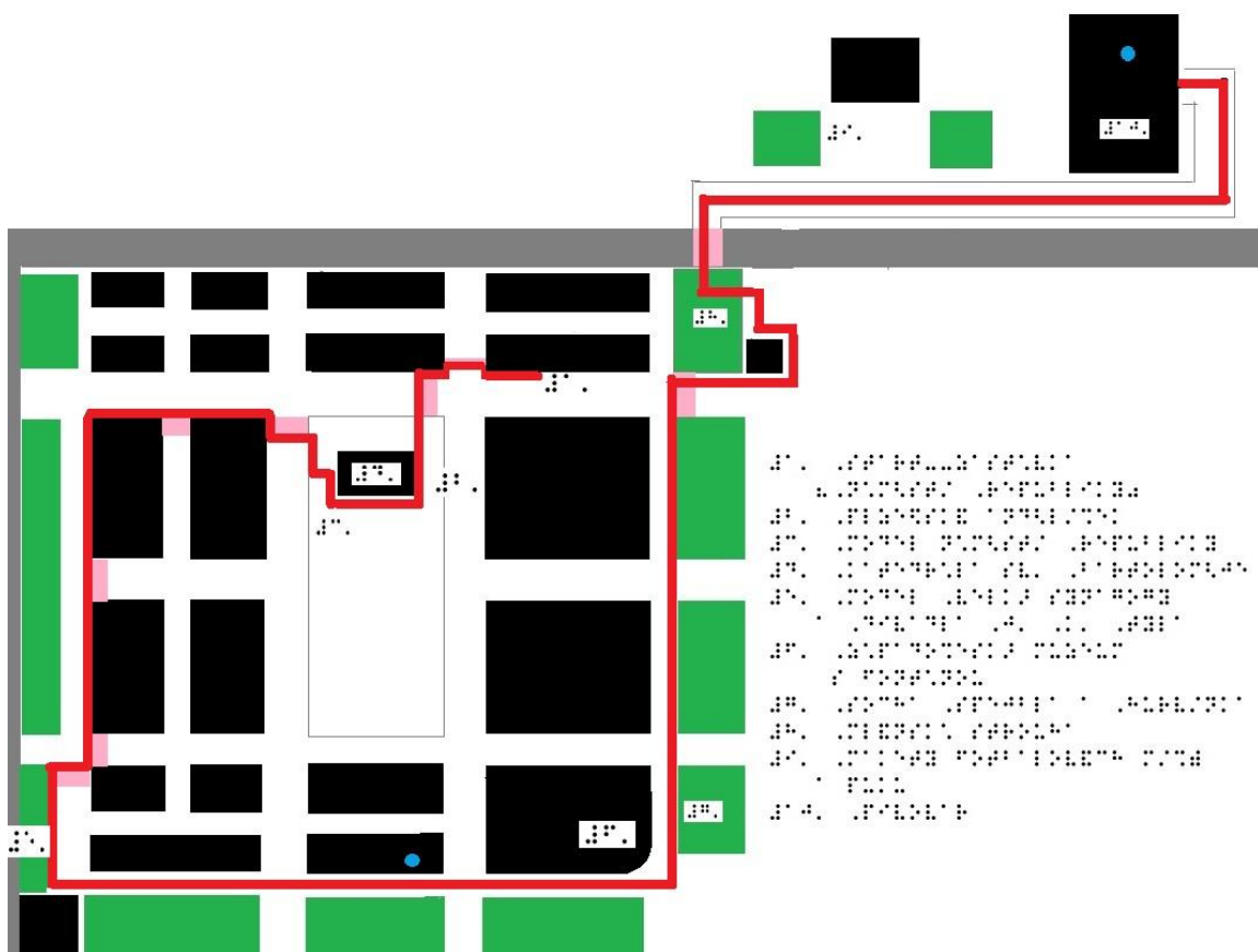
Obrázek 2: Návrh orientační hmatové mapy - Prohlídka centra Plzně