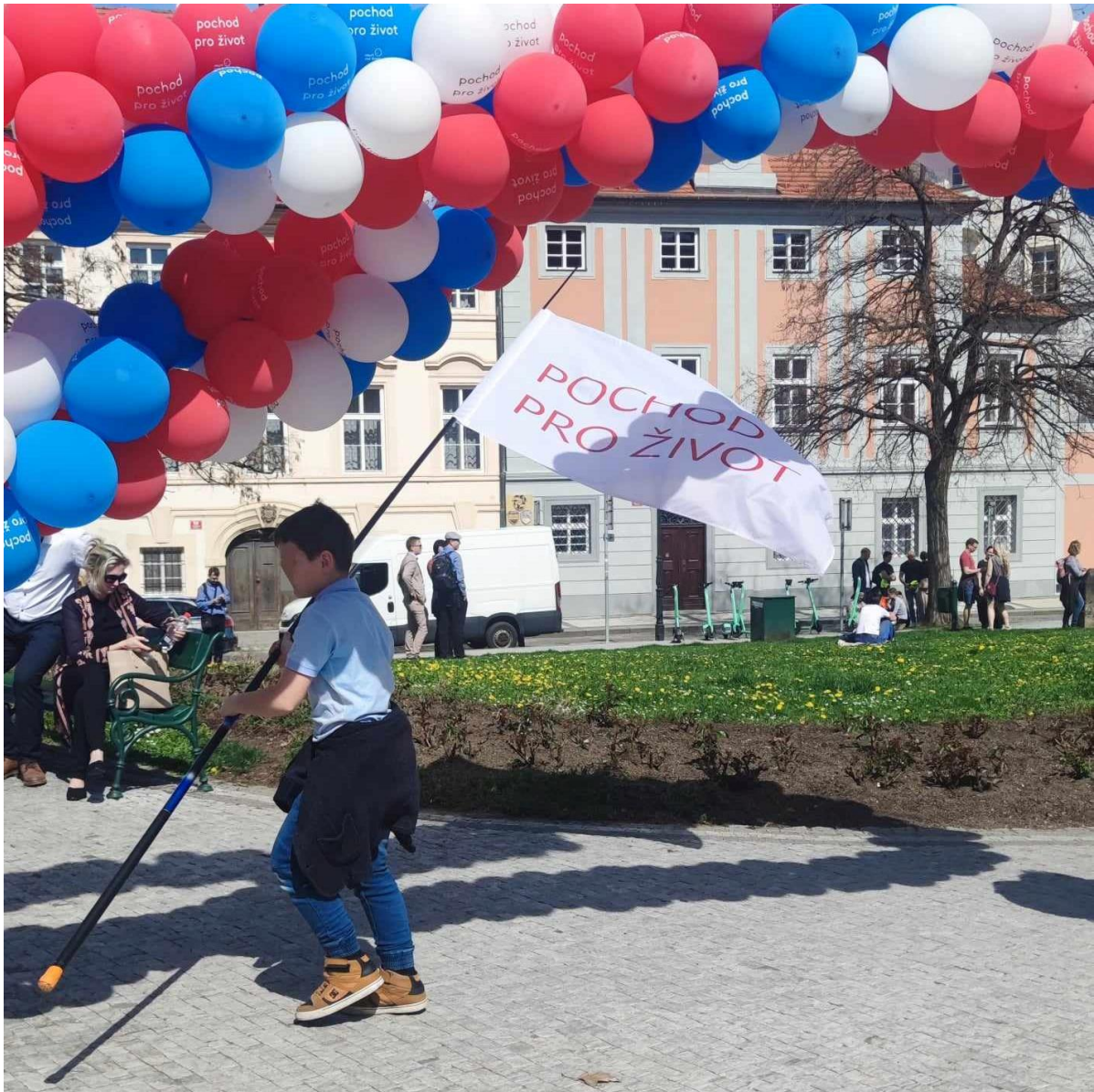
Pochod pro život, 6. duben 2024.

Boj pro-life hnutí probíhá na třech frontách – jedná se o kulturní, politickou a mediální válku. Kulturní válka probíhá posilováním jedné identity a demonizováním těch jiných. Politické úsilí spočívá v lobbingu, v oslovování vlivných zákonodárců a infiltrací do vysokých pater politiky. O této formě prosazování antiinterruptčních cílů jsem psala hlavně v kapitole věnované Hnutí Pro život. Mezi politické snahy patří ale také například sepisování a šíření petic – autorem jedné takové je třeba spolek Stop genocidě. A ke zviditelnění své činnosti a propagaci vlastního přesvědčení slouží mediální prezentace, kterou zajišťuje aktivita na sociálních sítích, webových stránkách, ale i medializace formou grafických panelů a plakátů ve veřejném prostoru. U HPŽ se v tomto případě jedná o zaplnění reklamních ploch s heslem