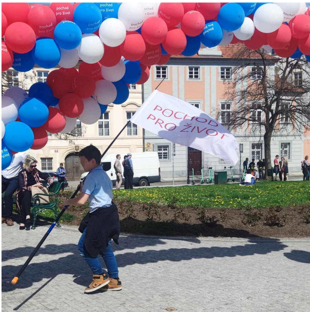
Pochod pro život, 6. duben 2024.

Boj pro-life hnutí probíhá na třech frontách – jedná se o kulturní, politickou a mediální válku. Kulturní válka probíhá posilováním jedné identity a démonizováním těch jiných. Politické úsilí spočívá v lobbingu, v oslovování vlivných zákonodárců a infiltraci do vysokých pater politiky. O této formě prosazování antiinterruptčních cílů jsem psala hlavně v kapitole věnované Hnutí Pro život. Mezi politické snahy patří ale také například sepisování a šíření petic – autorem jedné takové je třeba spolek Stop genocidě. A ke zviditelnění své činnosti a propagaci vlastního přesvědčení slouží mediální prezentace, kterou zajišťuje aktivita na sociálních sítích, webových stránkách, ale i medializace formou grafických panelů a plakátů ve veřejném prostoru. U HPŽ se v tomto případě jedná o zaplnění reklamních ploch s heslem