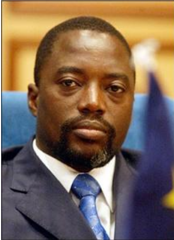
Zdroj: Salon van Sisyphus Online, 2009