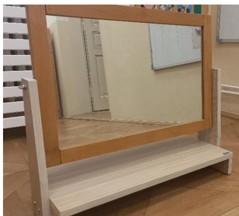
Obrázek 10 - Logopedické zrcadlo