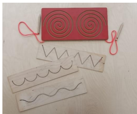
Obrázek č. 8 - Pomůcky podporující rozvoj grafomotoriky