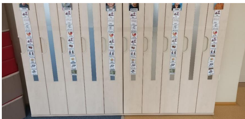
Obrázek č. 1 – Vizualizovaný denní režim

Hlavní metodou realizace vzdělávání je strukturované učení, jehož podstatou je rozčlenění prostoru podle typu činnosti, stejně tak jsou strukturované pracovní úkoly pro děti. Všechny činnosti probíhají na principu strukturalizace, individualizace a vizualizace, aby byl na pohled jasný záměr rozčlenění. Práce s dětmi probíhá individuálně v pracovních nebo během řízených činností ve skupinkách na základě IVP a podrobné dokumentace. Ve třídě se nachází tabule s piktogramy pro denní režim, která dětem pomáhá flexibilně reagovat na změny v programu a díky ní přesně vědí, co a kdy budou dělat (viz obrázek č. 1).