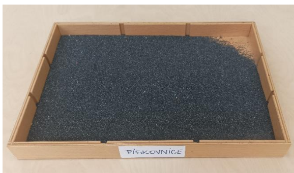
Obrázek 9 - Pískovnice