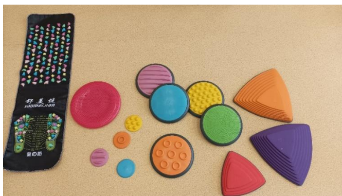
Obrázek č. 11 - Akupresurní masážní koberec, hmatové podlahové disky, balanční podložka