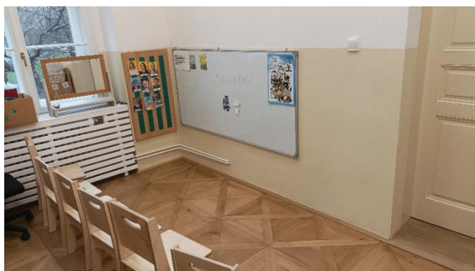
Obrázek č. 2 - Prostor pro komunitní kruh

Třída je rozdělena na tři části. V první části probíhají individuální řízené činnosti a komunitní kruh (viz obrázky č. 2, 3). Ve druhé části se nachází jídelní stoly a zde také probíhá dopolední a odpolední svačina a skupinové práce u stolečků. Na oběd se dochází do společné jídelny v přízemí. Třetí částí je herna, která je prostorná a využívá se k volné hře, pohybovým aktivitám nebo relaxaci a odpočinku (viz obrázek č. 4).