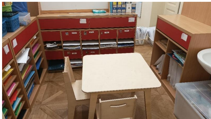
Obrázek č. 3 - Prostor pro individuální práce