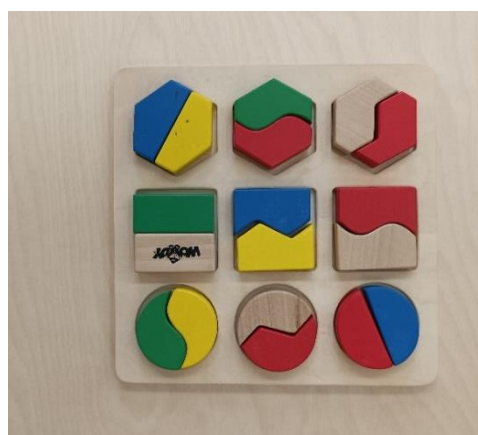
Obrázek č. 6 - Vkládačka různých průřezů