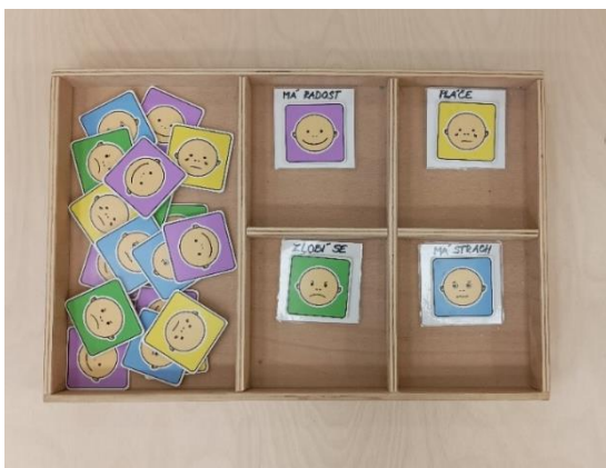
Obrázek č. 7 - Krabice pro strukturované úkoly