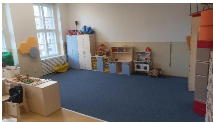
Obrázek č. 4 - Prostor pro spontánní hry, cvičení a odpolední odpočinek